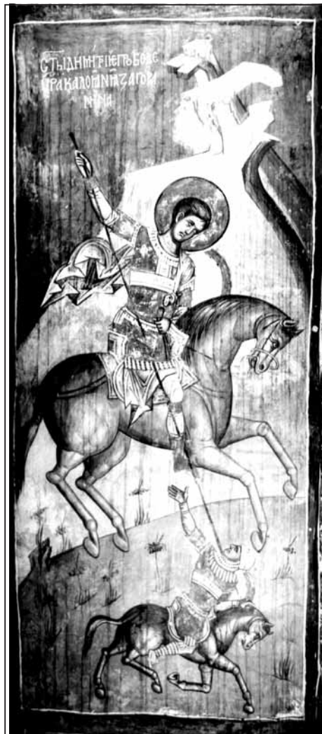
Манастир Дечани, св. Димитрије пробада бугарског цара Калојана (1348)

Новооткривена призренска икона "Свети Димитрије на коњу пробада бугарског цара Калојана на коњу", обогатила је наша сазнања о свеколиком култу светог Димитрија код Срба, који се нарочито истакао у току XIII века. У време како је то истакао Димитри Оболенски, када је: "Бугарског владара Калојана 1204. године крунисао је за краља римски кардинал, а Калојан се за узврат обавезао на верност папи.... Ни Србима није требало дуго да схвате да опадање византијске моћи захтева приближавање Западу, поготово што им је земља још увек била отворена утицају латинског хришћанства које се од јадранске обале ширило на унутрашњост. Негде око 1200. године, Немањин син и наследник Стефан разводи се од своје византијске невесте, царево кћери. Касније се жени унуком Енрика Дандола, опасног млетачког дужда, који је, више него све остале вође четвртог крсташког рата, био одговоран за пад Цариграда. У време када је Калојан почео преговоре са Римом, и Стефан се јавља Иноћентију III, обећава да ће Србију ставити под јурисдикцију Свете столице и тражи краљевску круну. Постигнут је договор и 1217. године Стефана крунише папски легат. Отада је у свом народу познат као Првовенчани". 4