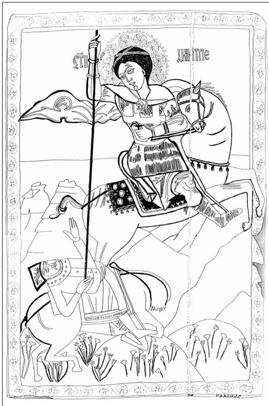
Свети Димитрије на коњу пробада бугарског цара Калојана и спасава Солун, XIII век. Икона из цркве Св. Ђорђа у Призрену. Цртеж, Р. Петровић, 1995.