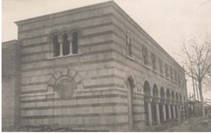
Сл. 3. Мртвачница на новом гробљу у Београду