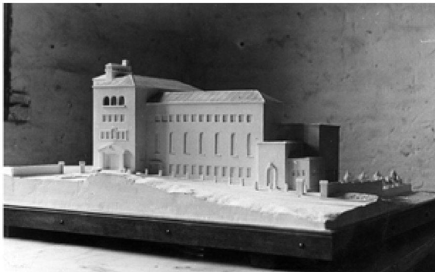
Сл. 7. Ђачка ђрђеза у Абердаревој улици у Беођрагу