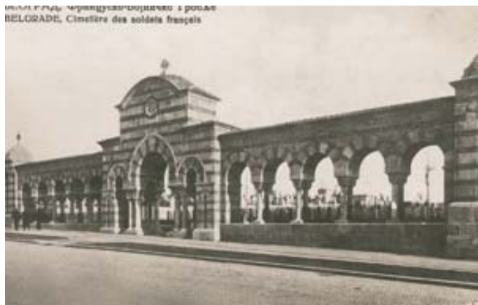
Fig. 2. The fence of the French Military Cemetery

извођењем петнаест објеката у приватном власништву, а чије су званичне копије по предратним прописима најчешће са потписима особа које су представљене као пројектанти, будући да су располагале овлашћењима за пројектовање. 4 То су куће у Мачванској улици бр. 14 и бр. 24, у улици Душана Раденковића бр. 3 и бр. 5, кућа у улици Владете Ковачевића бр. 6, кућа у улици Косте Јовановића бр. 16, Светозара Марковића бр. 6 и друге. Детаљи попут масивног каменог сокла, зидови грубо набацаног малтера или сликовити кровови прекривени ћерамидом, обележја су како јавних здања тако и објеката рађених за приватне поручиоце.