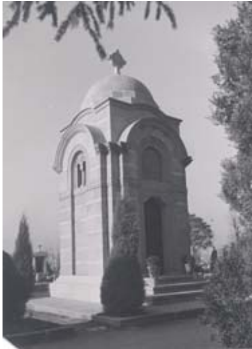
Сл. 5. Капела Христићића на Новом гробљу у Београду Fig. 5. The chapel of the Hristićs at the New Cemetery in Belgrade

Недуго затим, на предлог општинског суда а по одобрењу Његове Светости Патријарха Варнаве, сахрањивање је требало да се врши на начин који више одговара савраменим приликама престонице, те је према пројекту Рајка Татића саграђена мртвачница на Новом гробљу, лево од главног улаза у гробље, са српско-византијском стилском обрадом, али као веома савремено и функционално здање, органично повезано са капијом и спољним аркадама оgrade. 10 Грађевина одише свечаном, немом монументалношћу. Има сутерен, приземље, рашчлањено седмоделним аркадним тремом и спрат на којем се смењују бифоре и трифоре. Унутрашњост, уређена по свим прописима модерне архитектуре, састоји се из шест засебних одаја зиданих у мермеру и камену, потом, обухвата и једну већу, репрезентативнију одају, док се у средини налази капела са одром. Начин зидања који имитира византијско грађење објекту утискује препознатљив српско-византијски карактер. Ипак, примењујући раван кров без икаквих акцената, архитекта је истакао уздржан архитектонски став без претеране декорације, инсистирајући у композицији прочеља на неутралној, мирној и озбиљној подели зона, поштујући достојанство функције објекта. Једноставних линија и складних пропорција, мртвачница представља успешан спој традиционалних елемената и