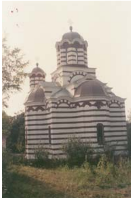
Fig. 6. The church in the village of Sirakovo

модерних концепција у архитектури између два рата. У продужетку ове, завршена је 1937. године капела за испраћај Јевреја ашкенаатског реда, за чије је сахрањивање одређена посебна парцела. 11 Изградњом ових капела променио се и начин сахрањивања у Београду, када су нестале уобичајене дуге пратње које су пролазиле улицама. Колонада од тридесет девет стубова испред капела, која је такође дело архитекте Татића, формира трг за окупљање и испраћај, чинећи посебну архитектонску целину.