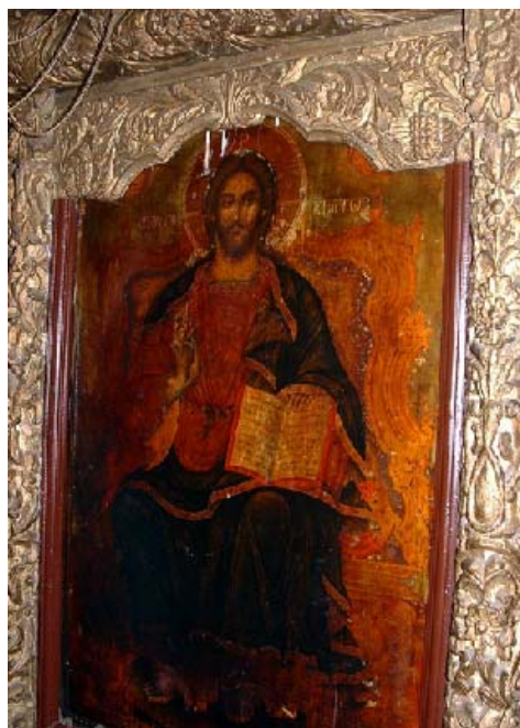
Sl. 9. Престона икона Исуса Христа Fig. 9. The throne icon of Jesus Christ

срећу се и на Хиландарским иконостасима, што сведочи да је чак и у ова тешка времена постојала жива уметничка размена и одашиљање утицаја са Свете Горе, стожера православног Хришћанства. 19