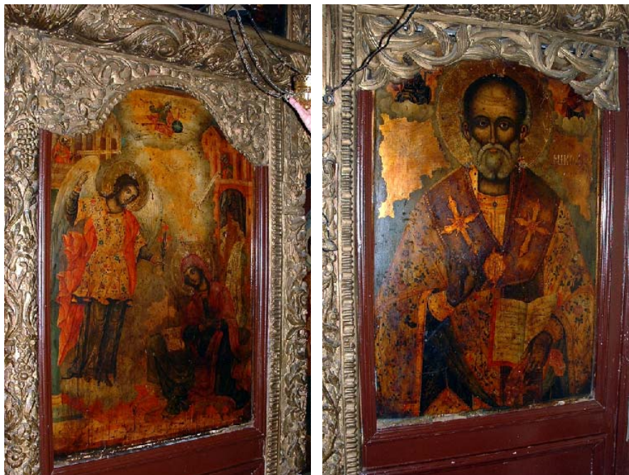
Sl. 12. Престона икона Благовештења Fig. 12. The throne icon of the Annunciation