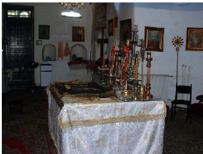
Sl. 6. Олтарски простор Fig. 6. Sanctuary

корпус подведен под заједничку кровну конструкцију. На крову су, са северне и јужне стране, отворена по два прозорска отвора, а са западне само један већи.