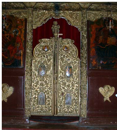
Sl. 7. Царске двери Fig. 7. Royal Gates