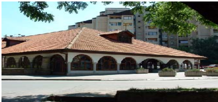
Sl. 1. Храм Св. Арханђела Михаила и Гаврила у Нишу, поглед са северозапада Fig. 1. Church of Holy Archangels Michael and Gabriel in Niš, the northwestern view

Отоманска империја контролисала просторе Јужне и Југоисточне Србије. Строгим нормама о подизању хришћанских светилишта, турске власти су онемогућавале хришћанском живљу да подиже цркве које би својим урбанистичким значајем, архитектонском обрадом и висином парирале џамијама.