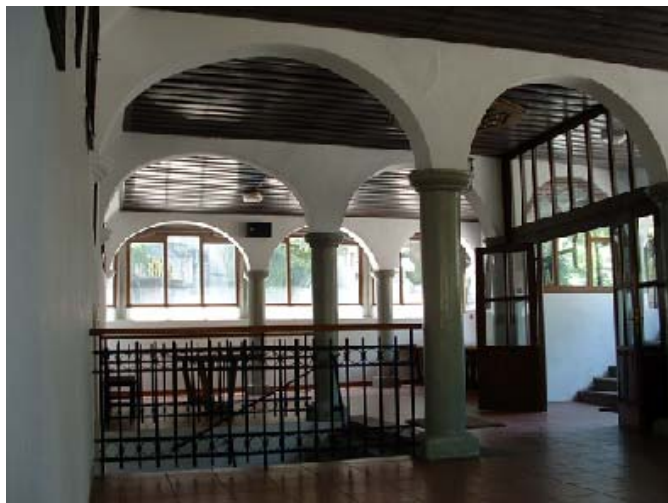
Sl. 5. Егзонартекс Fig. 5. Exonarthex