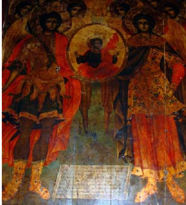
Sl. 2. Икона Сабор Св. Архангела, са записом о времену подизања храма Fig. 2. The icon „Synaxis of Holy Archangels“, containing the note on the Church construction date

готово да није ни било, јер је отворено свега неколико изузетно малих прозора. 9 Прелиминарна археолошка истраживања показују велики степен вероватноће да је Мали нишки саборни храм подигнут на старијем култном месту. 10