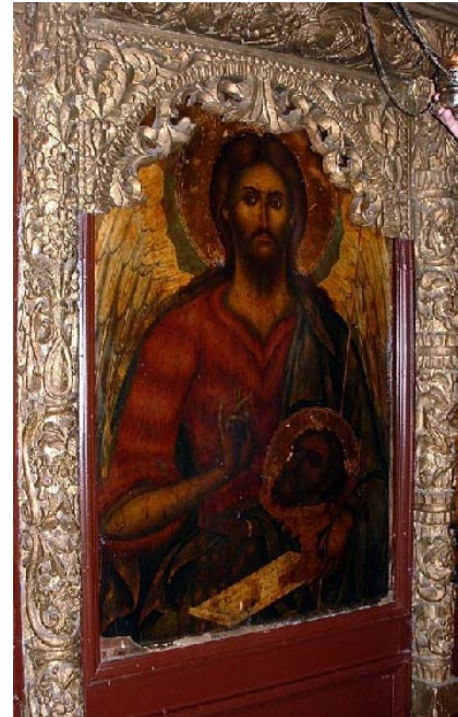
Sl. 11. Престона икона Св. Јована Крститеља Fig. 11. The throne icon of St John the Baptist

недовољне истражености, сазнања о карактеристикама, вредностима и донетима ове архитектуре била су веома скромна. Неправедно упоређене са градитељским корпусом епохе просперитета, ове грађевине, које су, услед финансијске оскудице и константних опструкција завојевача, биле лишене архитектонских декоративних егзибиција, једнострано су и погрешно оцењене као уметнички неуспеле. Несумњиво је да се у ограниченим и спутаним градитељским условима не могу очекивати водеће идејне и уметничке појаве, али су управо овакве грађевине, преносећи у упрошћеном виду основне просторне и конструктивне концепције византијског градитељства, биле главни носиоци идеје трајања средњовековне архитектуре византијских духовних основа. Мали нишки саборни храм, својим конструктивним склопом, припада једном веома раширеном, специфичном изданку поствизантијске архитектуре, великој скупини грађевина које су подизане на широком простору Балкана, од Епира, Македоније, Јужне Србије и Бугарске. Елементи ове архитектуре уочавају се најпре у базиликалној просторној организацији, опточавању главног корпуса грађевине спољним тремовима, обликовању олтарских апсида и примени низа детаља секундарне декоративне пластике. Храм Св. Арханђела у Нишу јесте лишен сликовитости и упечатљивости, али не и саме суштине његовог постојања. Житељи Ниша начинили су мудар избор; жртвујући форму они су успели да врате у живот духовно