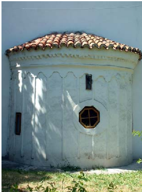
Sl. 4. Главна апсида Fig. 4. The principal apsis

У осовини главног брода се налази главна апсида, изнутра полукружна, а споља тринаестострана. (сл. 4) Странице апсиде су декорисане плитким пиластрима повезаних низом слепих аркадица, карактеристичним елементима византијске декорације. Апсида