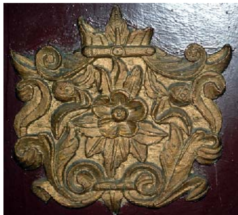
Sl. 8. Детаљ са иконостаса Fig. 8. A detail of the iconostasis