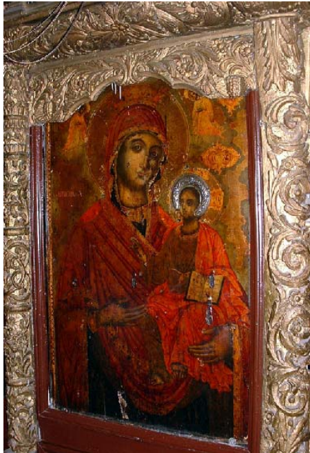
Sl. 10. Престона икона Богородице са Христом Fig. 10. The throne icon of the Virgin Mary Eleousa