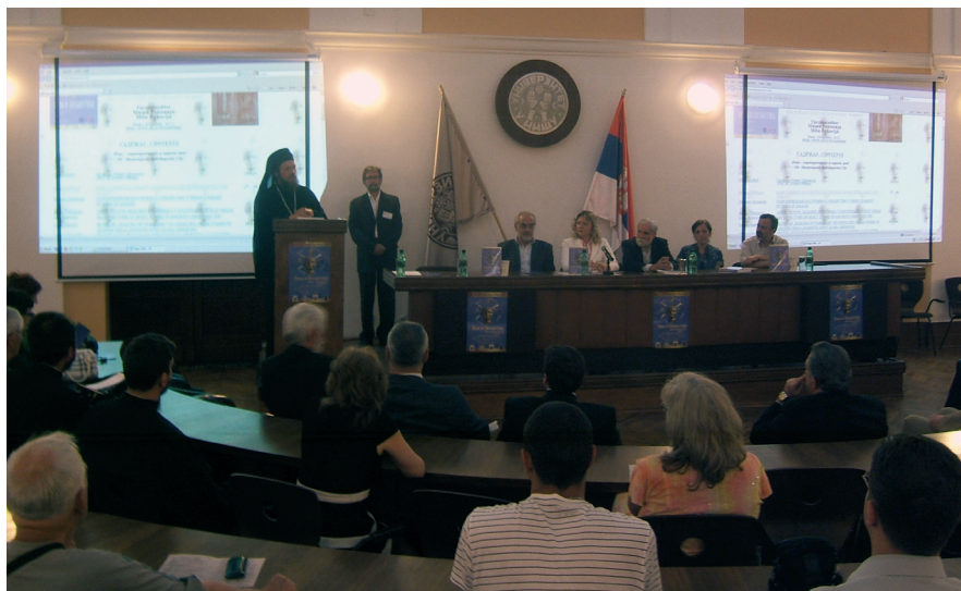
Сл. 1 Његово Преосвештенство Епископ нишки Господин др Јован, свечано отварање симпозијума „Ниш и Византија XI“