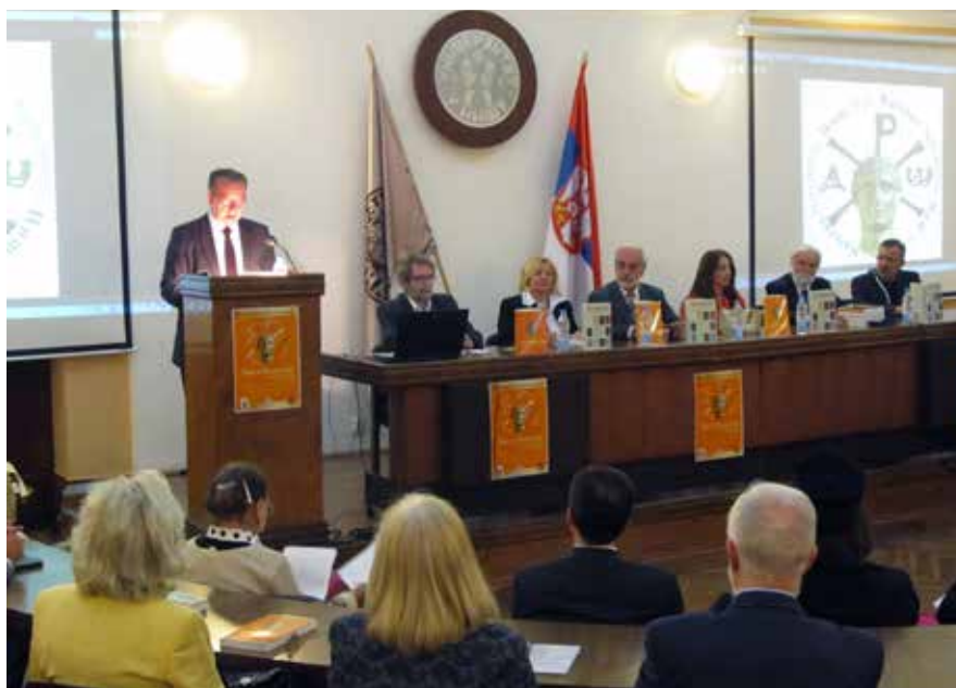
Сл. 4 Градоначелник проф. др Зоран Перишић Photo 4 : Mayor of the City of Niš, Zoran Perišić, PhD

За ових 12 година, захваљујући научним аргументима овде изложеним, измењена су и допуњена наша знања о граду Нишу, обједињена у посебном издању зборника под именом „ Ниш и хришћанско наслеђе “. Захваљујући новим открићима, прошлост града Ниша сада изгледа другачије. То је омогућило граду Нишу да заузме видно место у културном мозаику Европе.