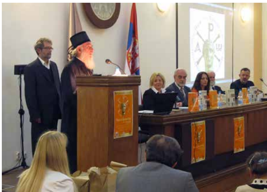
Сл. 1 Патријарх српски господин Иринеј Photo 1: Serbian Patriarch Mr. Irinej

састављен од почетних слова Христовог имена, од овог тренутка зван и као Константинов монограм. Рационални Константинов дух побуђен искреном вером у једног Бога, бива наведен на овај гест, без сумње, искрено прихваћен од војника хришћана, што му је омогућило победу над Максенцијем. Захваљујући овој судбоносној победи он верује у једног Бога и већ следеће године, заједно са Лицинијем, доноси Милански едикт који представља прекретницу у историји човечанства. Константин Велики, први хришћански цар, потоњи Св. цар Константин, успоставља византијску духовност, државу, цивилизацију, културу и уметност. Захваљујући њему европски народи су цивилизацијски и културно обједињени.