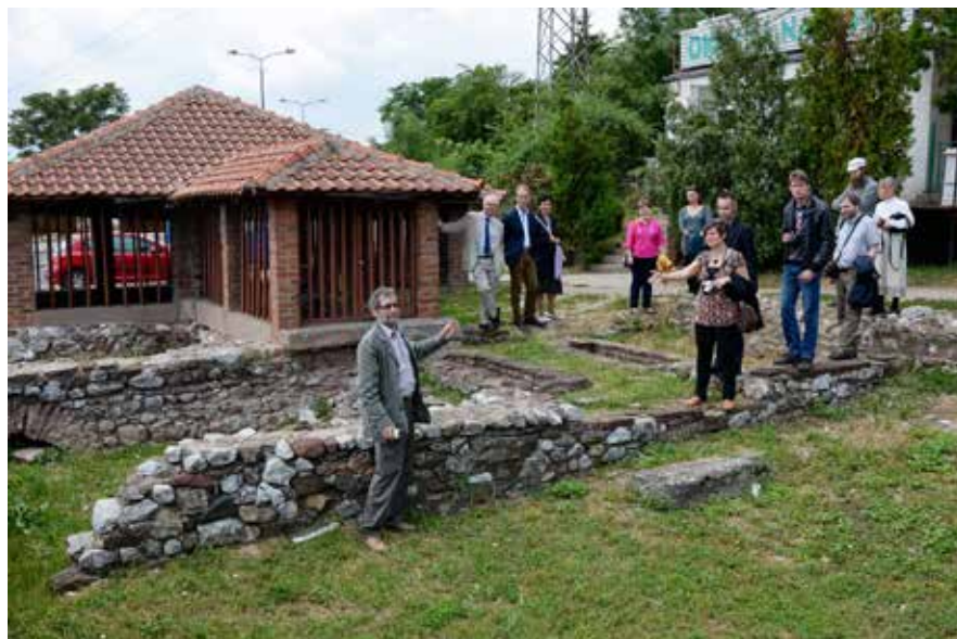
Сл. 11 Обилазак Базилике мученика у Нишу Photo 11: Visit to the Martyrium Basilica in Niš

Ове године пријаве за учешће је послало 118 аутора. И поред тога што је симпозијум трајао један дан дуже, организатор и поред најбоље воље а из добро знаних разлога, морао је да ограничи број учесника. Због знаних економских прилика град Ниш је скупио снаге и позвао 75 учесника и то из: из Велике Британије, Аустрије, САД, Канаде,