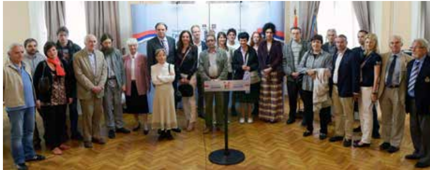
Сл. 10 Учесници симпозијума „Ниш и Византија XII“ Photo 10: Participants of the symposium Niš and Byzantium XII