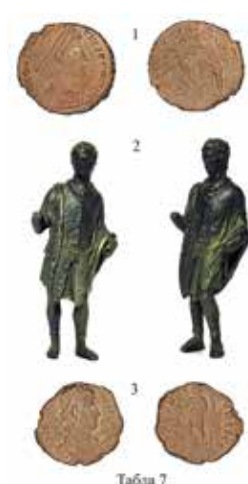
Табла 7: 1) Бронзани новац, ковање Констанција I, „Лазарев град“-Крушевац, 2) Фигурина „Римљанина“, Лазарев град“-Крушевац, 3) Бронзани новац, ковање Констанција I, „Лазарев град“-Крушевац.