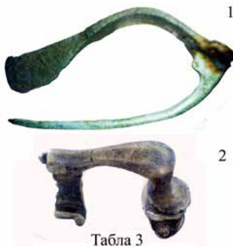
Табла-3: 1) Бронзана зглобна фибула тракастог лука, блиска Ауциса фибулама, Течић-Кавадар, 2) Сребрна зглобна коленаста фибула, Течић-Кавадар.

Tafel-2: 1) Bronze-Bogenfibel mit Knopf-„Borački krš“?, Bogenfibel aus Bronze mit Knopf-Boracki krs?, 3) Fibel aus Bronze mit umgeschlagenem Fuß-„Borački krš“ ?.