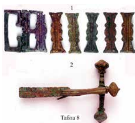
Табла 8: 1) Делови појасне опреме, Александровац, 2) Бронзана крстообразна фибула, Александровац.