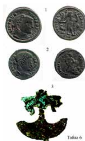
Табла 6: 1) Бронзани новац, ковање Констанција Великог, „Конопљара“-Читлук, 2) Бронзани новац, ковање Константина Великог, „Конопљара“-Читлук, 3) Пелта фибула, „Конопљара“-Читлук.