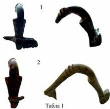
Табла-1: 1) Изразито профилисана фибула, дериват типа Окораг-Радмиловићи ?, 2) Фибула, дериват типа Окораг- Радмиловићи ?.

Tafel-1: 1) Deutlich profilierte Fibel, Derivat vom Typus Okorag-Radmilovići, ? 2) Fibel, Derivat vom Typus Okorag-Radmilovići ?.