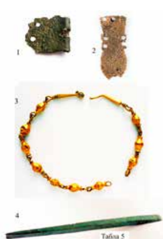
Табла 5): 1) Део појасне копче, гроб 126, „Конопљара“-Читлук, 2) Украс у облику амфоре, гроб 126, „Конопљара“-Читлук, 3) Златна оглрица, „Конопљара“-Читлук, 4) Бронзано длето, „Конопљара“-Читлук.