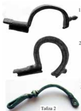
Табла-2: 1) Бронзана лучна Т фибуле са дугметом-„Борачки крш“ ?, 2) Бронзана лучна Т фибуле са дугметом-„Борачки крш“ ?, 3) Бронзана фибула са посувраћеном стопом-„Борачки крш“ ?.

Tafel-1: 1) Deutlich profilierte Fibel, Derivat vom Typus Okorag-Radmilovići, ? 2) Fibel, Derivat vom Typus Okorag-Radmilovići ?.