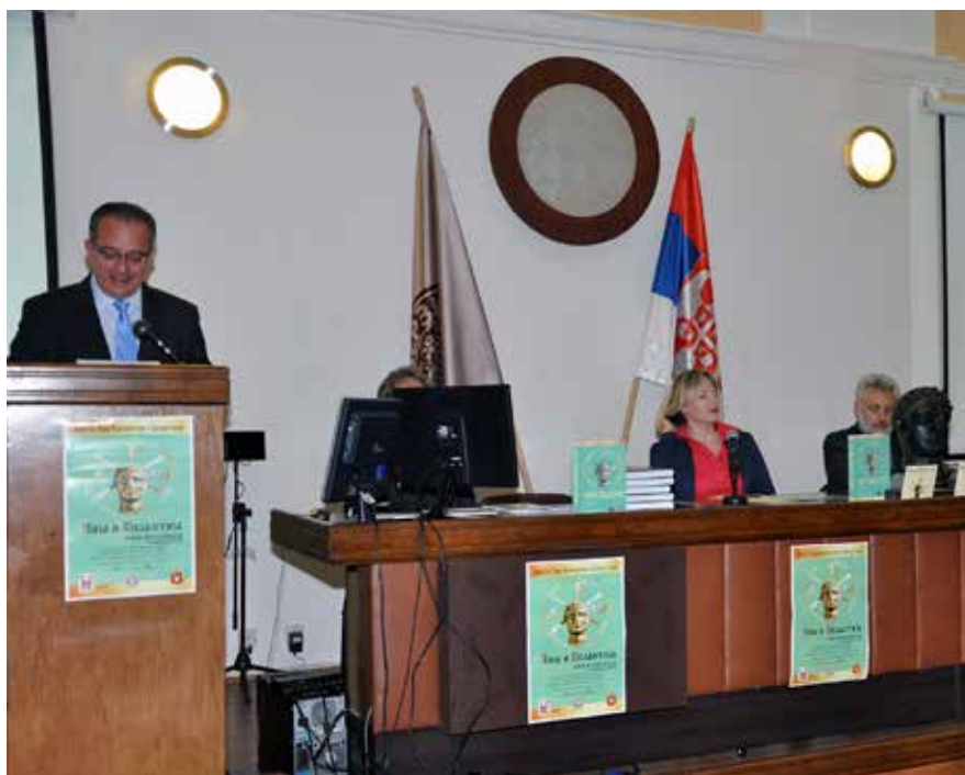
Сл. 2 Градоначелник проф. др Зоран Перишић Fig. 2 Mayor of Niš Zoran Perišić, MD, PhD

„младићевом мудрошћу“, те Немању дарива угледним државним византијским достојанством под именом „Царски сан“. Да ли је само случајност то што византијски цар награђује Немању достојанством са именом „Царски сан“, и то баш у родном граду св. цара Константина?