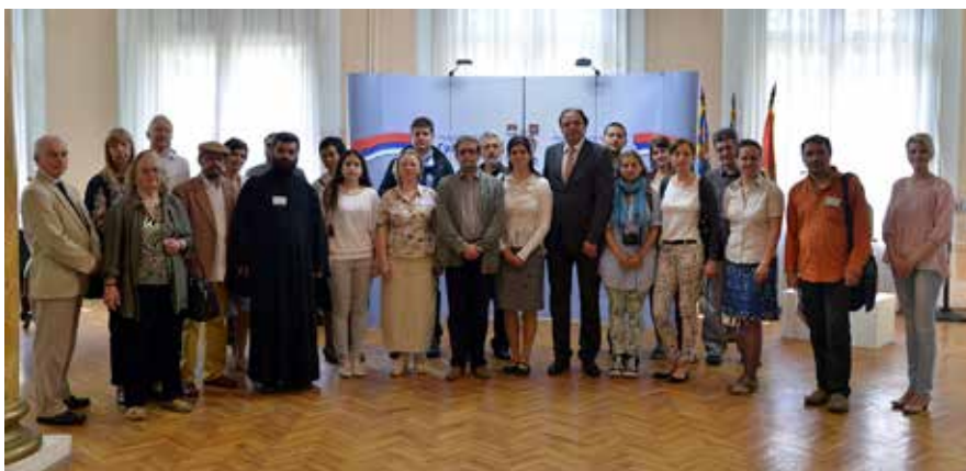
Сл. 5 Учесници симпозијума Ниш и Византија XIII Fig. 5 Niš and Byzantium XIII symposium participants