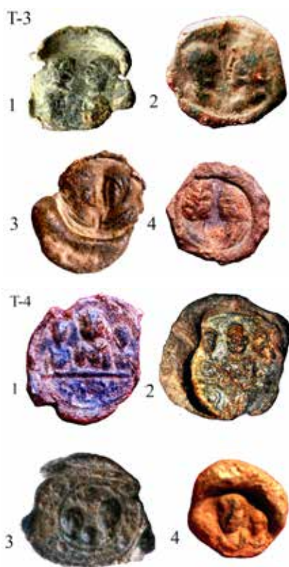
Табла 3: 1) Пломба са представом тетрарха, (доњи ред прилично излизан), 2) Пломба са представом два лика, савладари, 3) Пломба са представом два лика, савладари, 4) Пломба са представом два лика, лик лево, женска особа (царица).

Tafel 3: 1) Die Plombe mit der Abbildung eines Tetrarchs (untere Reihe ziemlich beschädigt), 2) Die Plombe mit der Abbildung zweier Gestalten, die Tertrachen, 3) Die Plombe mit der Abbildung zweier Gestalten, die Tertrachen, 4) Die Plombe mit der Abbildung zweier Gestalten, die Gestalt links ist weiblich (Kaiserin).