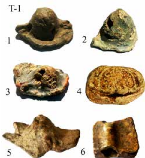
Табла 1) Облици пломби из збирке С. Ристића из Рутевца, пореклом са локалитета Пресидијум Помпеји.

Tafel 1: Die Figuren der Plomben aus der Sammlung des Herrn Ristic aus Rutevac, stammend von dem Lokalität Praesidium Pompei.