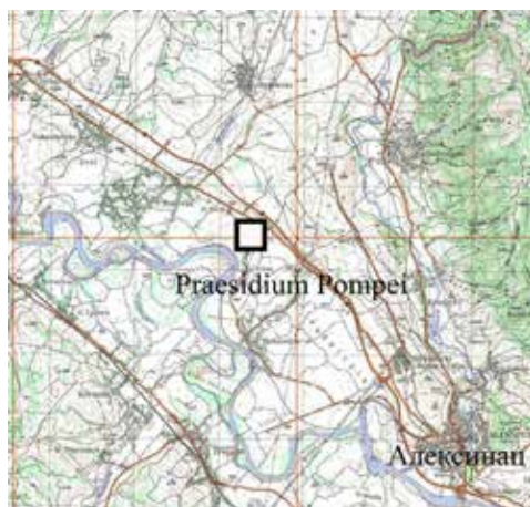
КАРТА: Карта са локалитетом Пресидијум Помпеји

KARTE: Karte mit dem Lokalität Praesidium Pompei.