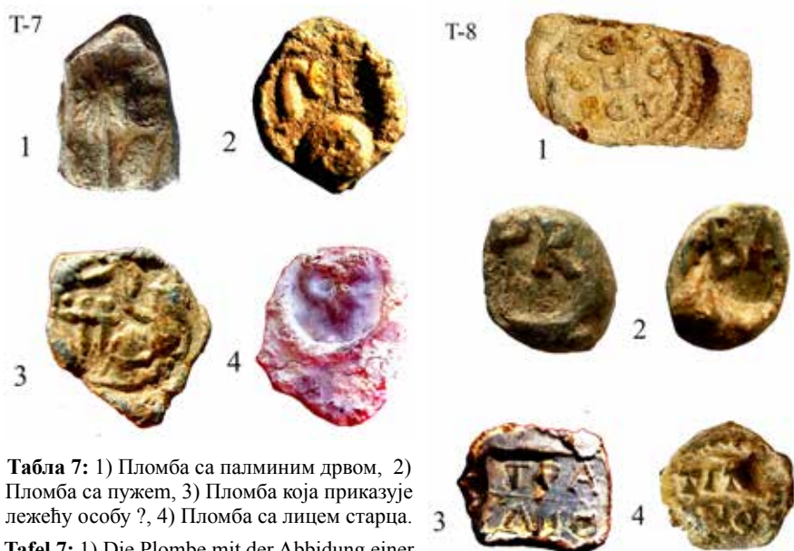
Табла 7: 1) Пломба са палминим дрвом, 2) Пломба са пужет, 3) Пломба која приказује лежећу особу ?, 4) Пломба са лицем старца.

Tafel 7: 1) Die Plombe mit der Abbildung einer Palme, 2) Die Plombe mit der Abbildung einer Schnecke, 3) Die Plombe mit der Abbildung einer liegenden Person, 4) Die Plombe mit der Abbildung eines alten mannes.