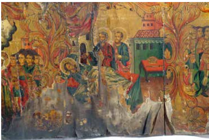
Сл. 11 Визија Часног крста, икона, црква Свете Богородице у Битољу, 1875.

Fig. 10 icon sts. Constantine and Helen, the church of the Virgin in Bitola, 1875.