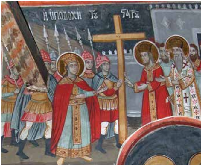
Сл. 7 Манастир Ксиропотам, Уздицање часног крста. 1783.

Fig. 6 Monastery Xiropotamu 1783, Baptisam of the Emperor Constantine