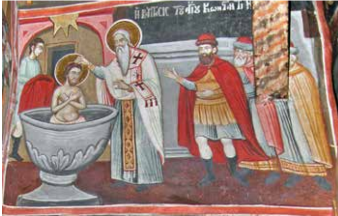
Сл. 6 Манастир Ксиропотам, Крштење цара Константина, 1783.

Fig. 6 Monastery Xiropotamu 1783, Baptisam of the Emperor Constantine