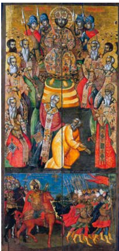
Сл. 1 Икона, Први екуменски сабор и Визија цара Константина, Музеј у Корчи, 1765.