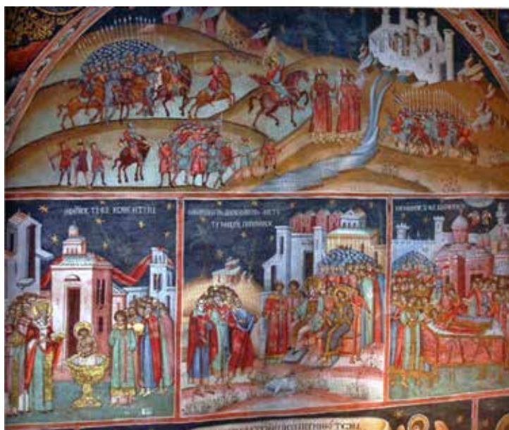
Сл. 8 манастир Хурез 1694 г., циклус цара Константина