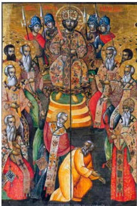
Сл. 2 Икона, Први екуменски сабор, Музеј у Корчи, 1765, детаљ

У доњем делу иконе насликана је Константинова визија Часног крста , необична и ретка композиција којом се представља пресудни моменат у животу овог цара, а који претходи едикту из 313 године, и односи се на догађај који ће променити ток историјских збивања у касноримском царству. Композиција је пуна динамике, све насликане фигуре су у покрету, а посебно војници који корачају испред цара у ратничким одежама, са златним панцирима и са високо уздигнутим копљима и заставама које се вијоре (сл. 3). Посебну живописност овој скупини дају разнобојни шлемови са белим перјаницама и огртачи који се вијоре на леђима војника. Иза војника насликан је цар Константин на коњу, у војничком оклопу, са