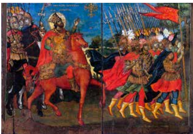
Сл. 3 Икона, Визија цара Константина, Музеј у Корчи, 1765., детаљ