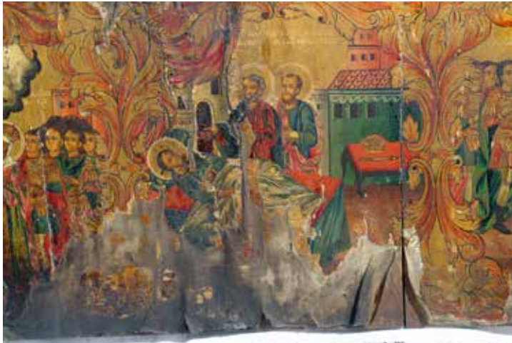
Сл. 11 Визија Часног крста, икона, црква Свете Богородице у Битољу, 1875.