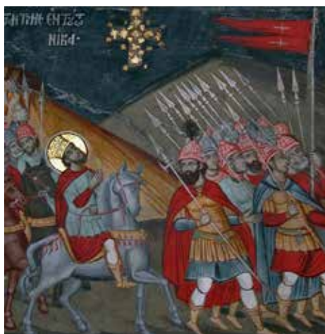
Сл. 4 Манастир Ксиропотам, Визија цара Константина 1783.

Fig. 4 Monastery Xsiropotamu, 1783- the Vision of the emperor Constantine of the Holy Cross