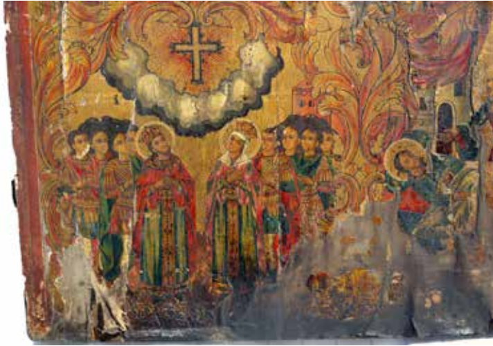
Сл. 10 Икона, св. Константин и Јелена, црква Свете Богородице у Битољу, 1875.