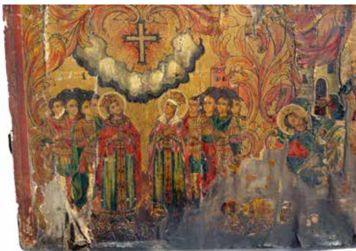
Сл. 10 Икона, св. Константин и Јелена, црква Свете Богородице у Битољу, 1875.

Fig. 10 icon sts. Constantine and Helen, the church of the Virgin in Bitola, 1875.