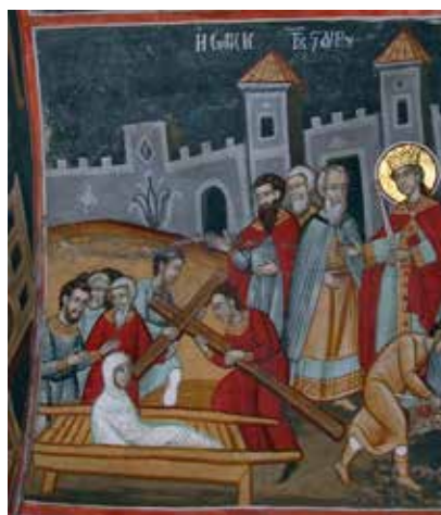
Сл. 5 Манастир Ксиропотам, Проналажење часног крста и исказивање његове чудотворне моћи, 1783.

Fig. 4 Monastery Xsiropotamu, 1783- the Vision of the emperor Constantine of the Holy Cross