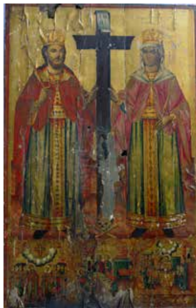
Сл. 9 икона, св. Константин и Јелена, црква Св. Богородице у Битољу.

Да континуитет сликања житијних циклуса цара Константина постоји и у уметности друге половине XIX века, доказују и две иконе са неколико сцена из живота овог цара из цркве Светог Благовештења у Прилепа и Свете Богородице у Битољу. (сл.9) Иконе су настале 1855 и 1875, и по иконографским појединостима скоро су идентичне, и на њима су, поред