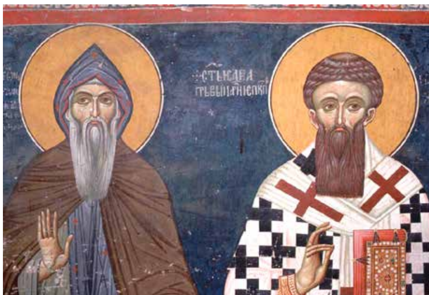
Сл. 22. Свети Симеон Српски и свети Сава Српски, Лесново