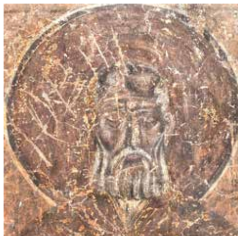
Сл. 4. Свети Сава Освећени, Жича, Спасова црква