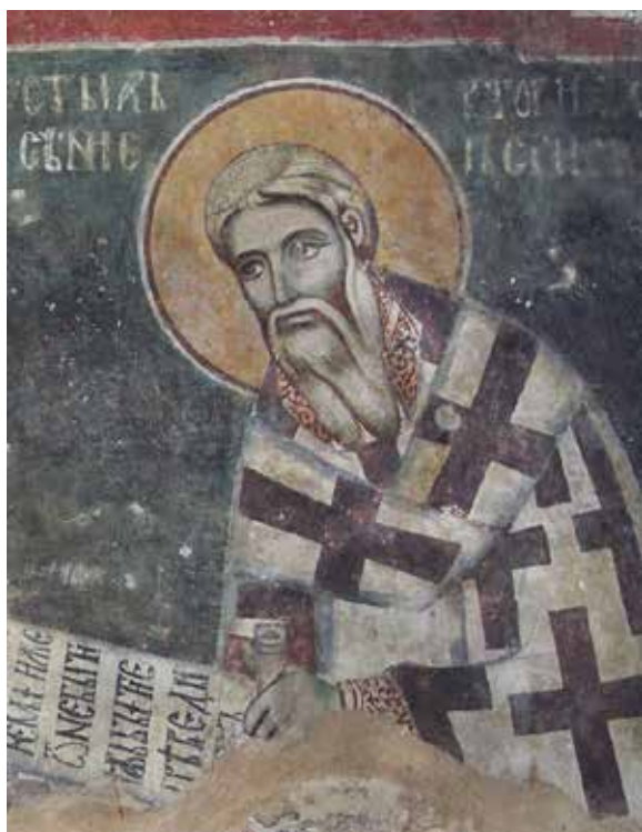
Сл. 17. Свети Арсеније, паклис Светог Ђорђа у Сопоћанима