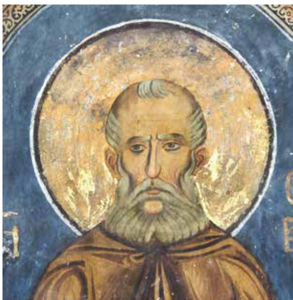
Сл. 2. Свети Сава Освећени, Богородичина црква у Студеници