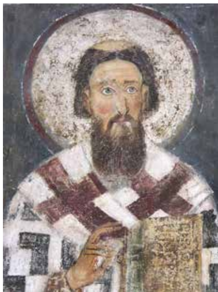
Сл. 7. Свети Сава Српски, Милешева Fig. 7. St Sava of Serbia, Mileševa