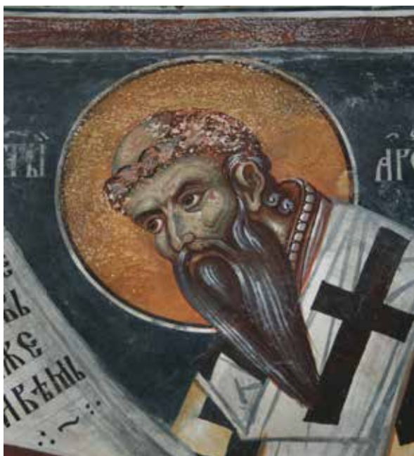
Сл. 15. Свети Арсеније, параклис Светог Стефан у Морачи