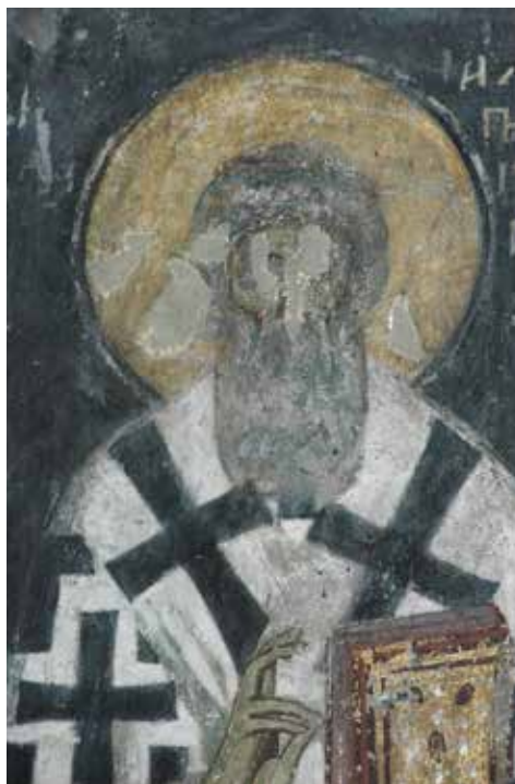
Сл. 14. Свети Сава II, Ариље

Када је 1263. ступио на чело српске цркве, 40 Сава II је имао преко шездесет година, 41 а након смрти 8. фебруара 1271. представљан је потпуно сед или с преовлађујуће белим власима. Оне су морале бити седе и у годинама пред крај његовог живота. Зато је сасвим мало вероватно да је око 1265. године, када су најраније могле настати фреске Сопоћана, Сава II био тек понешто просед. Са друге стране, ваља приметити да је Арсеније сликан каткад и након смрти с тамним власима, уз тек мало седина. Као средовечан, он је представљен у Ариљу (сл. 13), олтару параклиса Светог Димитрија у Дечанима, 42 у Будисавцима 43 или параклису Светог Стефана у Морачи (сл. 15). За нашу расправу изузетно је важан баш пример из Ариља. Реч је о лику уклопљеном у низ српских архиепископа, који хронолошки први следи за представама из олтара Сопоћана.