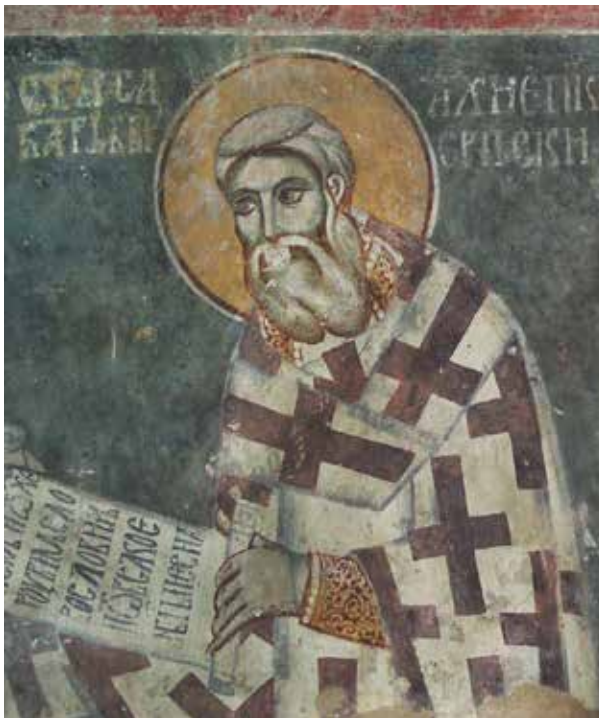
Сл. 16. Свети Сава Српски, параклис Светог Ђорђа у Сопоћанима Fig. 16. St Sava of Serbia, parekklesion of St George in Sopoćani

идентификација антиохијског јерарха је у новијој литератури озбиљно оспорена. Показало се како је вероватније да је на крају сопоћанске службе био приказан неки други антиохијски архијереј – свети Мелетије или свети Јевстатије. 46 С друге стране, колико би позиција испред било ког од тих древних архијереја била необична за Арсенија I и Саву II, у истој мери је необична и за Саву I. Нема примера да је први српски архиепископ ни пре ни касније у представама Литургијске службе добијао место испред старијих, општеправославних светих. Сигурно је зато да тако необична позиција било ког српског архиепископа у представи Литургијске службе није утемељена на хијерархијским, него неким другим разлозима. Они се за сада могу само наслућивати. Уочава се, рецимо, да је фигура поменутог антиохијског патријарха пресечена напола пролазом у ђаконикон. Могуће је да су сликари и њихови налогодавци желели да избегну сликање “попрсне” представе домаћег црквеног поглавара у поворци, поготово ако је реч о актуелном или тек недавно преминулом црквеном поглавару. Проблем је на северној страни био мање изражен. Улаз у проскомидију постављен је тако да је дозволио спуштање до тла бар дела фигуре српског архиепископа насликаног изнад њега. 47