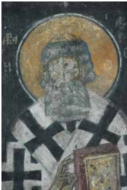
Сл. 12. Свети Сава Српски, Ариље Fig. 12. St Sava of Serbia, Arilje