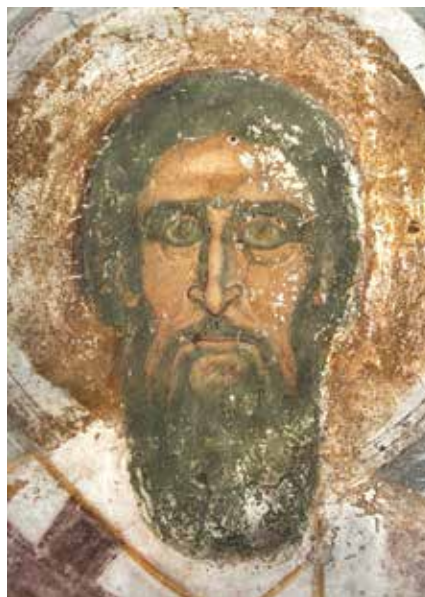
Сл. 8. Свети Сава Српски, параклис Светог Симеона у Студеници Fig. 8. St Sava of Serbia, parekklesion of St Simeon in Studenica

одређених архијереја, јасно је да је архиепископ Данило у архијереју насликаном на крају северног дела Литургијске службе у Светим апостолима видео светог Саву Српског. Од кључног утицаја на то морале су бити снажне пећке локалне традиције. Занимљиво је приметити да је и касније у Ресави свети Сава Српски прикључен Литургијској служби као последњи архијереј у низу на северној страни. 20 И у пећкој Одигитрији и у Ресави свети Сава је, за разлику од представе из Светих апостола насликан као средовечан човек тамних власи. Међутим, обе млађе представе настају у време када је сликање првог српског архиепископа у том виду било устаљено правило, о чему ће тек бити речи.