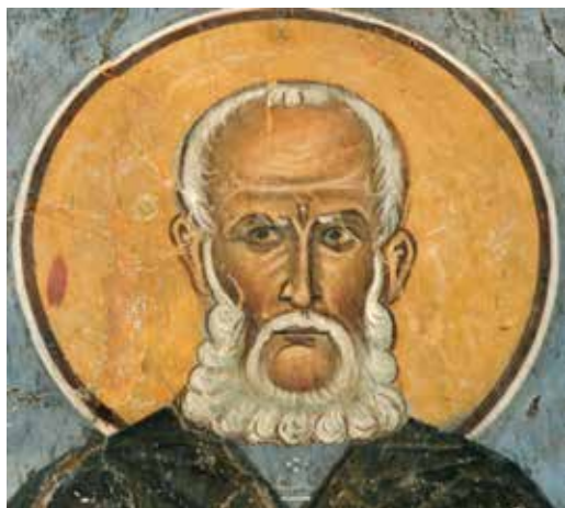
Сл. 3 Свети Сава Освећени, Асину, Панагија Форбиотиса, Кипар