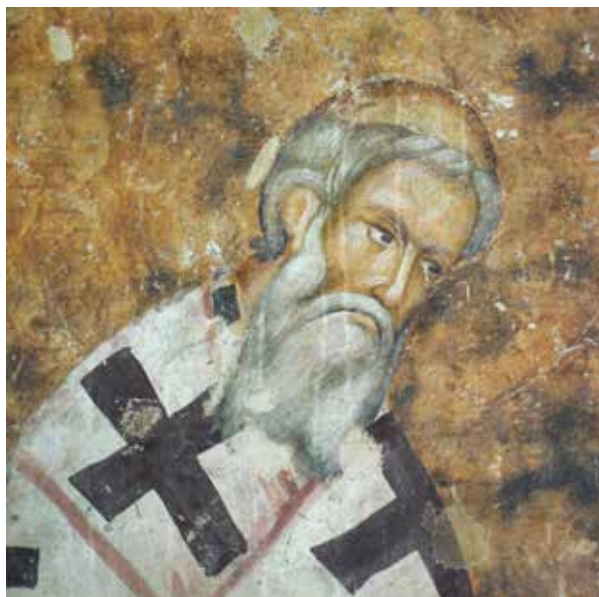
Fig. 9. St Sava of Serbia, altar area of Sopoćani

по средини на обе пећке предтаве, који је у главној апсиди чак изразито метласт. 28 Метласта брада не среће се на портретима српског светог из времена пре 1236. године. Заравњену, метласту браду, издељену у више праменова, карактеристичну такође за представе Освећеног пустињака, 29 само нешто дужу, свети Сава Српски има и у Ариљу (сл. 12). Сви ти “светосавски” облици браде – потпуно равно подсечена, раздељена у два заобљена прамена, метласта и издељена у више мањих праменова – једном прихваћени, остаће као варијанте стално присутни у иконографији српског светог. Срећаће се на многим његовим познијим представама из XIV-XVII века, на којима су му власи готово редовно тамне (сл. 19-22).