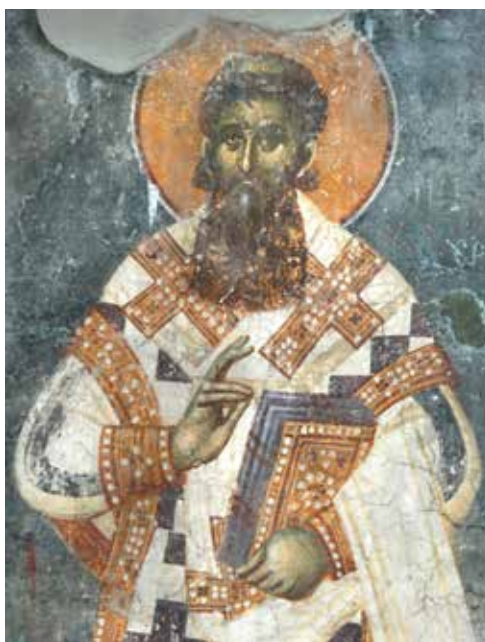
Сл. 21. Свети Сава Српски, црква Светог Никите код Бањана

изгледа везати за последње деценије XIII, односно прве деценије XIV столећа, а карактерише је више нових елемената. Први српски архиепископ сада почиње да се слика као средовечан човек тамних власи, са по тек којом седином. Ако је веровати опису Александра Гилфердинга, светлосмеђе власи јављају се већ на представи светог Саве у Ђурђевим ступовима, насталој око 1280. године. 54 Тамне власи, обично тек с нешто седина, постају непроменљив детаљ иконографије светог Саве, са занемарљиво мало изузетака (сл. 19-22). 55 У време Данила II подмлађени лик светог Саве већ се толико уврежио у српској уметности