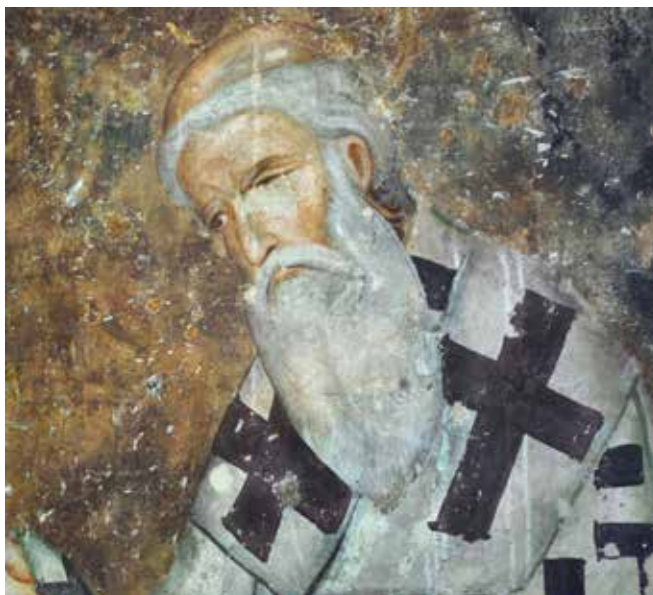
Fig. 11. St Sava II, altar area of Sopoćani

архиепископа на крају северног крила Литургијске службе из олтарског простора Сопоћана (сл. 10). Нису ли онда овде представљени свети Сава I и Арсеније иза њега, а не Арсеније и Сава II.