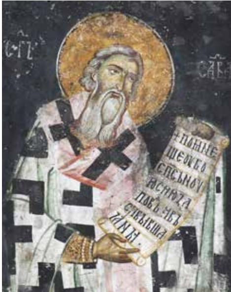
Сл. 1. Свети Сава Српски, олтарски простор Светих апостола у Пећи