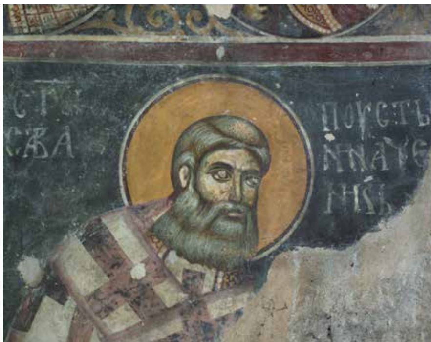
Сл. 18. Свети Сава Пустињоначалник, параклис Светог Ђорђа у Сопоћанима