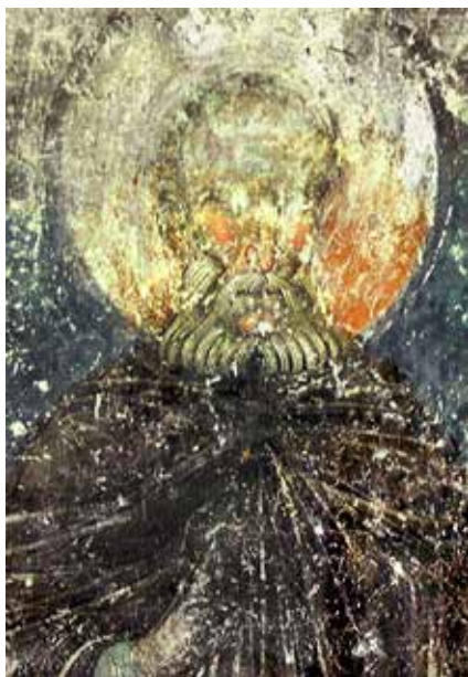
Сл. 5. Свети Сава Освећени, Милешева, припрата