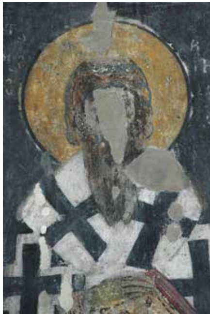
Сл. 13. Свети Арсеније, Ариље Fig. 13. St Arsenije, Arilje

за разлику од епископа, носили су још од времена Саве I, током читавог XIII столећа, полиставрион. Управо у такав орнат одевен је и Сава II у олтару Сопоћана. Надаље, за разлику од краља Уроша, јерарх у сцени Смрти краљице Ане нема нимб, иако су српски архиепископи и у оквиру историјских композиција представљани с тим знаком светости или преосвећености. Брада му је заобљена, односно није раздвојена у два вретенеста прамена као код прелата на крају северног крила Литургијске службе у сопоћанском олтару. Не зна се тачно када је умрла краљица Ана. Но, чак и ако је то било у време када је Сава, као други или трећи син Стефана Првовенчаног, 37 био хумски епископ, 38 тешко је претпоставити да би он остављао своју катедру и долазио на рашки двор да служи опело старој маћехи, и то без присуства подручног архијереја. 39 Наиме, на сцени смрти краљице Ане приказано је како опело служи само један прелат.