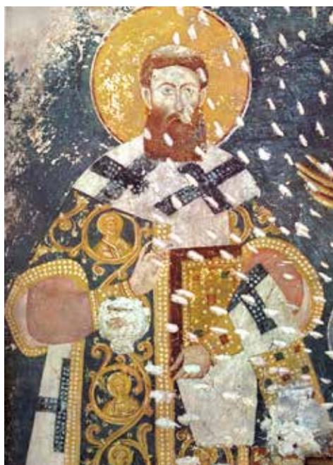
Сл. 19. Свети Сава Српски, Богородица Љевишка у Призрену

Fig. 19. St Sava of Serbia, Virgin Mary of Ljeviša Church