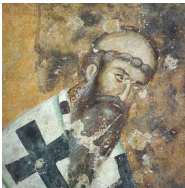
Сл. 10. Свети Арсеније, олтарски простор Сопоћана