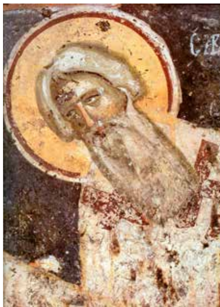
Сл. 6. Свети Сава Српски, проскомидија Светих апостола у Пећи