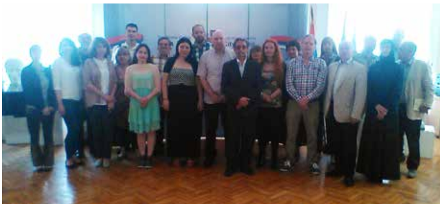
Сл. 6 Учесници симпозијума Ниш и Византија XIV Sl. 6 Participants of the symposium Niš and Byzantium XIV

грађана за које се сматрало да војничком вештином и снагом духа и тела предњаче осталим у тој покрајини.“ Тако је изгледао Ниш, а такве су биле Нишлије. (сл. 5)