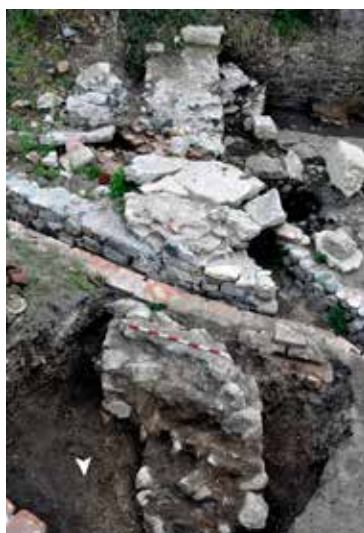
Обр. 5 – Преправка на портата през IV в. (?)