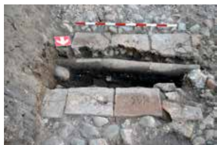
Обр. 14 – Канал с тухли с печати на производител