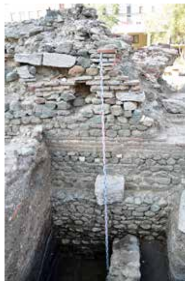
Обр. 3 – Крепостни стени II – IV в.

Към крепостната стена от II в., поправяна и променяна в III/IV в., в по-късно време е долепен допълнителен укрепителен пояс – втора стена, с дебелина 1, 80 м, стъпваща върху външния банкет на по-ранната (Обр. 7). В суперструкция тя има цокъл от големи, преупотребени архитектурни детайли. Във височина и тази стена е изградена от тухли, споени с хоросан с високо съдържание на счукана строителна керамика. В литературата съществуват две мнения за времето на построяване на тази стена – средата/втората половина на V в. 6 и VI в. – времето на Юстиниан Велики 7 . Второто мнение има повече привърженици, но то се основава главно на писмени свидетелства и паралели от други места и по-малко на археологически наблюдения в Сердика. В опит да получим информация за времето на изграждане на тази стена, направихме сондаж в СИ част на обекта, където имаше запазени малка част непроучвани в миналото пластове 8 . Установено беше наличието на широк до 3 м строителен изкоп, запълнен след приключване на строежа с хоросан и фрагментирана строителна керамика. Бяха открити и следи от дървена конструкция – строително скеле, от кръгли и четиригълни дървени стълбове (Обр. 8). В строителния изкоп бяха открити повече от 50 монети, сечени в средата на V в. Монети от VI в., които категорично да могат да бъдат свързани с изкопа,