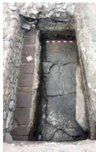
Обр. 12 – Cardo