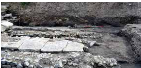
Обр. 6 – Ров пред крепостната стена

един от друг. Изглежда ми приемлива хипотезата, че тази стена принадлежи на същата отбранителна концепция, към която е и удебеляването на първоначалната стена на града и е построена едновременно с нея, т. е. след средата на V в. Но доколкото нямаме сигурни археологически доказателства за това, не можем да отхвърлим и възможността тя да е издигната по времето на император Юстиниан Велики.