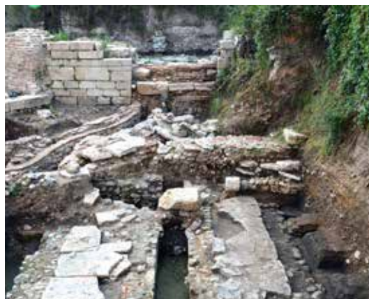
Обр. 11 – Decumanus II-IV в

Освен каналите под улиците, на обекта са открити голямо количество глинени водопроводи и други зидани канали (повече от 100 линейни метра). Те свидетелстват за вида и посоките на водоснабдяването, както и за организацията на оттичане на отпадните води на града. В североизточния край на обекта е проучен канал, който преминава през крепостните стени (Обр. 13). Каналите са изградени както от камъни, така и от тухли. Някои са засводени. В градежа на един от тях са използвани тухли с печат на производителя (Обр. 14).