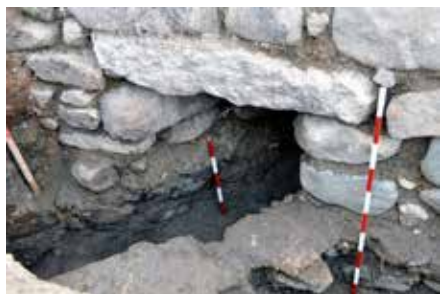
Обр. 13 – Канал през крепостните стени