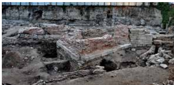
Обр. 9 – Порта и кула от V-VI в.

той не бил документиран и никога не е бил публикуван. Настилка от големи каменни плочи от същия период е регистрирана и в северната половина на обекта, пред т. нар. Базилика, но тя е в силно нарушен вид и не може да се установи първоначалната ширина на улицата, доколкото интерпретацията на тази настилка като улична може да бъде сигурна.