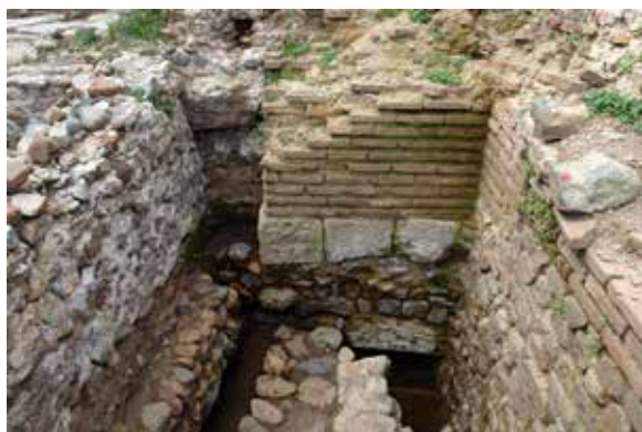
Обр. 4 - Северна страница на пропугнакулума, поглед от Север (кв. E2/F2)