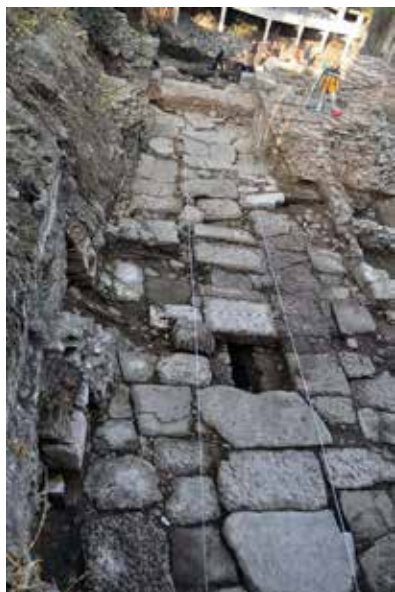
Обр. 10 – Decumanus Maximus VI в.

на терена. Това може да се е случило по време на прокопаването на рова пред крепостната стена, паралелно с промените в обема и формата на портата през този период.