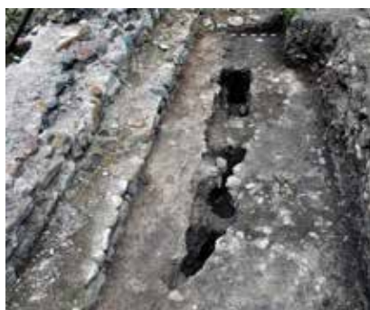
Обр. 8 – Следи од строително скеле