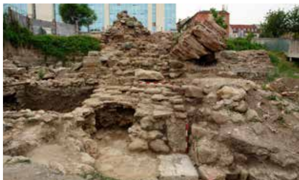
Обр. 7 – Ранната и късната крепостна стена