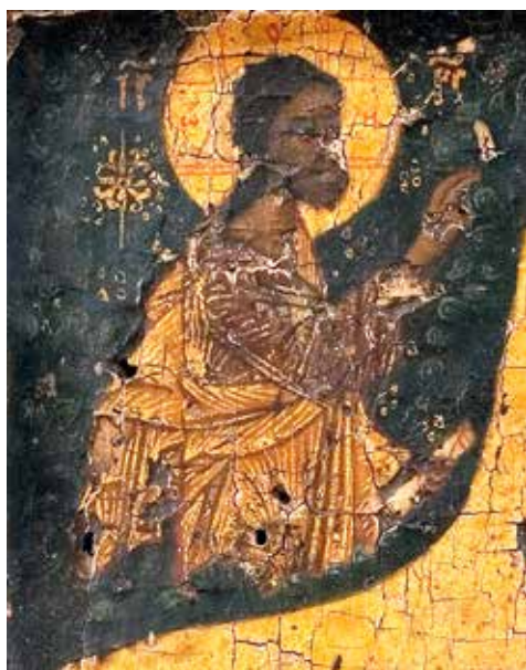
Сл. 2 детаљ сл. 1 Fig. 2 a detail of fig. 1