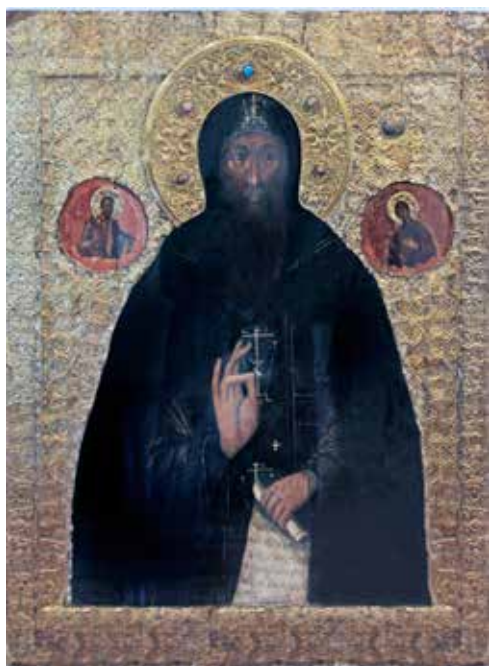
Сл. 6 Владимирско-суздаљски музеј, икона светог Јевтимија Суздаљског