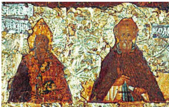
Сл. 4 Москва, Третјаковска галерија, икона Богородице Одигитрије са светитељима, детаљ