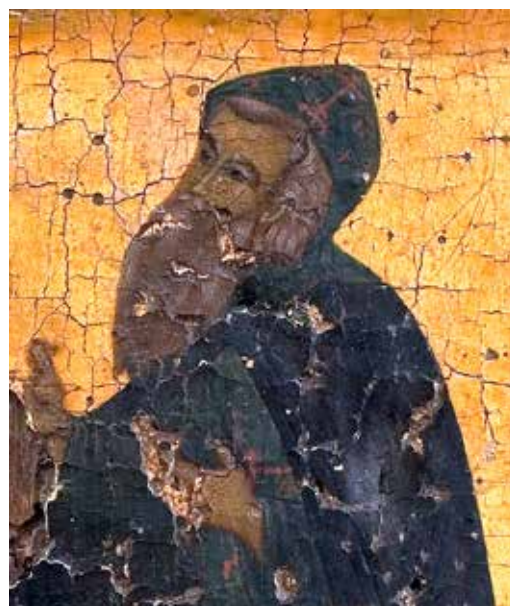
Сл. 3 детаљ сл. 1 Fig. 3 a detail of fig. 1

континуираним доласцима монаха српског атонског манастира на руски двор и у следећих стотинак година. Хиландарци су на позитиван пријем наилазили све до краја XVII века, у време царева из династије Романов. Ипак, односи Хиландара са царевима Трећег Рима никада нису били тако интензивни и плодотворни као за владавине Ивана Грозног. 8