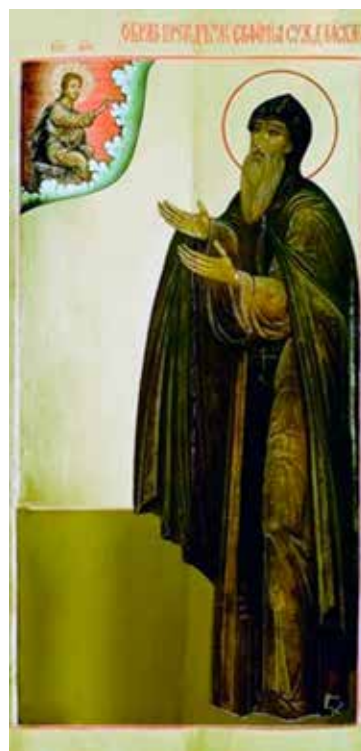
Сл. 7 Образцово, Црква Рођења Богородице, икона светог Јевтимија Суздаљског

На који год начин да је приспела у Хиландар, икона Јевтимија Суздаљског представља важно сведочанство о постојању његових „пјадњица“ у раној фази сверуског штовања светитеља, раније познатих само по описима из писаних извора. Стицајем историјских околности