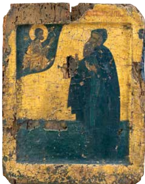
Сл. 1 манастир Хиландар, икона светог Јевтимија Суздаљског