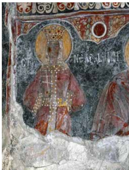
Fig. 9a Saint Kyriake, the zone of standing figures, east side of southern wall of the church of Assumption of the Virgin in Reževići Monastery

слоја у Режевићима. То показују фрагменти бордура са старијег и новијег слоја, као и непоклапање стојеће представе Богородице и свете која припада ранијем живопису. Учесници Благовести су нешто више постављени, при чему је остало простора за сокл.