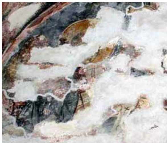
Fig. 6 figure of angel from the elder layer of painting, the highest zone of eastern wall of the church of Assumption of the Virgin in Reževići Monastery

Сл. 7 фигура анђела из Благовести са новијег слоја и остаци стојеће фигуре са старијег слоја живописа, зона стојећих фигура, северна страна источног зида цркве Успења Богородице у манастиру Режевићима