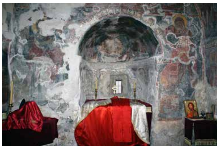
Сл. 3 поглед на источни зид цркве Успења Богородице у манастиру Режевићима