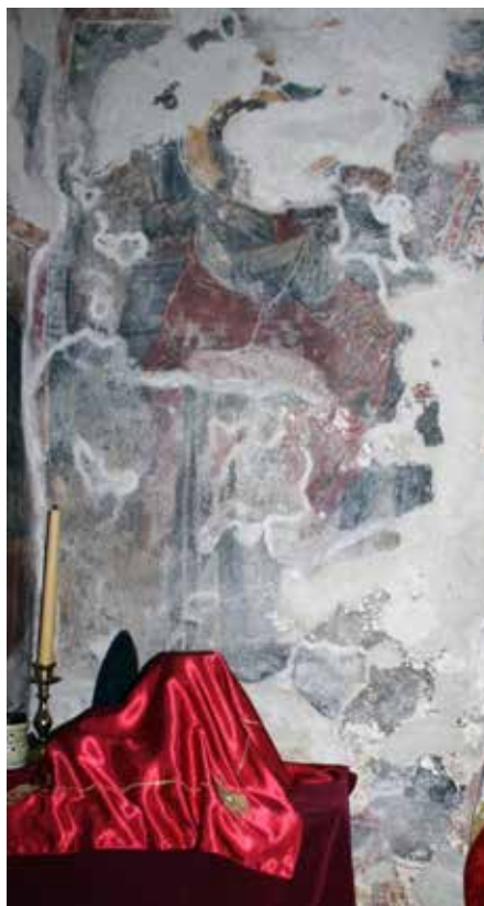
Fig. 7 figure of angel from Annunciation from the more recent layer and the remainings of a standing figure from the elder layer of frescoes, the zone of standing figures, north side of eastern wall of the church of Assumption of the Virgin in Reževići Monastery

дишњој и јужној површини источног зида. У самом врху, нешто северније од централне осе, незнатно испод бордуре која одваја ову композицију од програма свода читљив је завршетак речи из натписа над приказаном сценом ... ера. Доњом половином композиције доминира полукружна трпеза на којој је шест посуда за храну и пиће, здела и пехара, као и остаци хране (сл. 5). У вишем регистру сцене преостали су фрагменти глава са нимбовима које су припадале личностима распоређеним за трпезом. Најјужније јасно се разазнаје мушка фигура у ружичастом хитону и плавом химатиону која