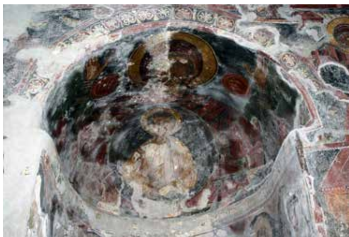
Fig. 2 apse conch of the church of Assumption of the Virgin in Reževići Monastery

настанак новијег сликарства предложили су Татјана Пејовић и Александар Чиликов. Наиме, они сматрају да је осликавање вршено између 1627. и 1630. године, као и да су га извела двојица живописца који су потицали из радионице уваженог мајстора попа Страхиње. 15