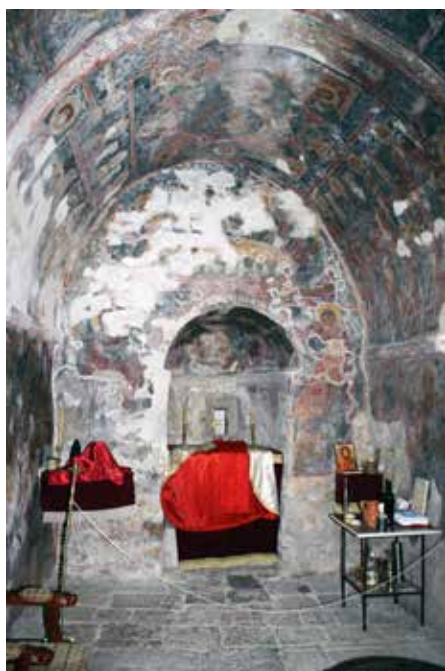
Сл. 1 поглед на источни зид цркве Успења Богородице у манастиру Режевићима