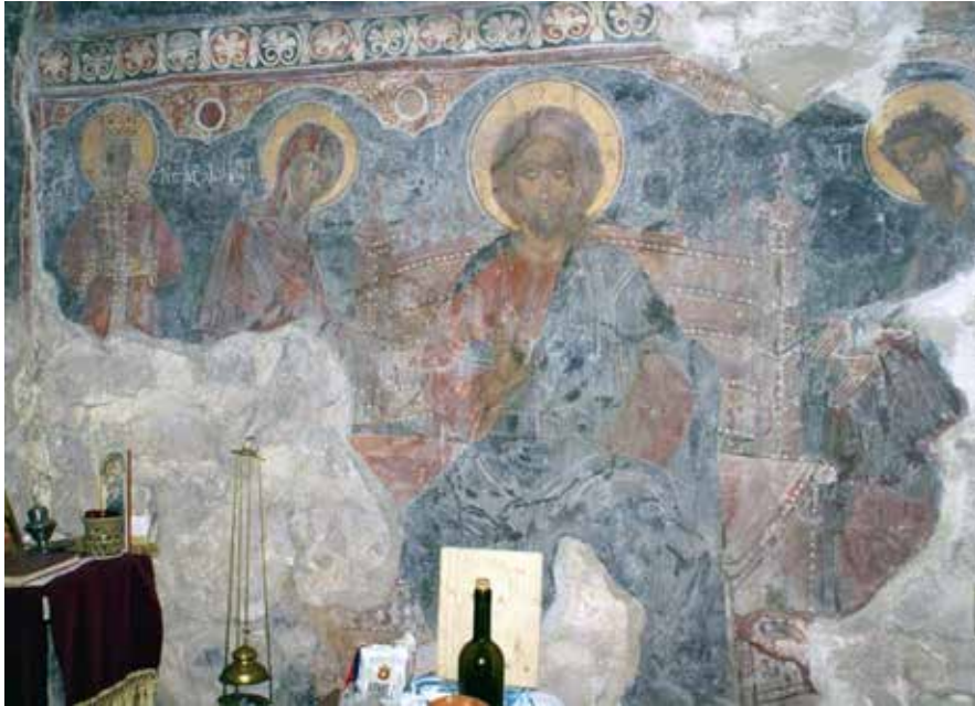
Сл. 9 света Недеља и Деизис, зона стојећих фигура источни део јужног зида цркве Успења Богородице у манастиру Режевићима