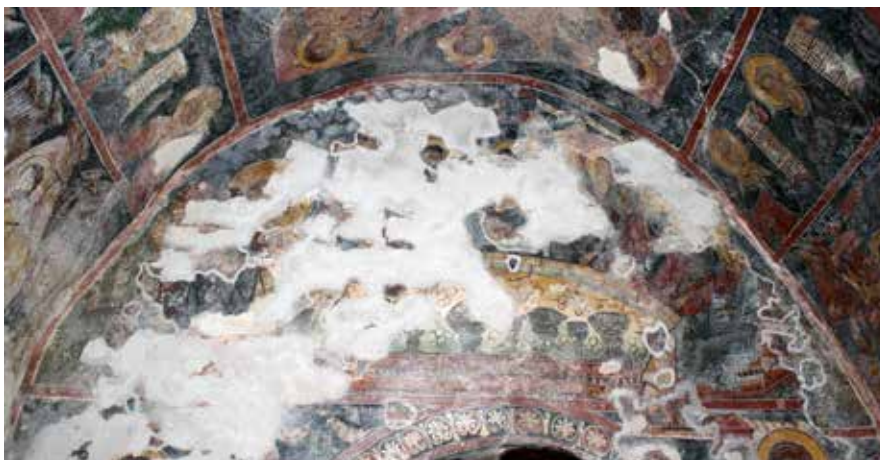
Сл. 5 највиша зона источног зида, црква Успења Богородице у манастиру Режевићима Fig. 5 the highest zone of eastern wall, the church of Assumption of the Virgin in Reževići Monastery

служба архијереја који услед ограниченог простора нису били приказани као стојеће фигуре, већ до нивоа испод појаса. Најближи апсидалном прозору, у центру конхе били су вероватно као што је то било уобичајено насликани најугледнији литургичари који су предводили службу архијереја, свети Јован Златоусти и свети Василије Велики, док је Христ агнец 24 био вероватно приказан око прозора који је накнадно проширен.