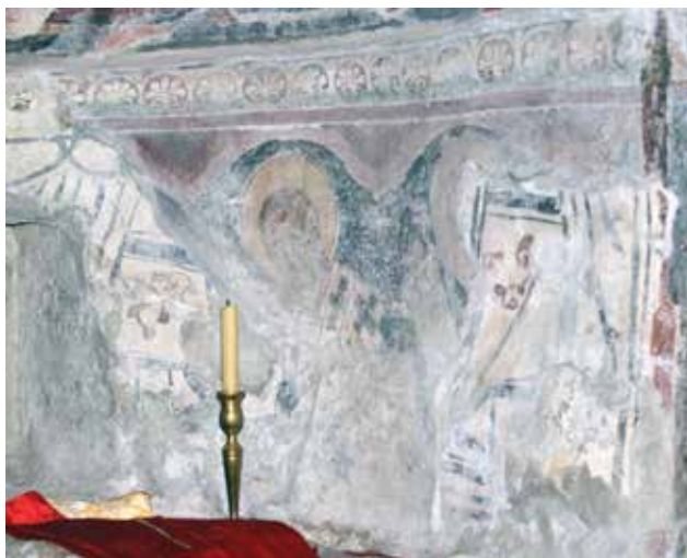
Fig. 4 archpriests depictions from the more recent layer and the remainings of the elder painting from the socle zone in apse conch, the church of Assumption of the Virgin in Reževići Monastery

као српски пример можда може навести апсида Богородичине црквице у Доцу код Студенице. 22 Ипак, се не може поуздано тврдити шта је некада било насликано испод широке орнаменталне траке испод долачке представе Богородице приказане између арханђела и светог Николе јер како сведочи акварел Михаила Валтровића у најнижој зони није било трагова сликарства. 23 Свакако је јасно да није реч о програму уобичајеном за простор апсиде. Разлог што је у Режевићима изостављена служба архијереја треба потражити у чињеници да је апсида прилично ниска, као и да је часна трпеза везана за њен зид (сл. 3), те су сликари простор изнад часне трпезе третирали као најнижу зону сокла.