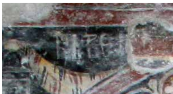
Сл. 7а фрагмент натписа над сценом Благовести, источни зид цркве Успења Богородице у манастиру Режевићима