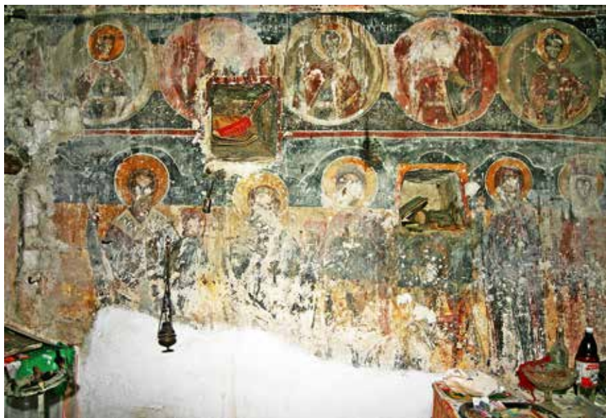
Сл. 12. Јужен ѕид во наосот, црква Св. Ѓорѓи, с. Црквино, Велешко