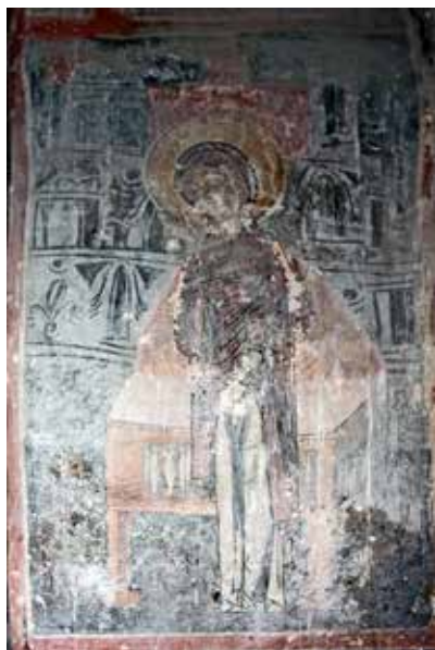
Сл. 2. Богородица од Благовештението, црква Св. Ѓорѓи, с. Црквино, Велешко