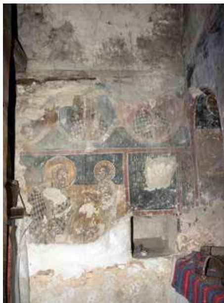
Сл. 11. Северен ѕид во олтарот, црква Св. Ѓорѓи, с. Црквино, Велешко