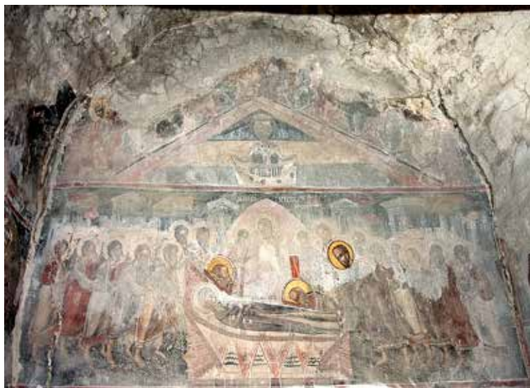
Сл. 7. Успение на Богородица и Симнување на Св. Дух, западен ѕид во наосот, црква Св. Ѓорѓи, с. Црквино, Велешко