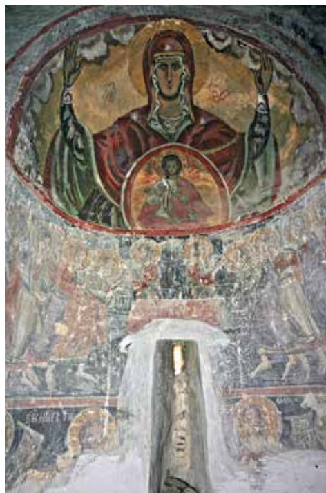
Сл. 8. Богородица со Христос, Причестувањето на апостолите и Службата на архијереите, олтарна апсида, црква Св. Ѓорѓи, с. Црквино, Велешко