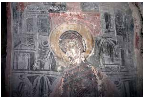
Сл. 3. Богородица од Благовештението, црква Св. Ѓорѓи, с. Црквино, Велешко, детал