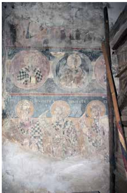
Сл. 10. Јужен ѕид во олтарот, црква Св. Ѓорѓи, с. Црквино, Велешко

Во олтарната апсидата, во I зона, е композицијата Службата на архијереите во која се делумно сочувани само претставите на црковните отци со отворени свитоци со текст во рацете, додека Христос-жртва кој вообичаено се слика во средината на апсидата поради оштетувањата на овој дел од живописот е уништен. (сл. 8) Од северната страна приоѓаат светите архијереите св. Василиј Велики спн василие , Јован Златоуст спн (iw)з... , додека од јужната страна Атанасиј спн аданасие и Григориј Богослов спн глиго(...) .