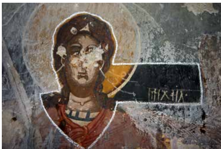
Сл. 13. Архангел Михаил, западен ѕид во наосот црква Св. Ѓорѓи, с. Црквино, Велешко