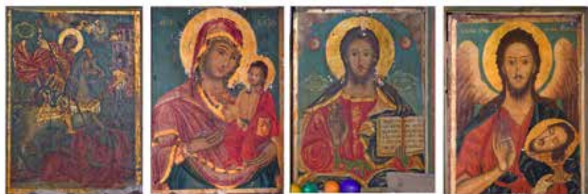
Сл. 15. Престолни икони од иконостасот, црква Св. Ѓорѓи, с. Црквино, Велешко, Крсте од Велес, 1819 г.