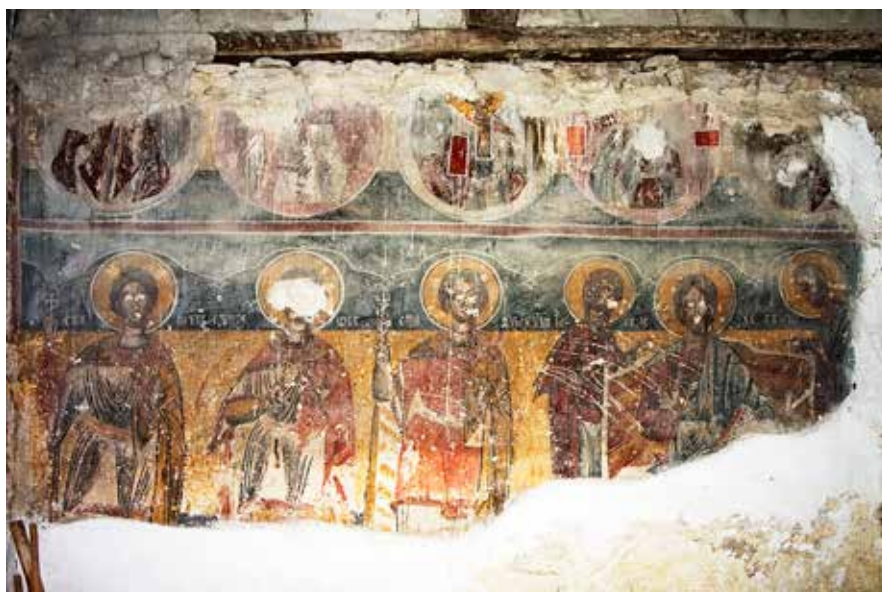
Сл. 14. Северен ѕид во наосот, црква Св. Ѓорѓи, с. Црквино, Велешко