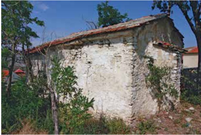
Сл. 1. Поглед кон југоисточна фасада, црква Св. Ѓорѓи, с. Црквино, Велешко