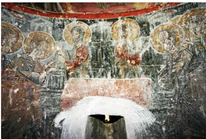
Сл. 9. Причестувањето на апостолите, олтарна апсида, црква Св. Ѓорѓи, с. Црквино, Велешко, детал