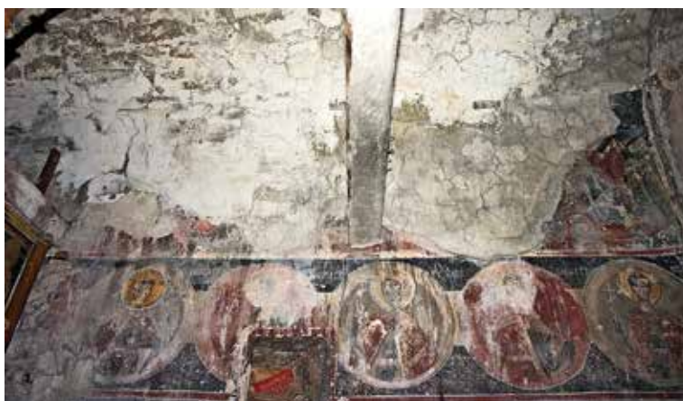
Сл. 5. Поглед кон јужниот ѕид во наосот, црква Св. Ѓорѓи, с. Црквино, Велешко