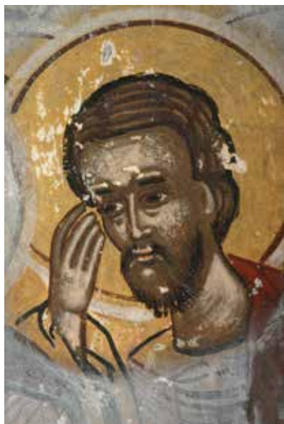
Сл. 7.1. Успение на Богородица, западен ѕид во наосот, црква Св. Ѓорѓи, с. Црквино, Велешко, детал