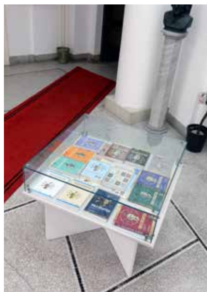
Сл. 7 Издања симпозијума „Ниш и Византија“