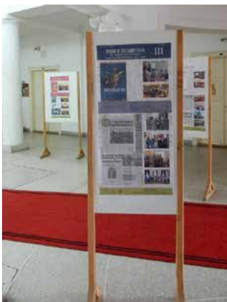
Сл. 6 Изложба „Ниш и Византија – после 15. година“