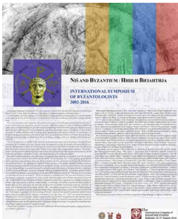
Сл. 1 Презентациони постер симпозијума „Ниш и Византија“ на конгресу византолога Fig. 1 Presentation poster “Niš and Byzantium“

За петнаест година постојања симпозијума „Ниш и Византија“ своје реферате излагало је око 600 истакнутих истраживача и научника из преко 20 земаља, од којих 10 академика. После сваког скупа штампа се зборник радова и као саставни део зборника његова електронска верзија (CD), која се поставља на сајт симпозијума ( http://www.nisandbyzantium.org.rs ) у оквиру званичне презентације града Ниша. Зборник радова се промовише следеће године на отварању симпозијума. У континуитету је штампано 14 бројева док је бр. 15 у припреми. У просеку сваки број има између 500 и 600 страна. Уз годишњицу Миланског едикта, 2013. године штампано је посебно издање „Ниш и хришћанско наслеђе“. Укупно око 9000 страница нових знања и открића из историје, историје уметности, археологије,