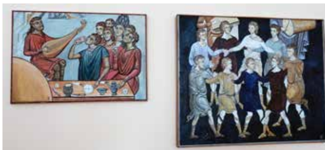
Сл. 11 изложба „Путокази“, аутор Драгомир Тодоровић Fig. 11 Exhibition „The Signposts“, by Dragomir Todorovic

јубилеју присуствовали су и гости из Грче испред којих се присутника обратио протопрезвитер-ставрофор проф. Ермолај Масарас из Патре, указавши на значај и важност очувања оваквог научног скупа који сваке године окупуља добре познаваоце Византије.