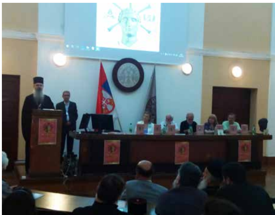
Сл. 2 Свечано отварање симпозијума, Његово Преосвештенство Епископ Господин Теодосије