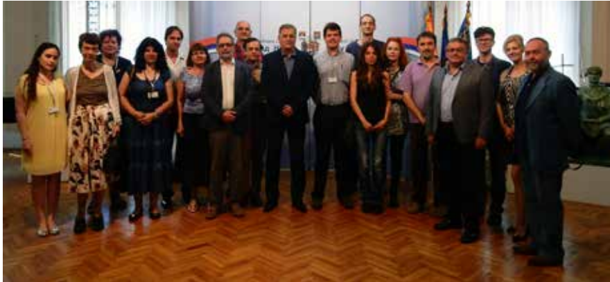
Сл. 12 Учесници симпозијума Fig. 12 Participants of the symposium

пклони прикладна слика чији је аутор Драгомир Тодоровић и књига „Константинов град старохришћански Ниш“ аутора Мише Ракоција.