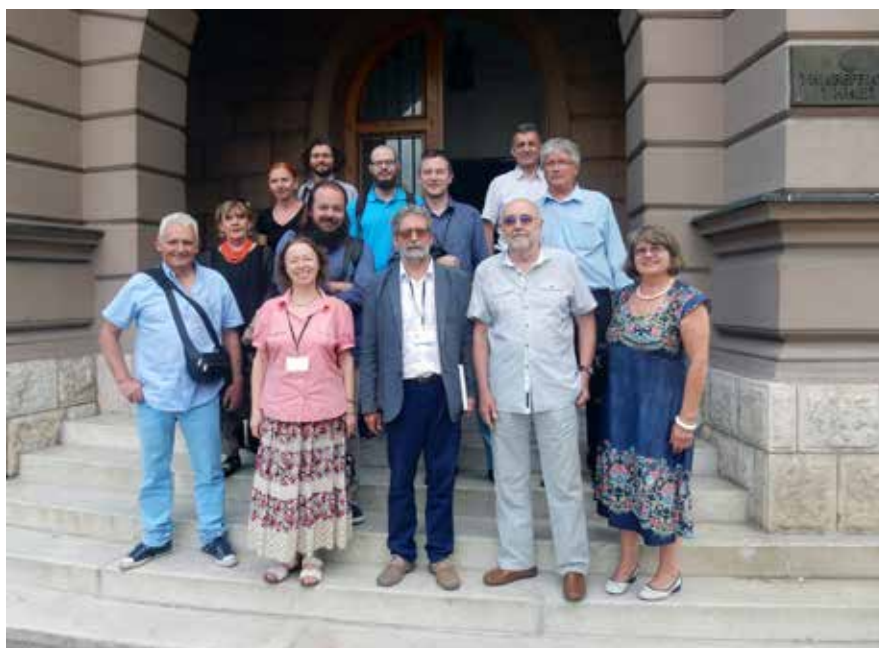
Сл. 7 учесници скупа Ниш и Византија XVII Fig. 7 Participants of the Niš and Byzantium XVII

Симпозијум „Ниш и Византија“ неодојив је од имена града Ниша, чију славу шири на све стране света. Неизмерив је значај Нишког скупа за науку. Нема озбиљног истраживача широм света који није цитирао радове из зборника радова „Ниш и Византија“.