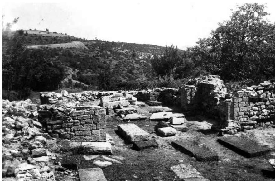
Сл. 3 Сашка црква- олтарски део после ископавања 1955. г.