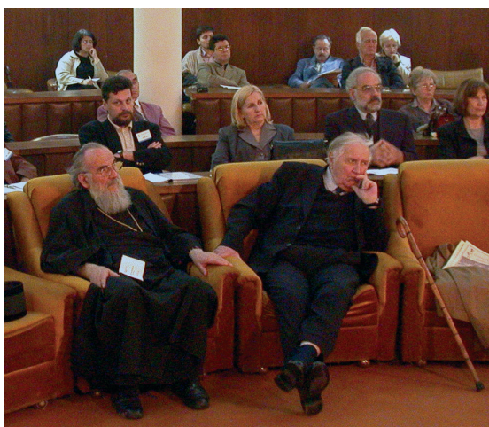
Сл. 1 Отварање симпозијума Ниш и Византија I, 2002. година, Епископ нишки потоњи Патријарх српски Иринеј, академик Дејан Медаковић, председник САНУ Fig. 1 Opening of the Niš and Byzantium Symposium I , 2002, Bishop of Niš later Serbian Patriarch Irinej, Academician Dejan Medaković, the President of Serbian Academy of Sciences and Arts

као место изучавања византијске цивилизације, културе, уметности и духовности. Међународни симпозијум „Ниш и Византија“ је високо рангиран у научном свету, али и посебно уважен међу грађанима Ниша, тако да је постао препознатљив знак по коме се Ниш зна и ван наше земље.