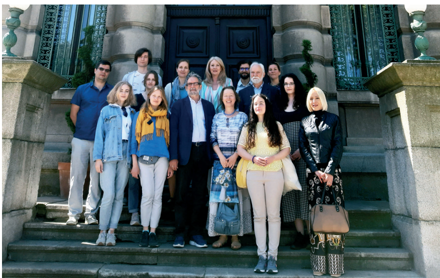
Сл. 6 Учесници симпозијума Fig. 6 The Participants of the Symposium

темеља саграђених цркава, како у Нишу тако и у целој Епархији нишкој. У време епископа нишког Иринеја највише књига и научних радова је написано о нашим светињама и покренут симпозијум „Ниш и Византија“, што је допринело да се разјасне многе непознанице из богате хришћанске прошлости славног града Ниша.