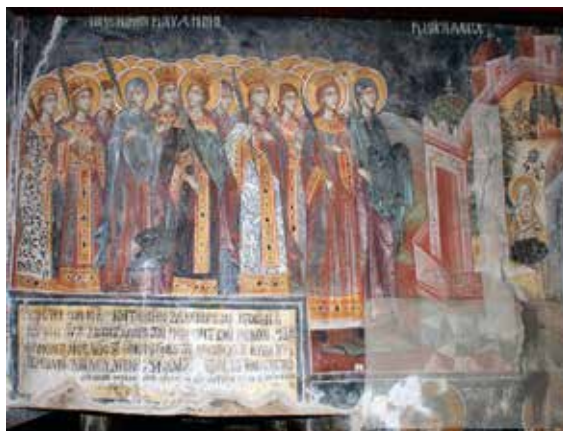
Εικ. 8 Ύμνος Παναγίας «επι σοί χαίρει»

της Ηπείρου, μέλη του συνεργείου της οικογένειας Αναστάσιου Καλούδη 35 Κατόπιν αυτών, επιβάλλεται να σταθούμε στην προσωπικότητα του Ζωσιμά. Καταγόμενος απο την Σιάτιστα έγινε μητροπολίτης Σισανίου περί το 1686 και παρέμεινε στο θρόνο της μέχρι την αποδημία του το 1746. Ενδιάμεσα κλήθηκε δύο φορές ν' αναλάβει τον αρχιεπισκοπικό θρόνο της Αχρίδας από το 1695 έως το 1699 και από το 1707 έως το 1709. Το χρονικό διάστημα της πνευματικής πορείας και ποιμαντορίας του συμπίπτει από την μια πλευρά με ορισμένες θετικές αλλαγές στα εκκλησιαστικά πράγματα της αρχιεπισκοπής, καθοριστικές στη συμβολή