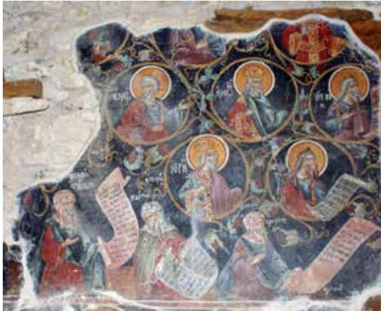
Εικ. 7 Ρίζα Ιεσσαί μετά φιλοσόφων

Сл. 7 Шижатишга, Лоза Јесејева са филозофима Евплос