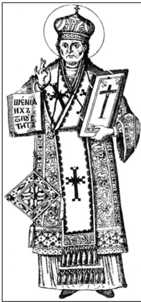
Σχ. 4 Θεοφύλακτος Αχρίδας - Ζεφάροβιτς