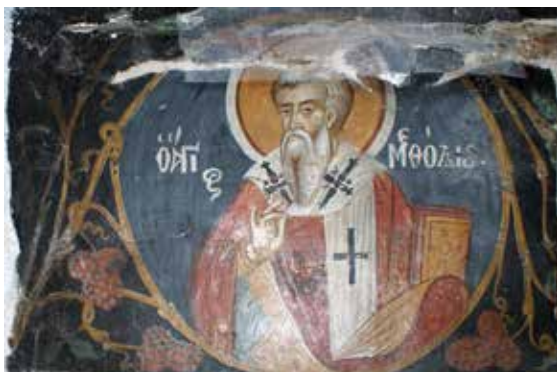
Εικ. 5 Άγιος Μεθόδιος Сл. 5 Шијатишта, Св.Методије,

από διάφορες φάσεις. Έτσι μπορούμε να πούμε, τηρουμένων των αναλογιών, ότι για πρώτη φορά εμφανίζεται το πορτρέτο του με κατατοπιστικές επιγραφές το 1525/26 στο παρεκκλήσι του Αγίου Ιωάννου του Προδρόμου στο Άγιο Όρος 26 .