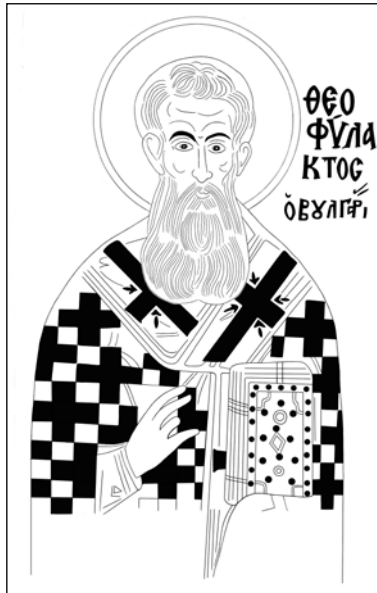
Σχ. 1 Θεοφύλακτος Αχρίδας