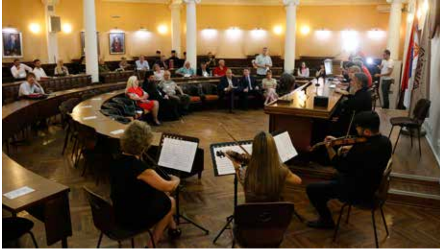
Сл. 1 Отварање симпозијума Ниш и Византија XX , свечана сала Универзитета у Нишу Fig. 1 Opening of the XX Niš and Byzantium Symposium, ceremonial hall of the University of Niš

граду с разлогом врати стари средњовековни епитет „Славни град Ниш“.