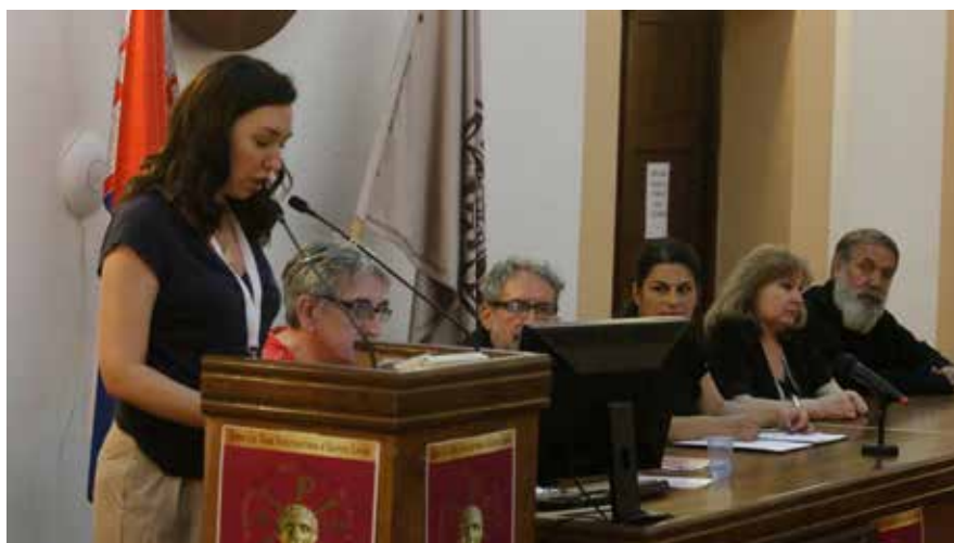
Сл. 4 проф. др Бранка Вранешевић, Промоција зборника радова бр. XX Fig. 4 Prof Branka Vranešević, Promotion of Proceedings No XX