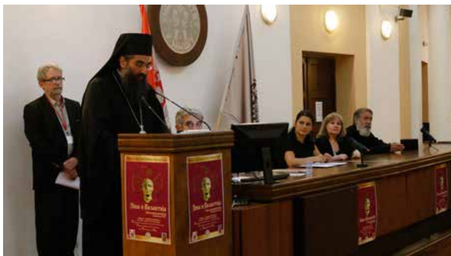
Сл. 2 Отварање симпозијума, благослов Епископа нишког Арсенија Fig. 2 Opening of the Symposium, blessing by Bishop of Niš Arsenije

и уметности прожимају историјско и духовно ткиво Европе, која неретко покушава да то заборави. Заборавили су се велики градови које су саградили РOMEЈИ, грађански живот и манири, угледне градске породице, допринос знаменитих интелектуалаца, прелепа архитектонска остварења, фреске, иконе, скулптуре, дела примењене уметности, мало се зна о филозофији, књижевности, поезији, музици, недовољно се изучава византијска естетика, ... Европа како западна (покушај 2000. године да поставка Европског музеја у Бриселу почиње од 812. године од Карла Великог, без античке Грчке и Византије), тако и источна (недовољним изучавањем, заштитом и презентацијом свог културног и споменичког наслеђа), као да се одриче своје славне прошлости и полако залази у безизлаз. Ослањање на традицију и тражење узора у прошлости, данас