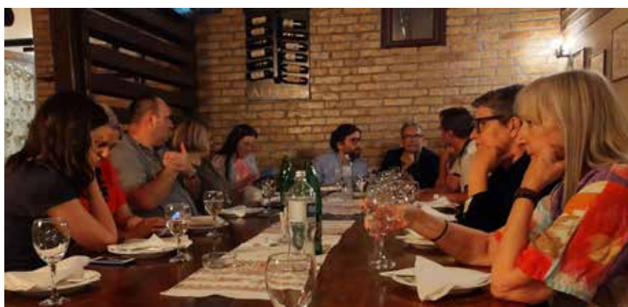
Сл. 5 аргументована дискусија Fig. 5 Argumentative discussion

тековина византијске цивилизације су источни и западни хришћани, како некад тако и данас.