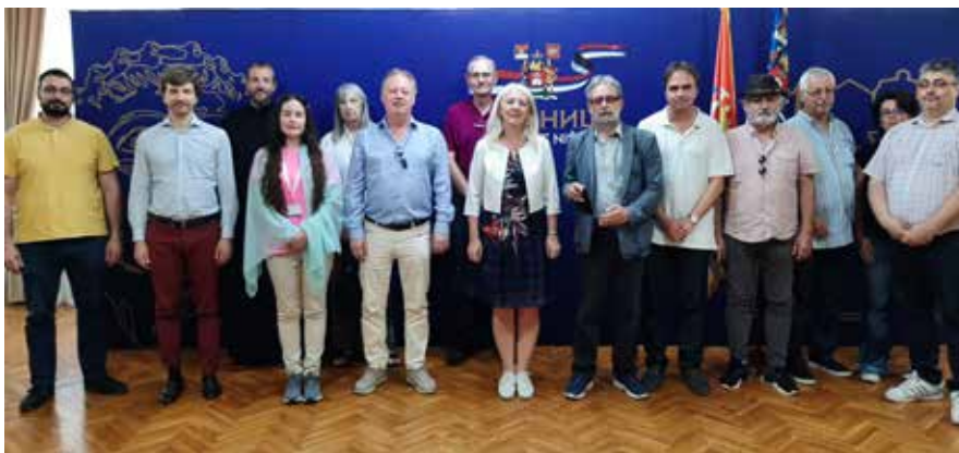
Сл. 8 Учесници симпозијума Fig. 8 Symposium participants