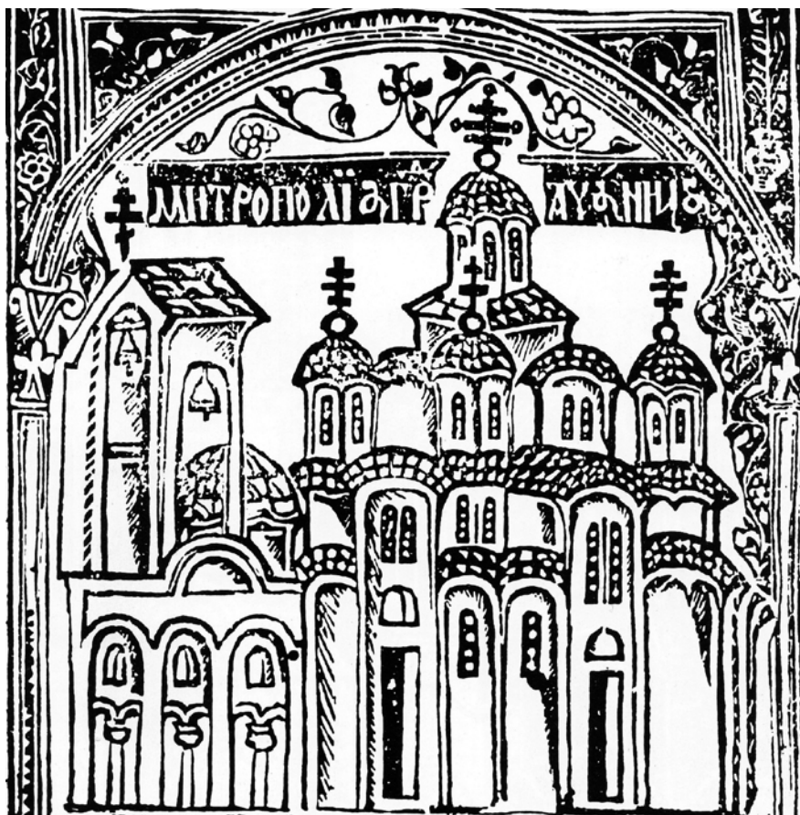
Сл. 4 Представа куле звоника над спољном припратом манастира Грачанице.

Fig. 4 Representation of the bell tower above the outer narthex of the Gračanica monastery.