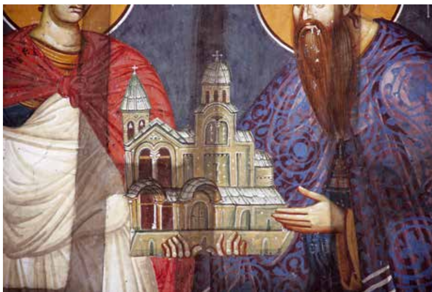
Сл. 3 Ктиторски портрет са представом пећког ексонартекса са кулом звоником, детаљ.