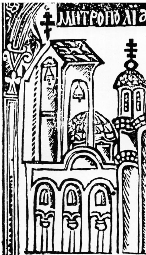
Fig. 5 Bell tower above the outer narthex of Gračanica monastery, detail.

Милутина, његову задужбину Грачаницу, као епископско седиште, додатно нагласио сложеним визуелно-звучним феноменом, чиме би подигао свест о значају овог важног идеолошко-политичког и монашког седишта. 27