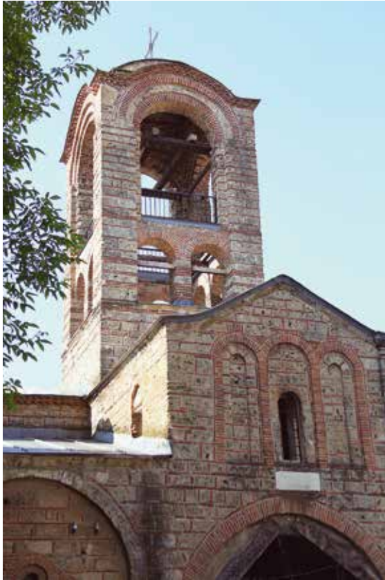
Сл. 2 Звоник над ексонартексом Богородице Љевишке.