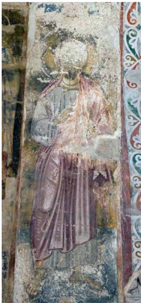
Сл. 5 Богородичина црква у Градцу, потрбушје западног лука, северна страна, Јоаким

Fig. 5 Church of the Virgin in Gradac, soffit of the western arch, northern side, Joachim