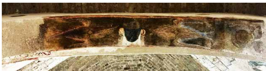
Сл. 3 Богородичина црква у Градцу, потрбушје западног лука, Хетимасија