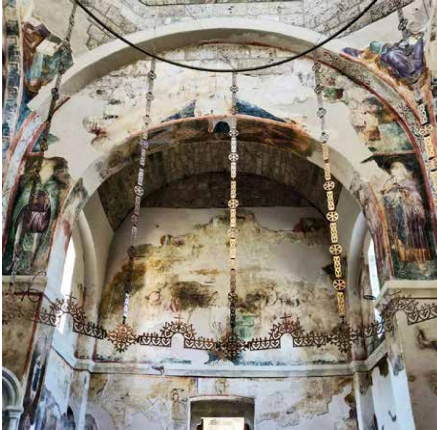
Сл. 2 Богородичина црква у Градцу, поглед на западни лук који дели поткуполни простор од западног травеја наоса