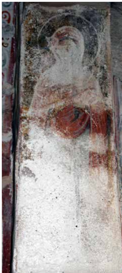
Сл. 6 Богородичина црква у Градцу, потрбушје западног лука, јужна страна, Ана

Fig. 5 Church of the Virgin in Gradac, soffit of the western arch, northern side, Joachim