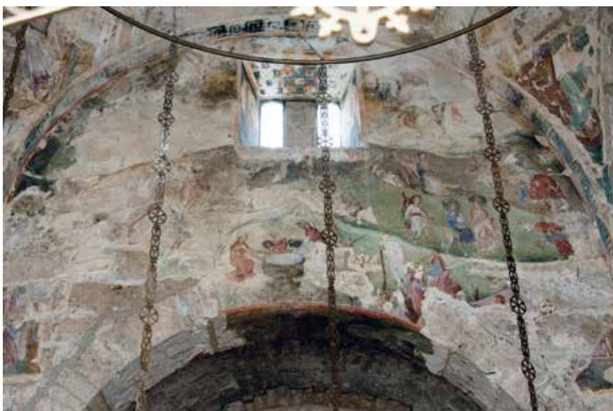
Сл. 10 Богородичина црква у Градцу, јужни зид наоса, Рођење Христово Fig. 10 Church of the Virgin in Gradac, southern wall of the naos, Nativity of Christ

У тамбуру куполе Богородичине цркве у Градцу првобитно је било приказано шеснаест фигура стојећих пророка. 77 Нажалост, осим делимично сачуваних ликова четворице профета за чију идентификацију у овом тренутку нема довољно елемената, остале представе старозаветних личности на том месту у градачком храму сасвим су пропале. Имајући у виду чињеницу да су пророци Гедеон и Данило у градачком храму насликани на потбушју лука изнад пролаза у јужну певницу (Сл. 1 и 7), можемо претпоставити да њихови ликови првобитно нису били приказани и у тамбуру куполе. Ипак, не би требало одбацити могућност, бар када је у питању велики пророк Данило , да се његова представа, осим на поменутом луку, некада налазила и у тамбуру градачког храма. С обзиром на то да су величина и број страница тамбура цркве у Градцу омогућили приказивање великог броја старозаветних личности, 78 може се претпоставити да се у групи од шеснаест фигура профета првобитно налазио и лик пророка Данила . Осим тога, сачувани примери, додуше из познијег српског сликарства, сведоче о обичају сликања поменутог пророка не само у куполи већ и на неком другом месту у истом храму. 79