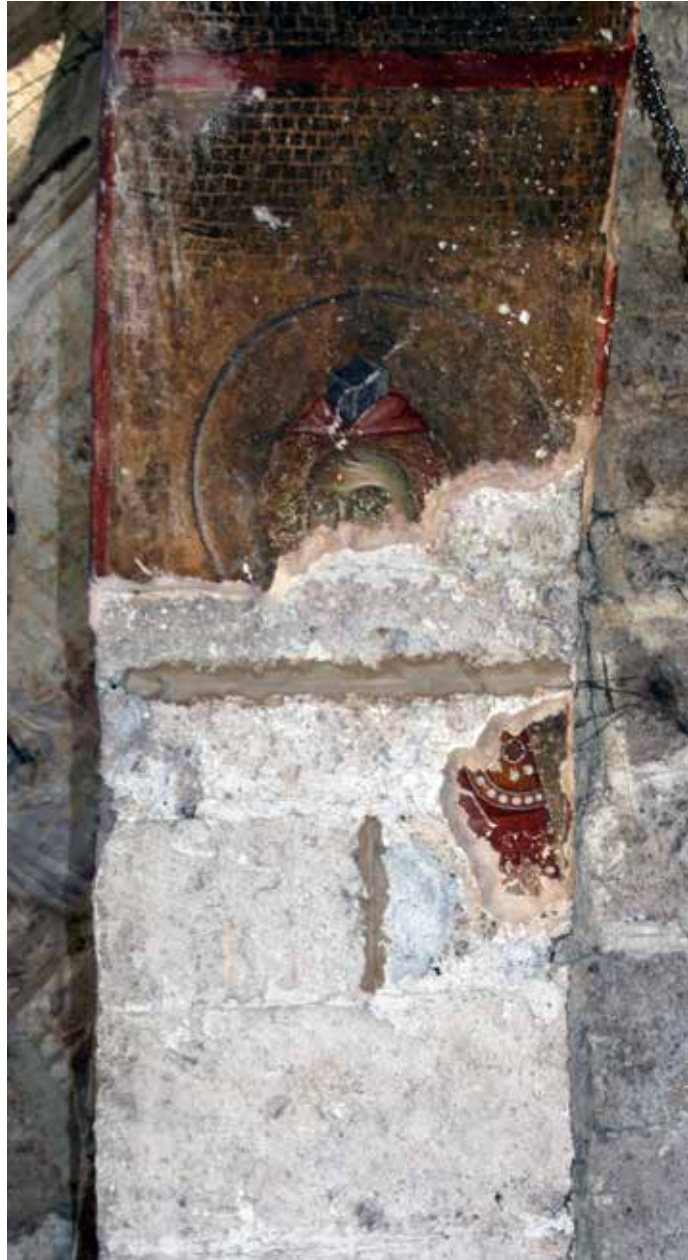
Сл. 9 Богородичина црква у Градцу, потрбушје лука изнад пролаза у јужну певницу, пророк Данило