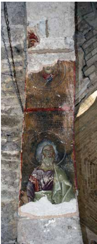
Сл. 7 Богородичина црква у Градцу, потрбушје лука изнад пролаза у јужну певницу