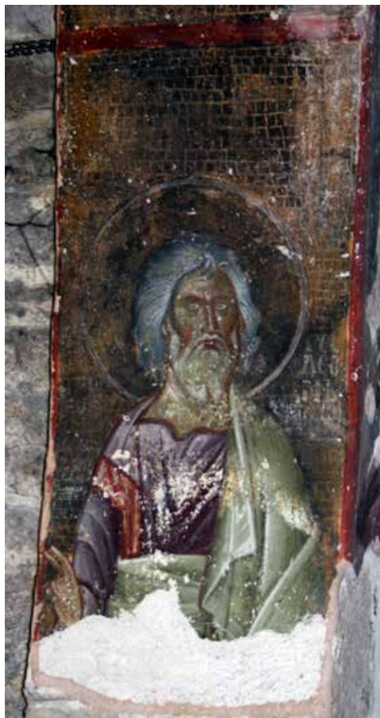
Сл. 8 Богородичина црква у Градцу, потрбушје лука изнад пролаза у јужну певницу, пророк Гедеон