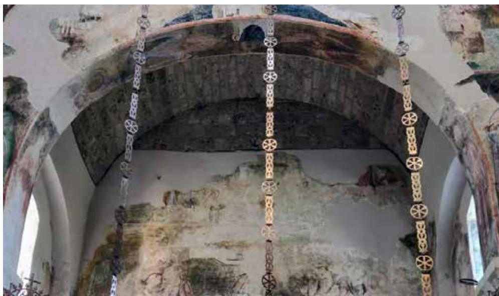
Сл. 4 Богородичина црква у Градцу, поглед на потрбушје западног лука