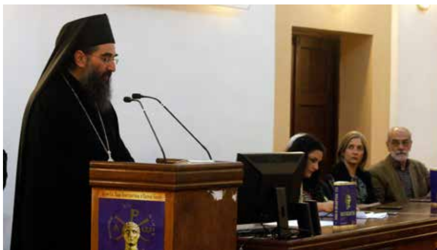
Сл. 2 Отварање симпозијума, благослов Епископа нишког Арсенија