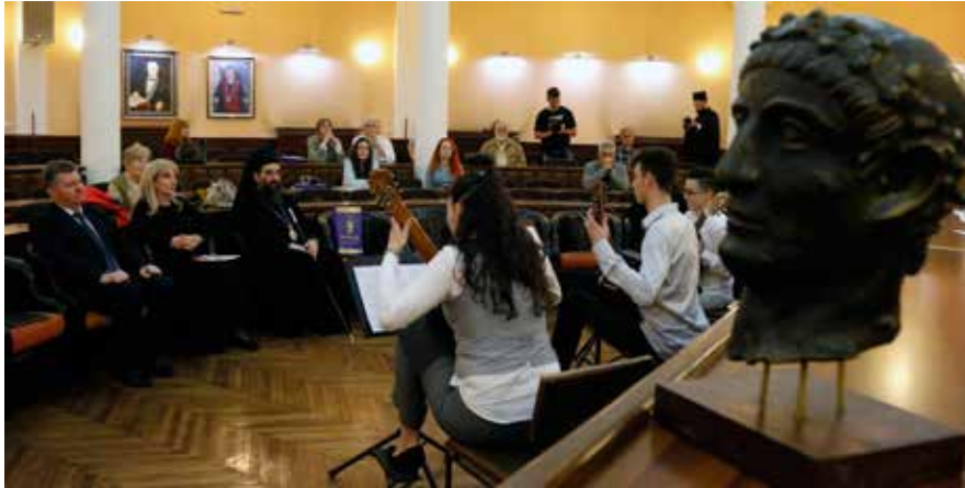
Сл. 1 Отварање симпозијума Ниш и Византија XX , свечана сала Универзитета у Нишу Fig. 1 Opening of the symposium Niš and Byzantium XX, ceremonial hall of the University of Niš

цара Константина заузео је значајно место на научној, културној, уметничкој и духовној карти Европе. Рођењем човека, цара и светца Константина Великог у Нишу, означена је прекретница у историји човечанства. Без цара из Наисуса у Европи не би постојало хришћанство. Константин Велики је рођен у данашњој Србији (Ниш), проглашен за цара у данашњој Енглеској (Јорк), са резиденцијом у данашњој Немачкој (Трир), потписао едикт о толеранцији у данашњој Италији (Милано), основао нову престоницу у данашњој Турској (Истанбул), као што видимо, и својим животом обухватио је целу Европу. Император Константин Велики је нишки бренд који треба много више експлоатисати у славу нашег града и јединства Европе. Томе много доприносе изложена открића учесника симпозијума Ниш и Византија.