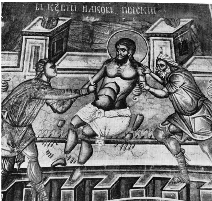
Сл. 2 Мучење Светог Јакова Персијанца, Менолог, Дечани 1347.