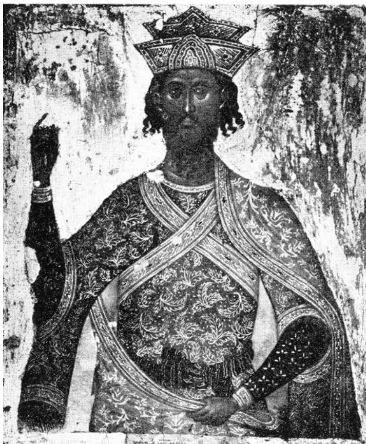
Fig. 4 Icon of Saint James Persian, Emanuil Lambrados, be- ginning of the XVII century

У манастиру Дечани, задужбини краља Стефана Дечанског живопис је рађен око 1347. године. 24 Менолог – живописан циклус годишњег прослављања светитеља садржи јединствену сцену мучења Светог Јакова Персијанца. 25 (сл. 2)