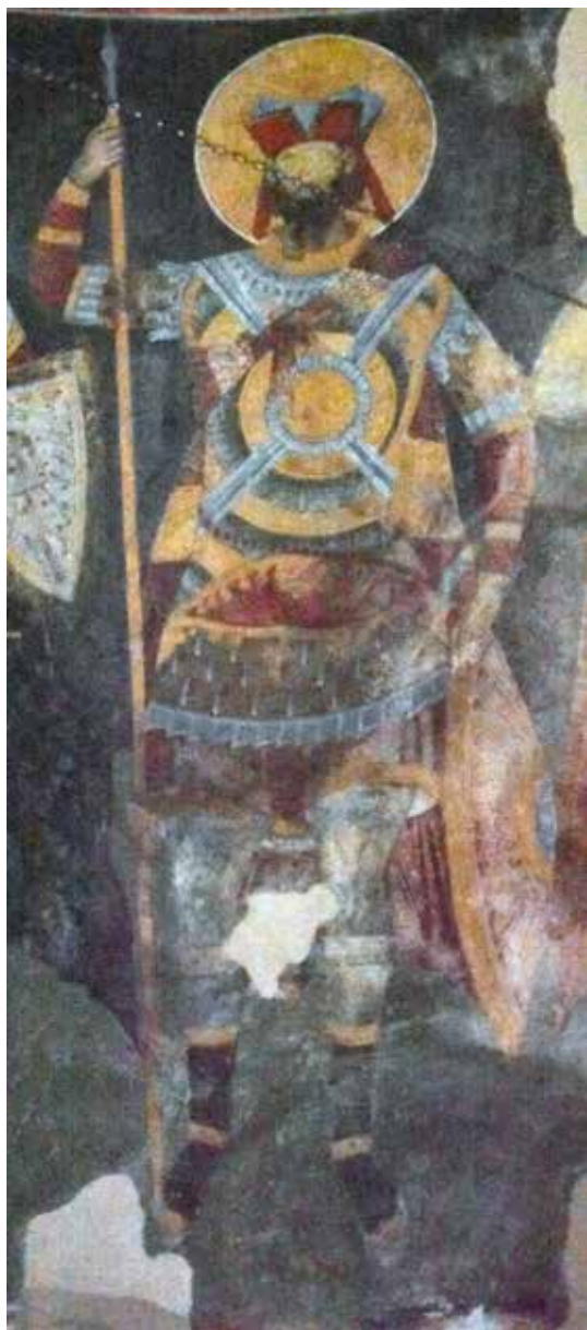
Сл. 3 Фреска Светог Јакова Персијанца, манастир Манасија, почетак XV века