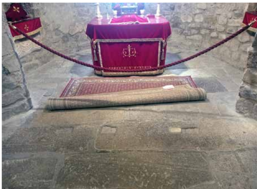
Сл. 1. Удубљења у поду цркве – некадашњи држачи иконостаса Fig. 1. Holes in the floor of the church – former holders of the iconostasis

Богородичине цркве у Студеници, непосредно испред садашњег иконостаса, и у побочним странама источних пиластера Сопоћана, и служила су истој сврси. Поменуте позиције камених плоча показују оригиналан и правилан распоред правцем север – југ, јер су жлебови поређани у низу. Смањен простор на месту централних (царских) двери указује да је северна плоча померена удесно, ка југу, о чему сведочи и троугаоно поље покривено малтером, новијег датума, између ње и северо-источног пиластра. Пошто је јужна плоча прибијена уз југо-источни пиластер, може се закључити да је између две поменуте плоче некада постојала још једна мања, која је склоњена највероватније током рестаураторских радова 1957 – 1960. године, а некадашњи распоред удубљења био је другачији. (Сл. 2)