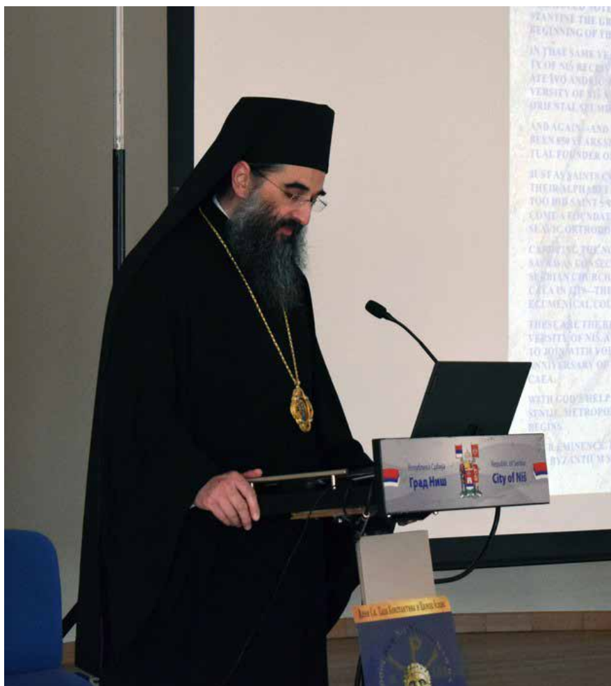
Сл. 1 благослов Митрополита нишког Господина Арсенија Fig. 1 Blessing by the Metropolitan of Niš , His Grace Arsenije

24. године, и у родном граду св. цара Константина окупља истакнуте византологе из целог света.