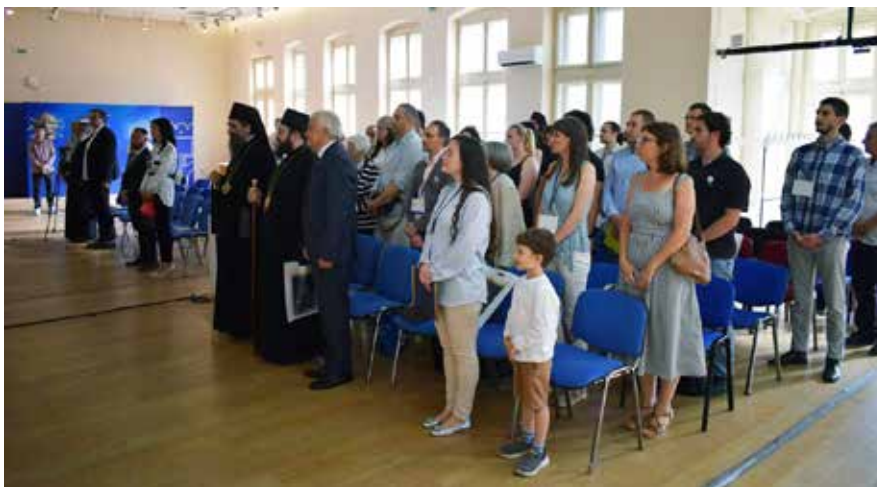
Сл. 2 Свечано отварање симпозијума Ниш и Византија XXIV Fig. 2 Opening ceremony of the symposium Niš and Byzantium XXIV

уметности до политике. Колико се и како хришћански свет променио после Никејског сабора и жустрих расправа које и данас одјекују међу хришћанима.