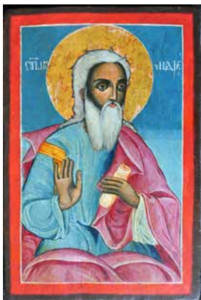
Сл. 27 Св. апостол Андреј након третмана (тек. конс. бр. 13145)