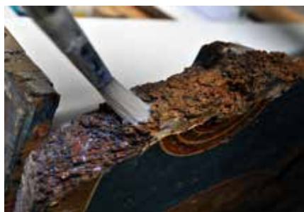
Сл. 12 Процес постепене консолидације дрвета Fig. 12 The process of gradual consolidation of wood