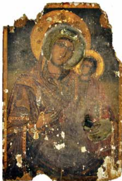
Сл. 2 Затечено стање иконе Богородице са Младенцем