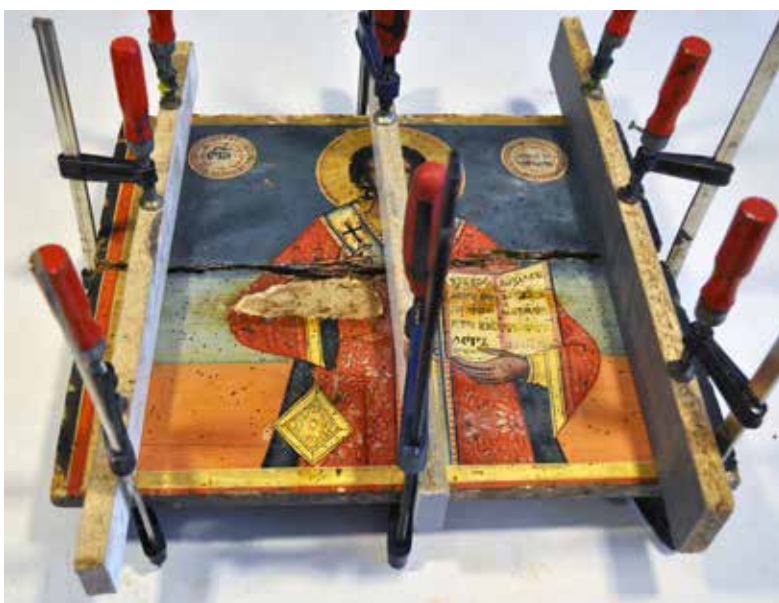
Сл. 15 Пример спајања преполовљене иконе Fig. 15 Example of joining a halved icon