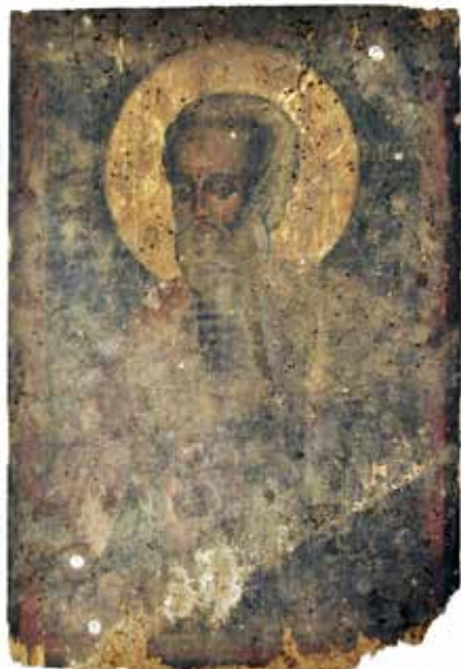
Сл. 7 Затечено стање иконе Св. Апостола Вартоломеја