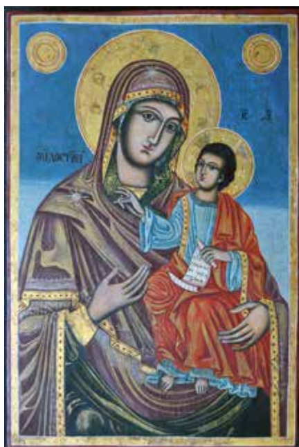
Сл. 19 Богородица са Христом након третмана (тек. конс. бр.: 13137)

Fig. 18 Icon of Christ after treatment (current cons. no.: 13136)