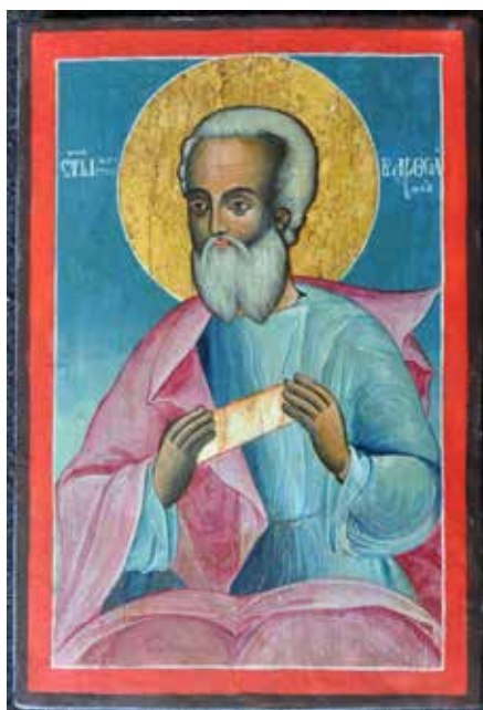
Сл. 24 Св. апостол Вартоломеј након третмана (тек.конс. бр: 13138)