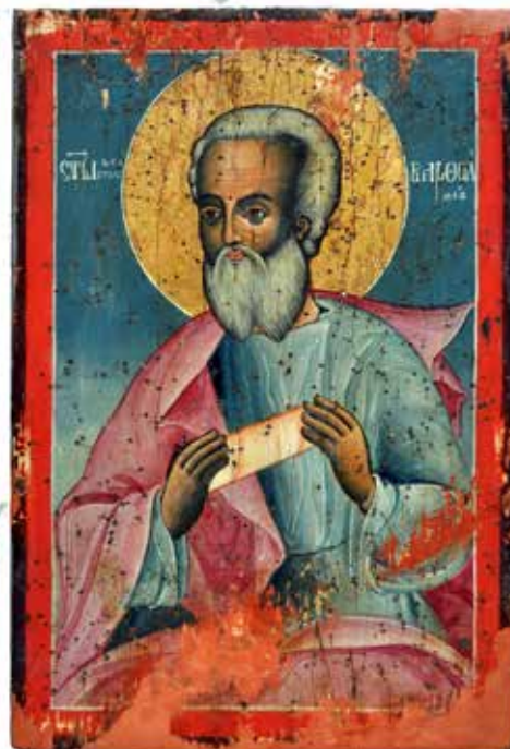
Сл. 16 Пример стања иконе након плумбирања Fig. 16 Example of the condition of the icon after filling the losses