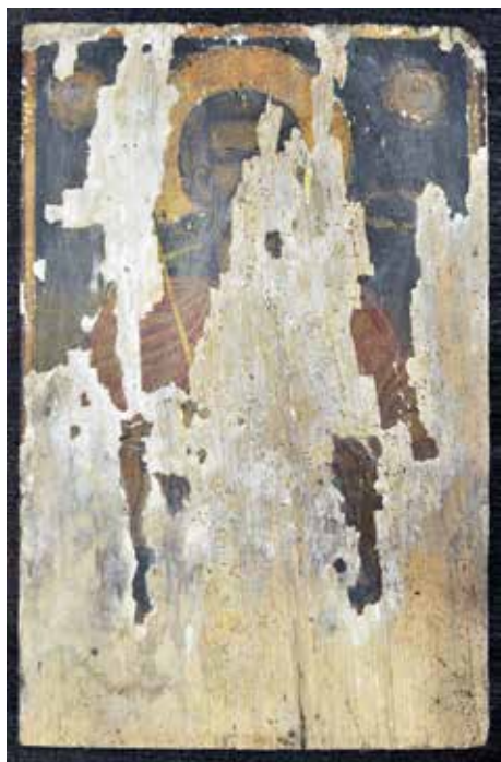
Сл. 4 Затечено стање иконе Св. Романа Fig. 4 Initial condition of the icon of St. Romanus