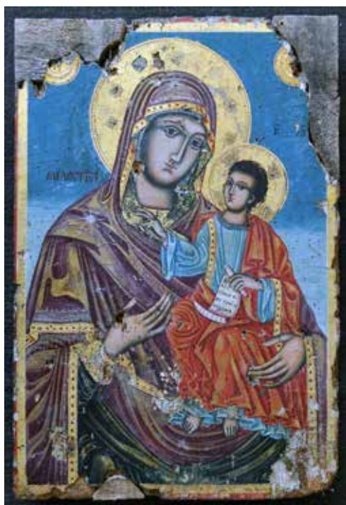
Сл. 14 Пример реконструкције делова који недостају Fig. 14 Example of reconstruction of missing parts