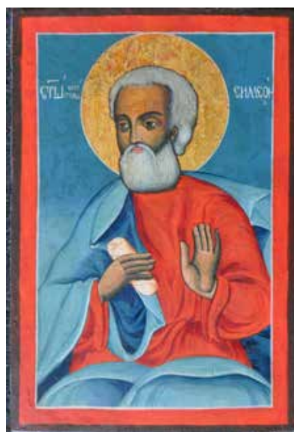
Сл. 26 Св. апостол Симеон након третмана (тек.конс. бр. 13140)