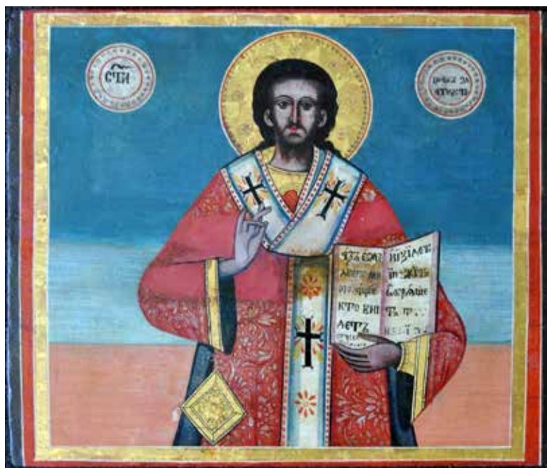
Сл. 22 Св. Јован Златоусти након третмана (тек. конс. бр. 13135)