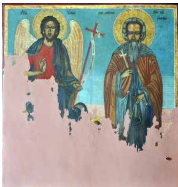
Сл. 20 Јован Крститељ са Св. Романом након третмана (тек. конс. бр. 13141)