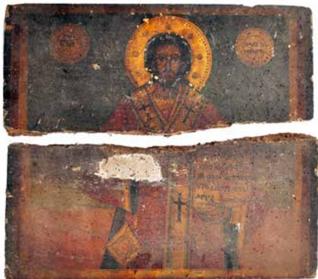
Сл. 5 Затечено стање иконе Св. Јована Злагоустог Fig. 5 Initial condition of the icon of St. John Chrysostom