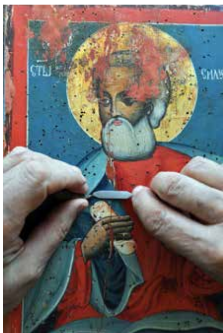
Сл. 17 Попуњавање излазних рупа ксилофага

Fig. 17 Filling the exit holes of xylophagous