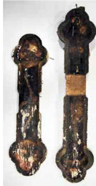
Сл. 11 Затечено стање иконостасног крста са Распећем Fig. 11 Initial condition of the iconostasis cross with the Crucifixion