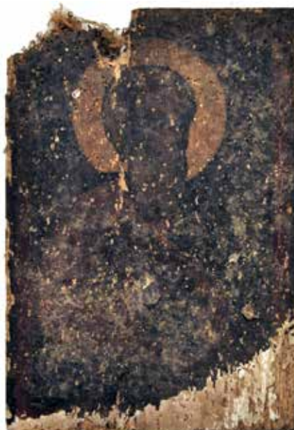
Сл. 8 Затечено стање иконе Св. Апостола Јована