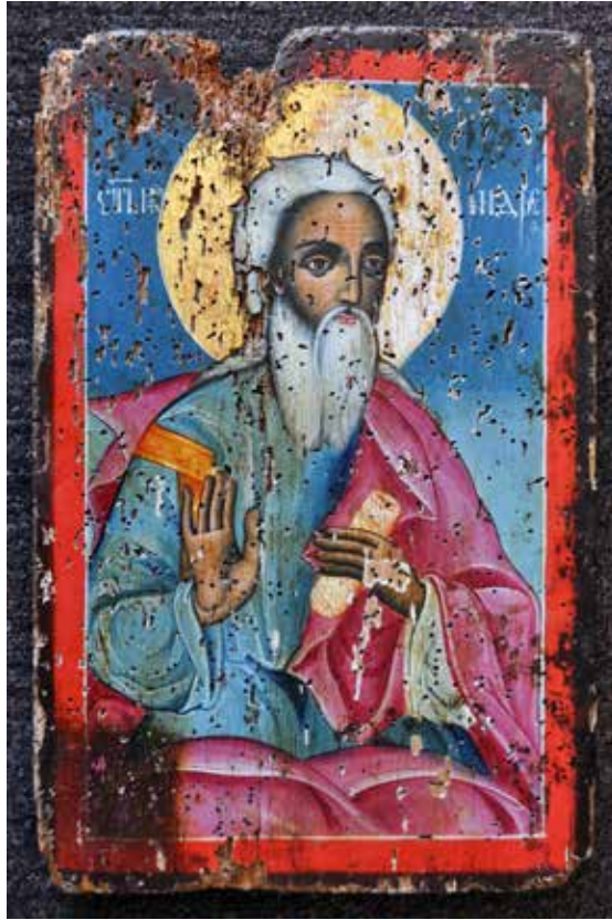
Сл. 10 Затечено стање иконе Св. Апостола Андреја Fig. 10 Initial condition of the icon of St. Andrew