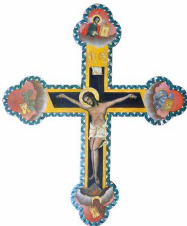
Fig. 28 Iconostasis cross with Crucifixion after treatment (tech. cons. no.: 13143)