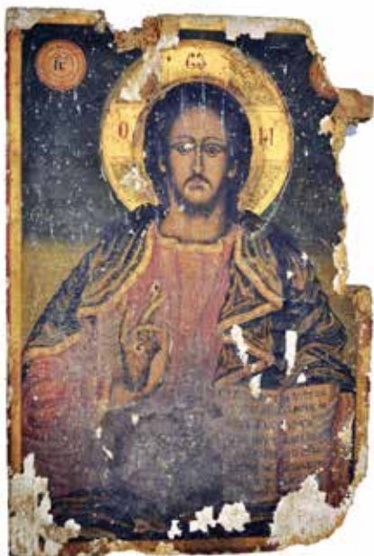
Сл. 1 Затечено стање иконе Христа Fig. 1 Initial condition of the icon of Christ