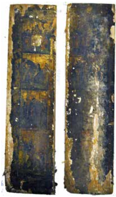
Сл. 6 Затечено стање иконе Празници Fig. 6 Initial condition of the icon of the Feasts