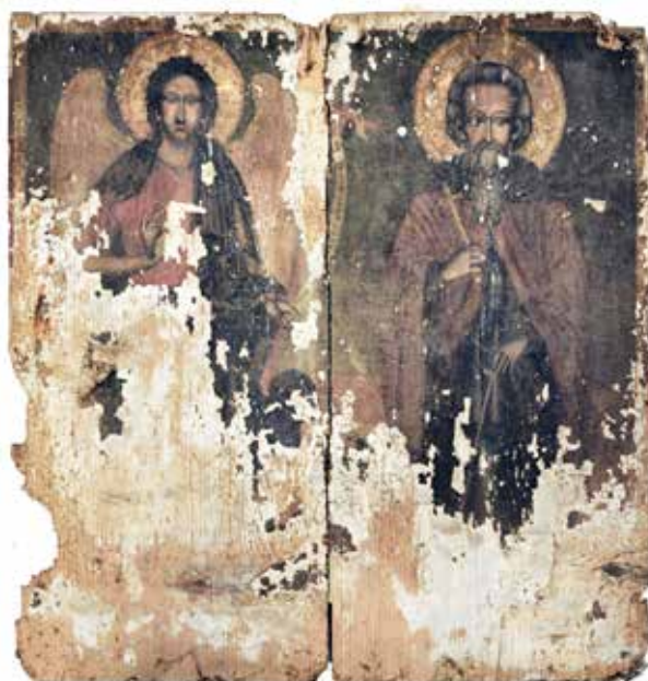
Сл. 3 Затечено стање иконе Св. Романа и Св. Јована Крститеља Fig. 3 Initial condition of the icon of St. Romanus and St. John the Baptist