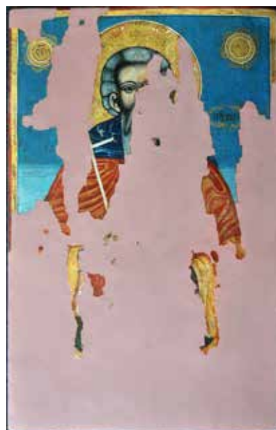
Сл. 21 Св. Роман након третмана (тек. конс. бр. 13142)