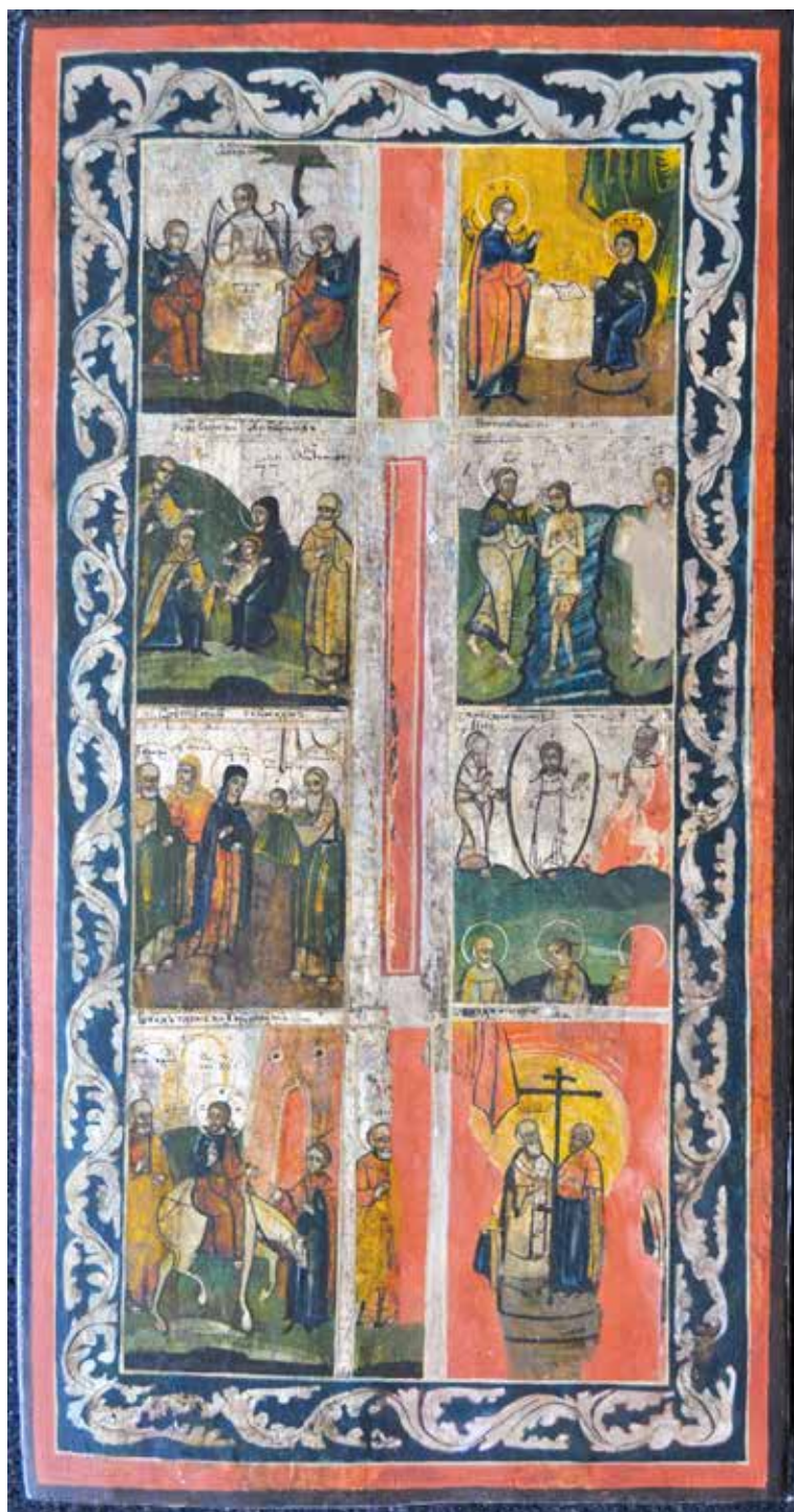
Сл. 23 Празници након третмана (тек. конс. бр.: 13144)