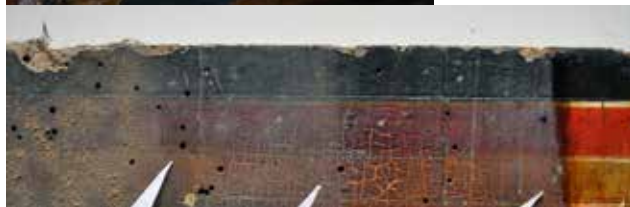
Сл. 13 Сонде прикаазују постепено чишћење у три фазе Fig. 13 Probes show gradual cleaning in three phases