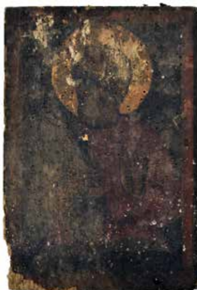
Сл. 9 Затечено стање иконе Св. Апостола Симеона