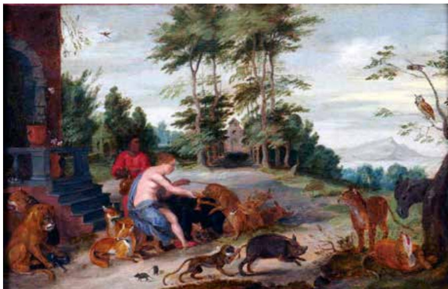
Сл. 3 Кирка и Одисејеви пратиоци , аутор Јан Бројгел II, 1601-1678. Музеј Уметности Универзитета Принстон, САД