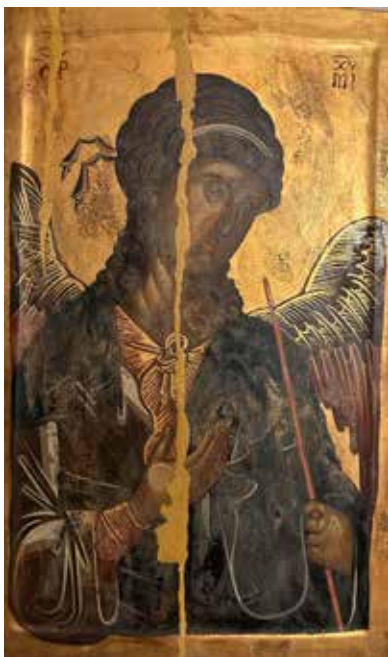
Сл. 8 Архангел Михаил са штапом у руци