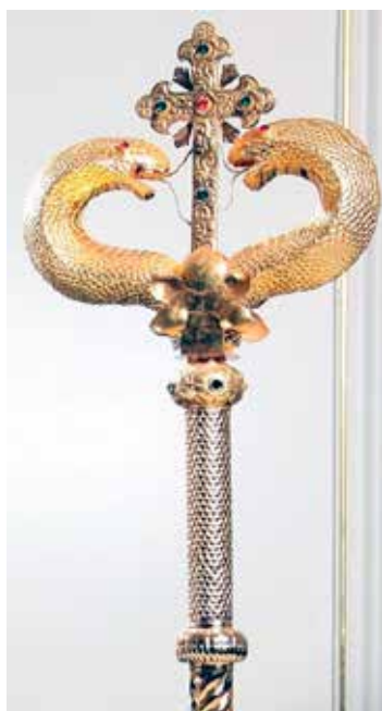
Сл. 7 Жезал сиријског православног епископа који представља Мојсиев штап