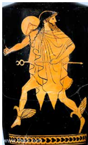
Сл. 4 Хермес , атински црвенофигурал лекитос, 5 века пре нове ере, Метриполитен музеј уметности