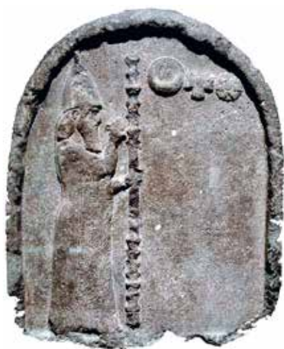
Сл. 1. Набонид, краљ Вавилоније, плоча у Британском музеју

Fig. 1. Nabonidus, King of Babylon , slab in the British Museum