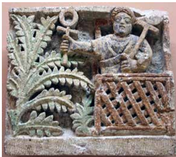
Сл. 2 Литургијски коптски рељеф из 5 века са коптским cruces ansata

Fig. 1. Nabonidus, King of Babylon , slab in the British Museum