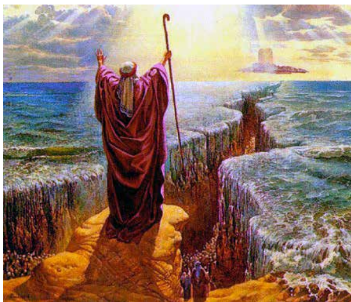
Fig. 6 Genesis 14: 21, 22, Holy Scripture, Bible, Old Testimony

изађу из воде; 31 изазвао патњу људи од ваши; 32 изазвао олују; 33 напад скакаваца 34 итд., показујући да су његове чудотворне моћи биле много јаче од моћи Египћана. Употреба штапа је такође добро позната у епизоди у Књизи Постања , у којој је Мојсије подигао свој штап ка небу и раздвојио море, чиме је помогао Израелцима да побегну из Египта. 35 (Сл. 6)