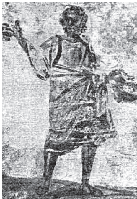
Сл. 2 Фреска Христѡа, Рим, катакомба Домициле (пресликовано из Brehier, L'art chretien , fig. 12)

према гледаоцу. Исти Христов лик се сачувао у апсиди старе Латеранске базилике 44 из почетка 4. века (сл. 5). То је тип са дугом брадом и косом који има превагу у каснијем добу, за разлику од антиохијског хеленистичког лика који је доминирао на саркофазима и групним портретима Христа у јеванђеоским сценама. До скоро се веровало да је мозаички Христов лик сачуван у горњем делу Латеранске базилике не само најстарији, већ се претпостављало да је такав могао бити и у бројним Константиновим базиликама подигнутим широм Римског царства. У техници фреске, на римском гробљу Комодиле, сачувано је попрсје Христа у квадратном оквиру, са ознакама алфа и омега. Ова новооткривена Христова слика је из времена Теодосија 45 (сл. 6).