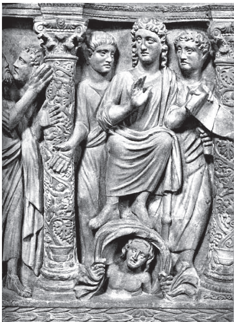
Сл. 15 Саркофаг са Христом с ајосџолима који седе на ѡерсонификацији Космоса, Рим, Латеранска базилика (преликано из Vollbach, Early Christian Art , сл. 45)

Идеју Христа Цара хришћани су имали већ у јудеохришћанском наслеђу, 55 али су симбол прихватили у време тетрархије из царске иконографије Oriens Augusti . Такав је, с једне стране, на мозаичком приказу Христа Хелија у Ватикану (сл. 16) и на пластици саркофага као небеског цара у две варијанте: на саркофагу Јунија Баса и на