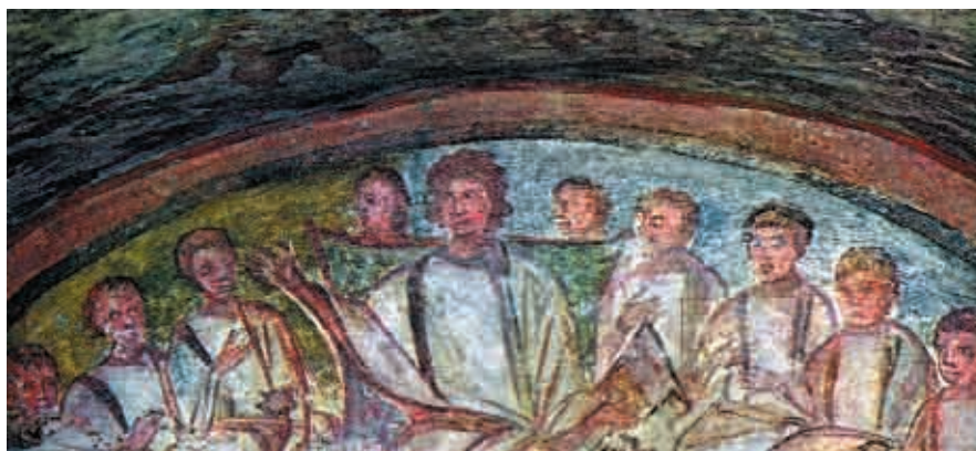
Сл. 14 Христос с апостолима , Рим, катакомба Домициле (пресликано из Grabar, Premier art chrétien , сл. 238)

Марка и Марцелина Петра и Марцелина и Понтијана, Христос се приказује између апостола (сл. 14) или јеванђелиста са отвореним свитком у левој руци и гестом говора десном. Седи на престолима као Господ који даје закон. Царска слика и дворски церемонијал проскинезе су присутни са порукама покривених руку (сл. 15). О томе нам доноси податке Амианус Марцелинус, Грк из Антиохије на Оронту из друге половине 4. века, познат као војсковођа у легијама цара Јулијана и као писац сувремене историје у миру. Лактанције доноси занимљиво тумачење ове Христове слике: „Свуда је са краљевским именима означен не зато што је постигао земаљско царство за које још није дошло време, већ што је задобио небеско и вечито царство” ( Div. inst. 4, 7, 8). Узор је Галеријев лук са царском тријумфалном композицијом кад оба августа седе на престолима изнад небеског свода, као и Христос на саркофазима док два цезара стоје, што је случај и са два апостола уз Христа. О симболици небеског свода и балдахину над престолом пише латински песник Corippus ( In laude Iustini ) на византијском двору.