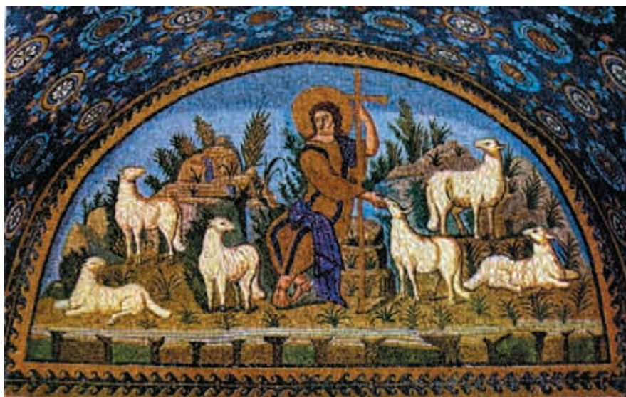
Сл. 12 Мозаик са Христџом Добрим ѡпасѡиром (421), Равена, гроб Гала Плацидије (пресликано из Gerke, Kasna antika , сл. на стр. 76)

са мисијом спаса. Овај лик су живо оцртали синоптички текстови (Мт.18, 12-14; Лк.15, 3-7; Јн.10, 11-16; Јев. 13, 20; 1 Пет. 2, 25). Најбољу формулу мисије Богочовека међу људима дао је апостол Јован: „ Ја сам пастир добри који душу своју полаже на овце”. 51 (сл. 12).