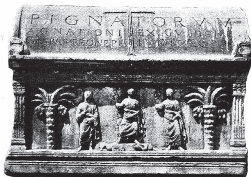
Сл. 17 Христѿос ѓази асѿигу и базилиска, саркофаг Пигната (пресликано из О. Dalton, Byzantine Art and Archeology , сл. на стр. 137)

саркофагу Пигната (сл. 17), Христа победника над мрачним силама светског зла, које је симболично представљено као лав и змија. 56 У посебну групу спадају саркофази из Арла и Фиренце и према етике-ти дворског церемонијала. У дворском церемонијалу краља Јулијана (361-363), према сведочанству Амијана Марцелина, Петар који прих-