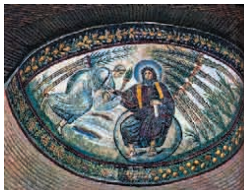
Сл. 18 Христѿос сеги на куѓли земаљској, Рим, Света Констанца (пресликано из Grabar, Premier art chrétien , сл. 207)

вата нови закон, има покривене руке. 57 Међутим, гест Христове десне руке уздигнуте са дланом према гледаоцу понавља мотив са приказа царева Sol Invictus. 58