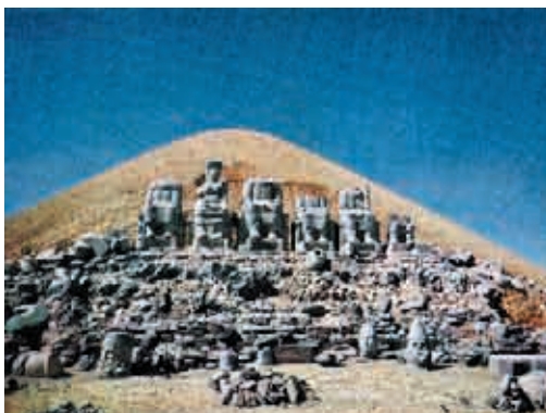
Сл. 13 Богови на престолима и цар Антиоховос међу њима , некропола Антиоха I (69-34) (пресликано из Woolley, сл. на стр. 198)

200. године, за који Еузебије ( Hist. eccl. III, 25, 6) помиње да су га користили гностици, прича се да је новоизабрани апостол Ликомедес наручио да се наслика представа Христа и апостола ( Euseb. Hist. eccl. 26, 9) и стави испред олтара са осветљењем и венцима. Оцењујући слику, апостол каже: „Види се да су још пагански”. У многим пољима Домициле