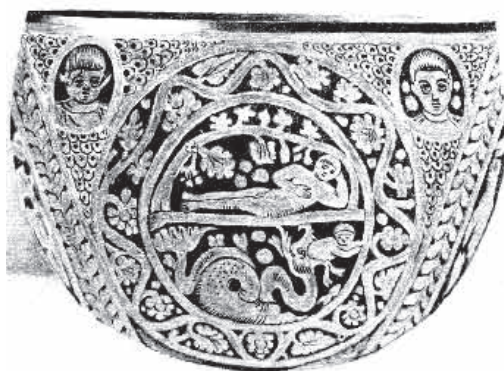
Сл. 9 Јона са Конѕијанћиновим синовима, посуда из Келна (пресликовано из Beckwith, Early Christian and Byzantine Art , сл 10)

Јагње је алегорија Христа присутна у катакомбама и саркофазима, а у литерарним изворима јавља се код Исаије и у Апокалипси. У катакомби Петра и Марцелина (око 370) јагње на брду окружују два светитеља, док је изнад Христос на престолу са крстом изнад њима. На саркофагу Константина III из 421-422. године (сл. 10), око Јагњета Божијег су апостоли, такође у виду јагањаца. На мозаику Светог Витала (540-547) јагње носе четири анђела у клипеу са четири круга који овенчавају Христа агнеца на звезданом небу. На Трулском сабору (692) укинута је симболично приказивање Христа агнеца, а оза-