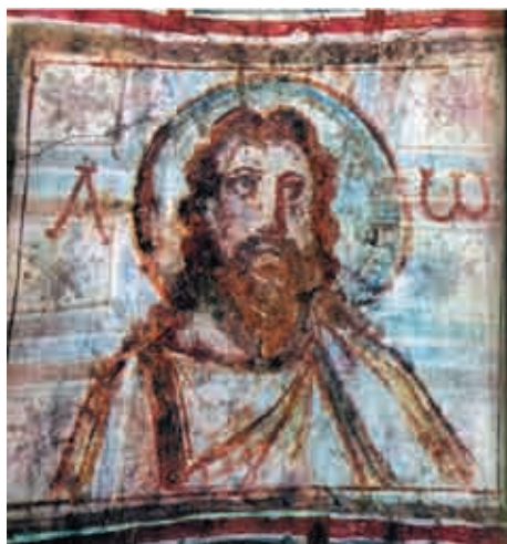
Сл. 6 Фреска са појрсејем Христџа, Рим, катакомба Комодиле (пресликано из А. Grabar, Premier art chrétien , сл. 237)