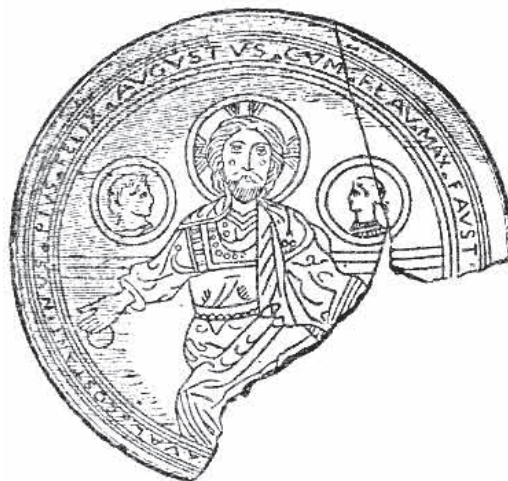
Сл. 4 Тањир Константина Великог (329), Лондон, Британски музеј (пресликано из Гошев, Историјски образ Спасиошеља , сл. 8)