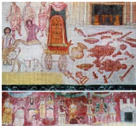
Сл. 7 Фреска Филисџиници огносе Шайџор сведочансџива, синагога у Дура Еуропос, (пресликано из Woolley, Mésopotamie et Asie Antérieure , сл. на стр. 222)

Присциле, уз ленгер је и сигнатура: ЕЛПΣ. И Климент Александријски ( Paed. III, 2) препоручује хришћанима да на своје прстење ставе знак ленгера. Велики број гема са тим украсом сведочи да су хришћани 2. века следили свога учитеља, али овај симбол полако нестаје средином 3. века.