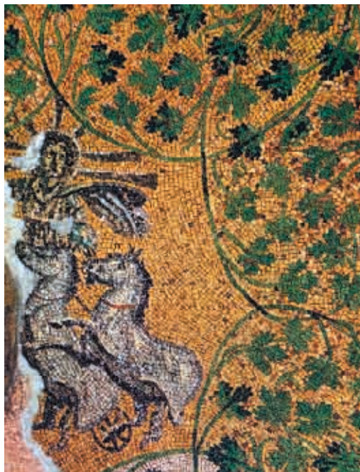
Сл. 16 Мозаик са Христом на сунчаној квадриги (почетак 4. века), Рим, Ватикан