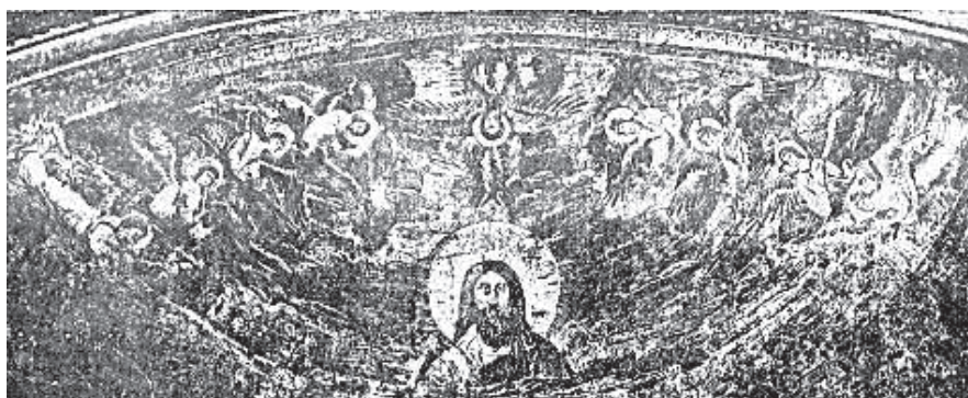
Сл. 5 Фреска Христѡа с анђелима (почетак 4. века), Рим, Латеранска базилика (пресликано из Гошев, сл. 9)

Јаковљева лествица (сл. 8), Успење Илије, Данило у лављој пећини, Три Јевреја у пећи ужареној, Јона, Јов и Тобија крећу се око жртве и искупљења. Јона је веома популаран као тема васкрсења (сл. 9).