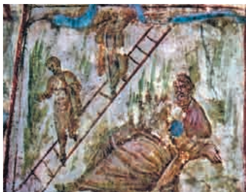
Сл. 8 Фреска Лестџвициа Јаковљева (4. век), Рим, Нова катакомба на Via latina (пресликано из Gerke, Kasna antika , сл. на стр. 102)

помињу с идентичним смислом. По речима Минуција Феликса ( Octavius , 2), сваки човек који се моли треба да својим раширеним рукама опонаша крст. Пре 4. века крст је ипак редак јер је такође значио и место где су се кажњавали зликовци. То схватање је нестало у доба Константина. Код Тертулијана ( Adversus nationes , I, 16) и Минуција Феликса ( Octavius , 9-12) то нарочито замерају непријатељи хришћана.