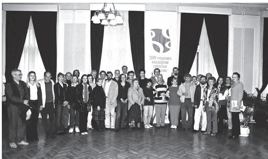
Сл. 3 Учесници научног скупа, Председништво града Ниша Fig. 3 Participants in the Symposium, the Presidency of Niš

и његовог освајања од стране Латина. Ту у Константинопољу очувала се, и преко знаменитих градова какав је био Ниш, зрачила је у дубину Европског континента грачка култура и филозофија, римско право и хришћанска вера. Цивилизацијско и културно жариште, први пут загашено 1204. године, више никада није засијало некадашњим сјајем. И поред свега, остале су јасно видљиве тековине византијске цивилизације чврсто уграђене у темеље савремене Европе.