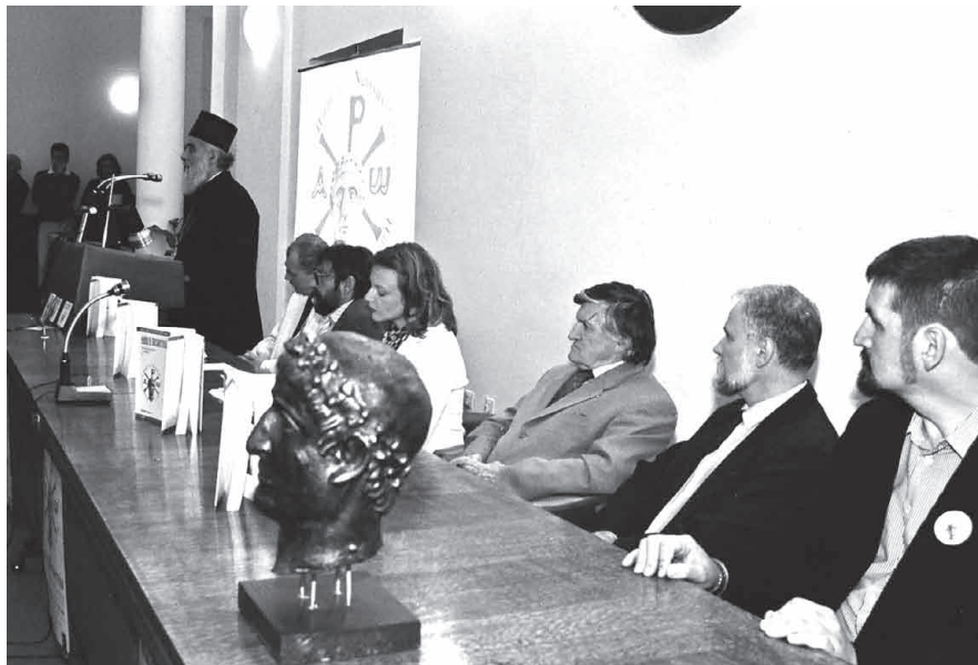
Сл. 1 Отварање научног скупа, благослов Епископа нишког Господина Иринеја Fig. 1 Opening of the Symposium, the blessing of Reverend Irinej, Bishop of the Niš Eparchy

The current times impose that we, united, use all our knowledge to preserve even the tiniest traces of the Byzantine cultural heritage for future generations. Thus we strengthen the foundations of modern Europe and bring closer together its peoples who are, one way or another, heirs of the Byzantine cultural attainments. For