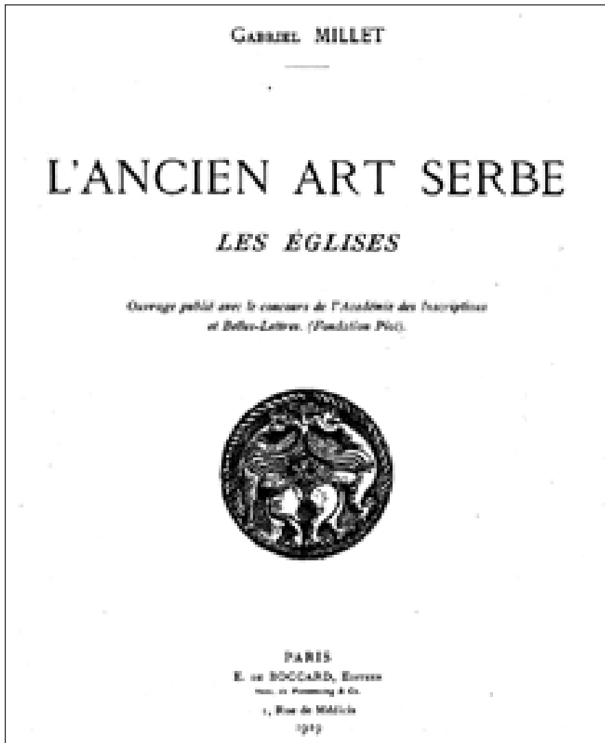
Сл.1. Насловна страна Мијеове књиге „Стара српска уметност. Цркве”, Париз 1919.