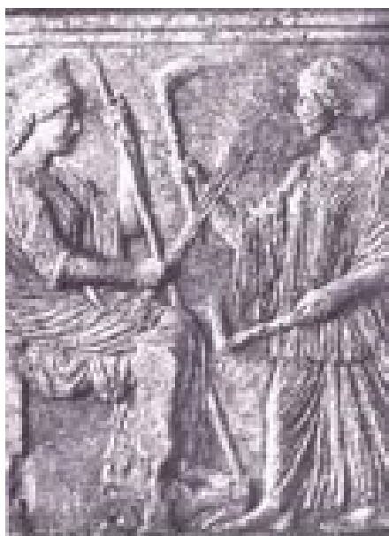
Demeter und Hekate, c. 450 BCE

Деметра и Хеката са снопом жита, 5.сталеће п.н.е