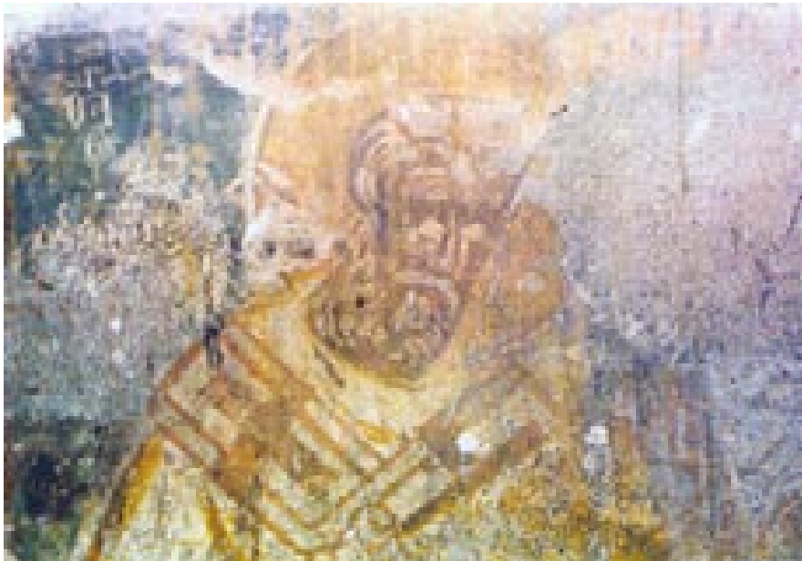
Сл.2. Пештерната црква Св. Стефанв - Панцир, Св. Григориј Богослов –

Од некогашниот фрескоживопис сочувани се остатоци во олтарниот простор и тоа претставата на Св. Богородица со малиот Христос и по еден ангел од страната.