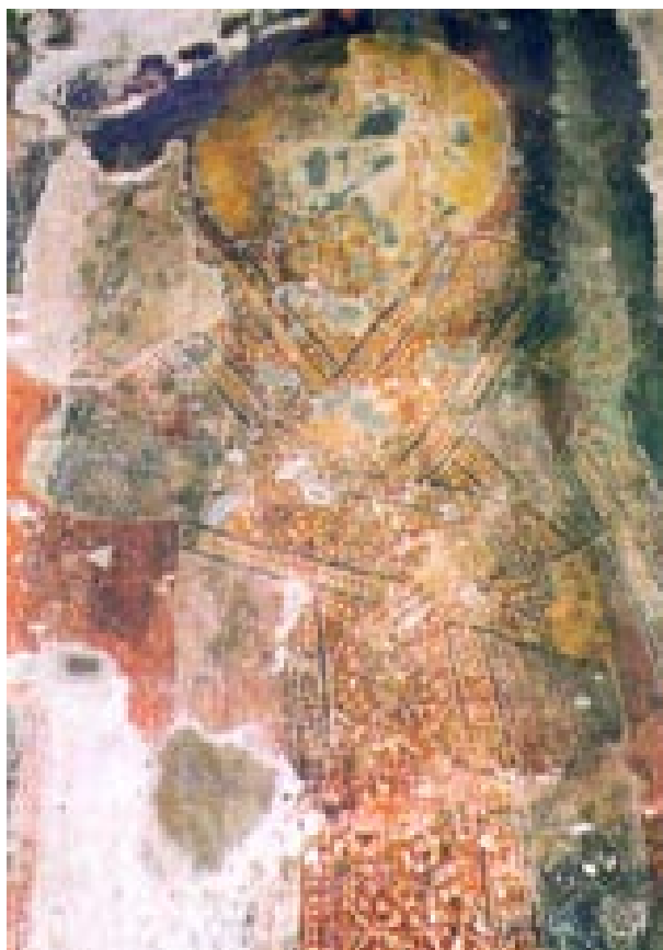
Сл. 9. Пештерната црква Св. Еразмо, Теодор Комнен Дука - Fig. 9. The cave church St. Erasmus, Theodor Comnen Ducas

Овој пештерен храм се наоѓа на околу 2. км. североисточно од струшкото село Вишни, по кањонот на реката Сушица, на местото викано Јавор или Трпезите. Пештерната црква Св. Спас е поставена во една карпа, која што од подножјето па до самиот објект е на висинска разлика од околу 90 м. и истата е совладана со патче вкопано во карестиот терен а во поново време со бетонски скали.