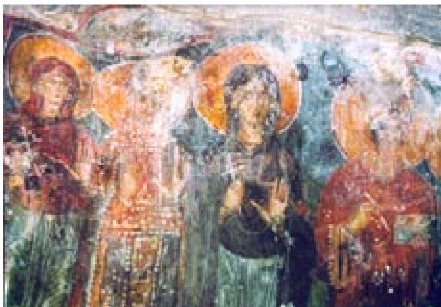
Сл. 8. Пештерна црква Св. Спас - Вознесение Христово, Св. Марина, св. Недела, св. Текла и св. Кузма -