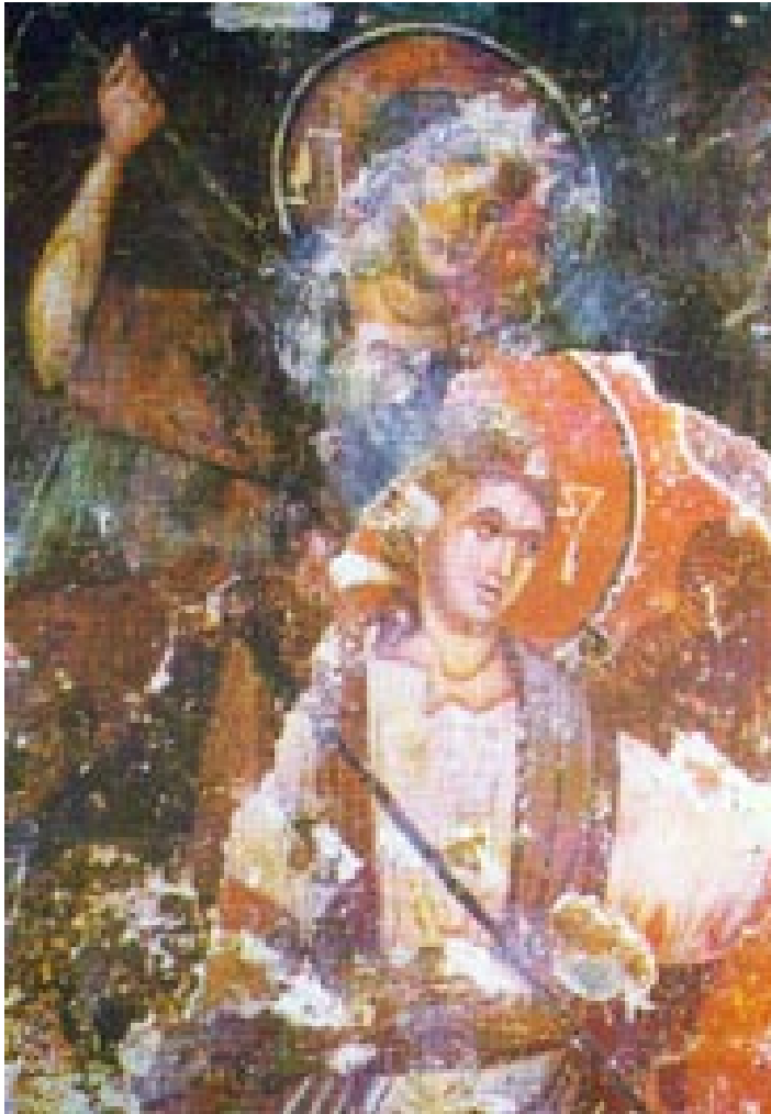
Сл.4. Пештерниот храм Архангел Михаил, с. Радожда, Чудото во Хона-детал - Fig. 4. For the cave church St. Archangel Michael Radozda , The Miracle in Hona-detail

Сместена во карпите на самиот источен брег од Охридското Езеро, под главниот пат што води кон манастирскиот комплекс Св. Наум.