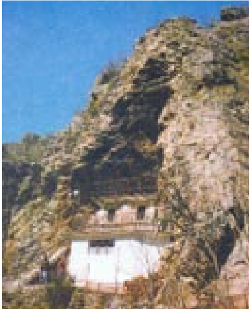
Сл.1. Пештерната црква Воведение на Пресвета Богородица во храм - Канео-

Fig. 1. The cave church The Presentation of the Virgin in the Temple