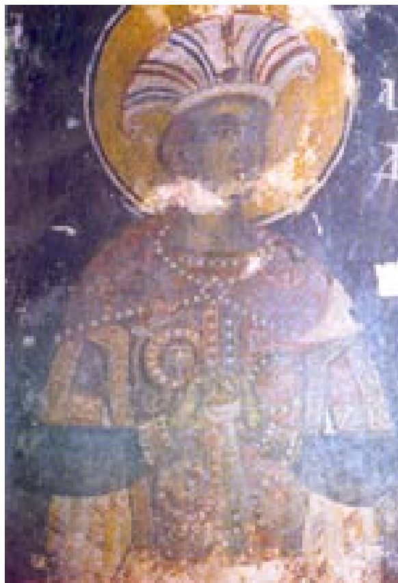
Сл. 10. Пештерната црква Св. Богородица, с. Туминец - Р. Албанија, Св. Александар -

Култот на Св. Еразмо, Антиохискиот епископ и проповедник на Македонските простори се слави уште од времето на Климента и неговата школа и со неговото име се сврзува верувањето дека тој бил првиот проповедник на христијанството во овој град каде што со илјадници ги покрстувал на Белото Езеро.