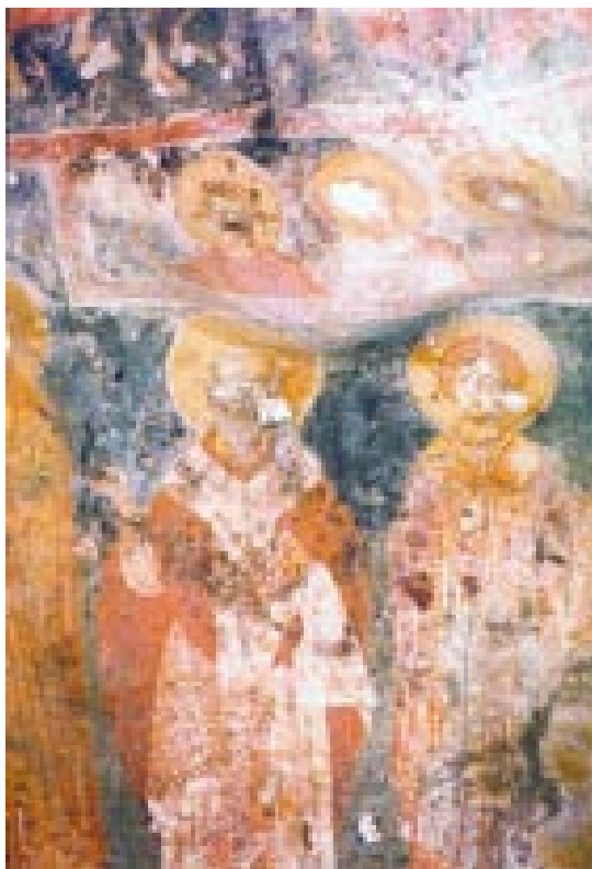
Сл.3. Пештерната црква Св. Богородицав - Пештанска, Св. Никола и св.Горѓи -

Треба да се нагласи дека единствено во овој пештерен храм е сочуван ктиторски натпис од кој дознаваме дека ктитори за неговата изградба и живописување биле граѓаните од Охрид и жителите на околните села: Шипокно, Коњско и Горица. 3