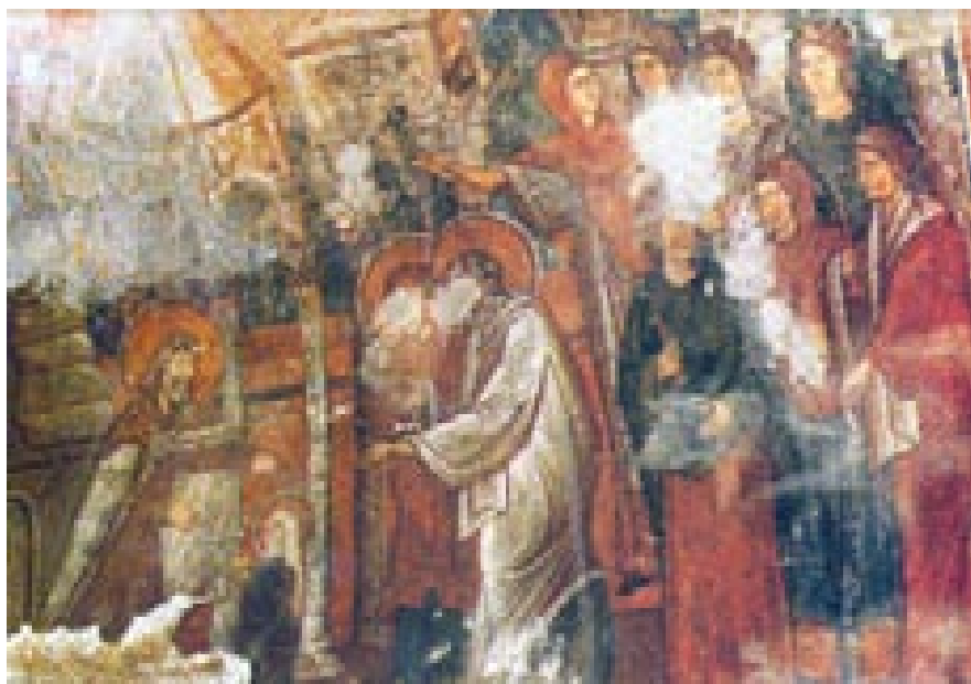
Сл. 5. Пештерниот храм Архангел Михаил, с. Радожда,

Истата се наоѓа во падините на планината Галичица, на нејзината јужна страна наречена Осој, помеѓу туристичкиот камп Љубаништа и манастирскиот комплекс Заум.