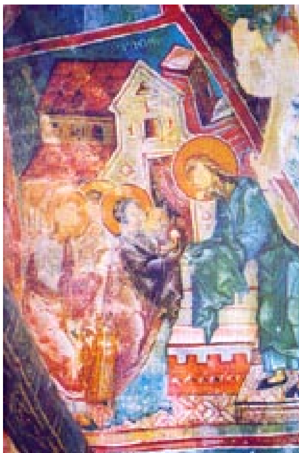
Сл. 6. Пештерната црква Св. Атанасие, Сретеније Христово - Fig. 6. The cave church St. Athanasius, Receiving the Lord