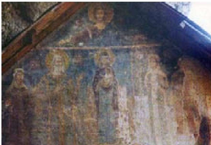
Сл. 11. Пештерната црква Св. Богородица, остров Мал Град, Ктиторска композиција-

Од стариот фрескоживопис останале само фрагменти а ликот на патронот Чудотворецот Николаг е прсликан во XIX век. 13