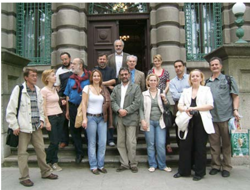
Сл.5. Учесници симпозијума