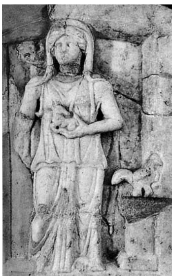
Сл. 2. Рељеф, Romula