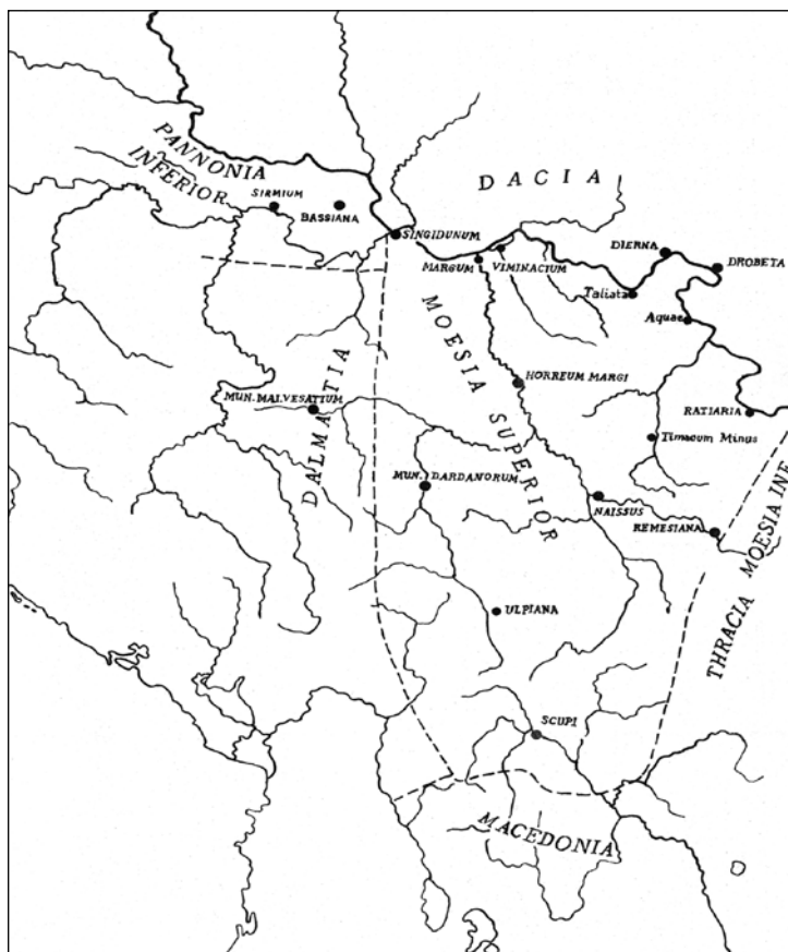
Сл. 7. Централнобалканске провинције Раног царства (према: М. Мирковић, Историја српског народа I , 1981, 73)