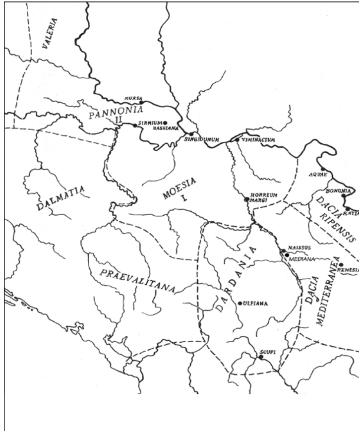
Сл. 8. Централнобалканске провинције Касног царства (према: М. Мирковић, Историја српског народа I , 1981, 93)