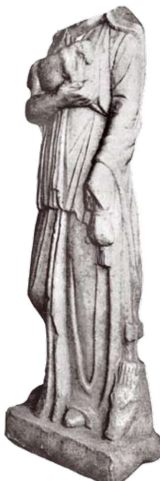
Сл. 1а. Статуа, Mediana

Као што се из описа споменика види, иконографија богиње са рељефа из Ромуле и статуе са Медијане су веома сродне, а како натпис са рељефа показује, реч је о представама Дарданије, божанства које је више пута епиграфски потврђено. Наиме, поред одраније познатог натписа из Куршумлијске бање, датованог у 206. годину, 10 током последње две деценије XX века откривене су још две аре са посветама овој богињи, једна код Витине, датована у 211. годину, 11 и друга у Главнику. 12 Елементи иконографског концепта ове богиње који повезују споменике из