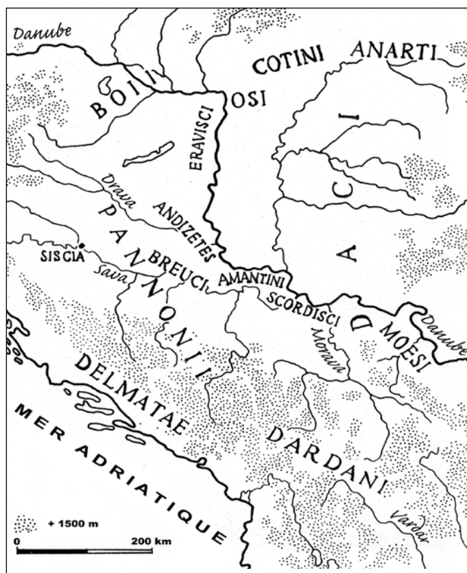
Сл. 6. Централнобалканска племена пред римско освајање (према: A. Mócsy, Pannonia and Upper Moesia , 1974, Fig. 6)