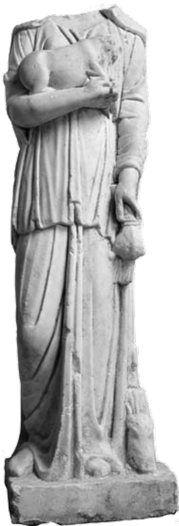
Сл. 1. Статуа, Mediana