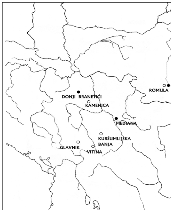
Сл. 5. Налази споменика посвећених божанству Дарданије:

● фигуралне представе; ○ епиграфски споменици