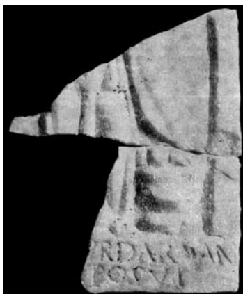
Сл. 3. Рељеф, Romula