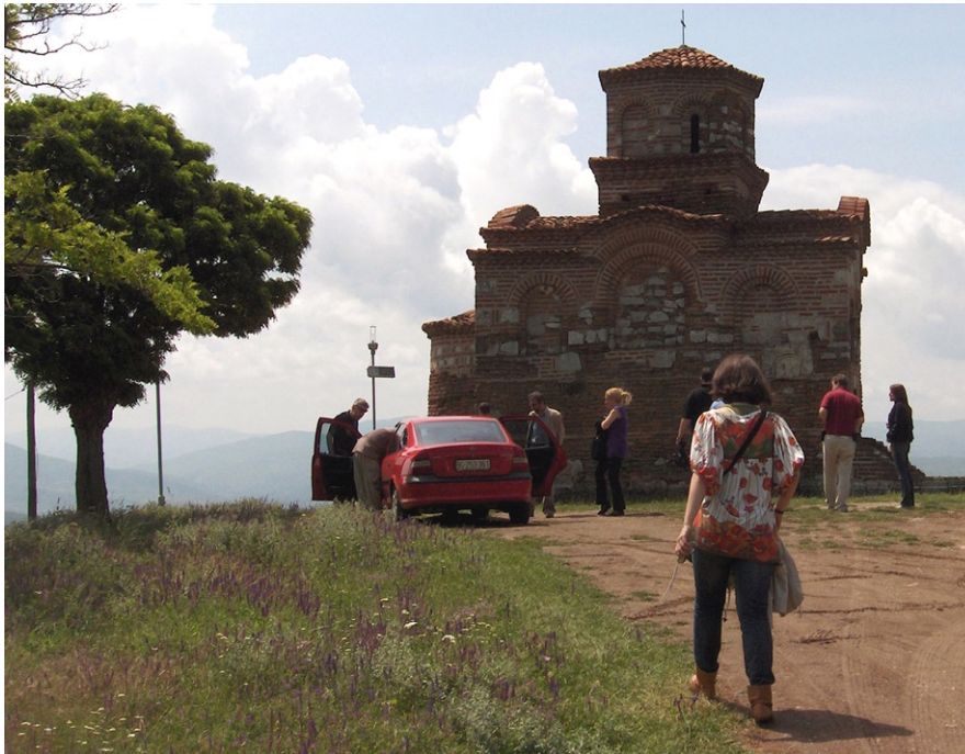
Сл. 3: Обилазак споменика културе, Латинска црква у Горњем Матејевцу Fig. 3: Visit to the cultural monuments, the Latin Church in Gornji Matejevac

и културно обједињени. Зато није чудно, што је, од оног тренутка када је у Нишу рођен свети цар Константин, уз име града додат, бележе стари хроничари, данас помало заборављен епитет славни , који му поново враћају својим присуством и сазнањима еминентни истраживачи.