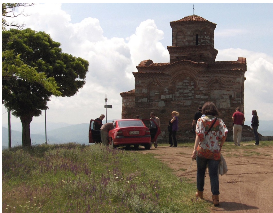
Сл. 3: Обилазак споменика културе, Латинска црква у Горњем Матејевцу Fig. 3: Visit to the cultural monuments, the Latin Church in Gornji Matejevac

и културно обједињени. Зато није чудно, што је, од оног тренутка када је у Нишу рођен свети цар Константин, уз име града додат, бележе стари хроничари, данас помало заборављен епитет славни , који му поново враћају својим присуством и сазнањима еминентни истраживачи.