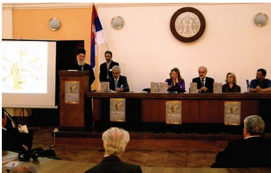
Сл. 1 Владика нишки, сада Његова Светост Патријарх српски Господин Иринеј, Отварање симпозијума Ниш и Византија VIII, сала Универзитета у Нишу, 3. јун 2009. Fig.1 Bishop of Niš, now His Holiness Serbian Patriarch Irinej. Opening of the symposium “Niš and Byzantium VIII”, Hall of the University in Niš, 3 June, 2009

Од доласка епископа Иринеја на чело нишке епархије многе цркве су обновљене и изнова изграђене. Велики број значајних књига, компакт дискова и телевизијских емисија, као и сваки почетак рада византолога на симпозијуму „Ниш и Византија“ заједно са зборницима радова, реализовани су уз благослов Његове Светости Патријарха српског Господина Иринеја.