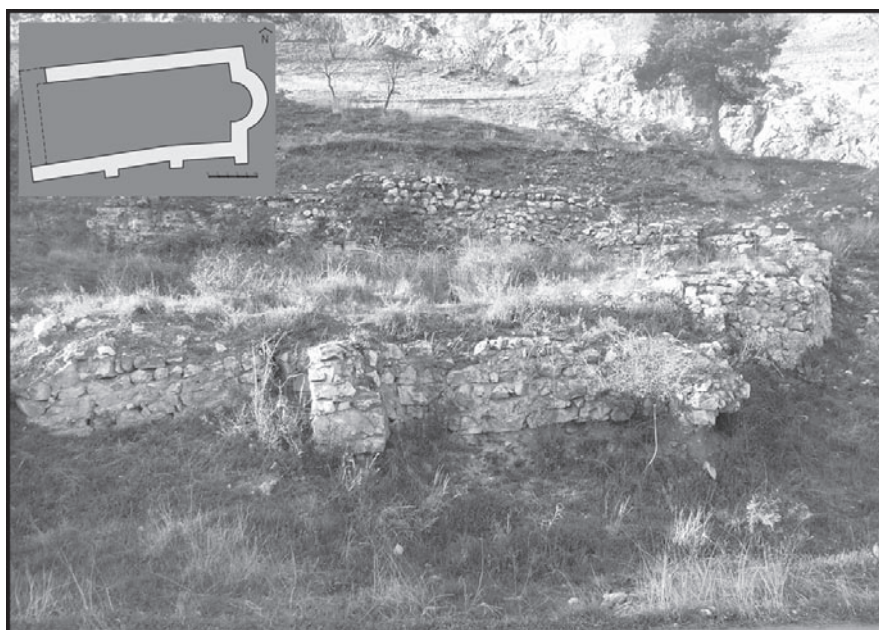
Сл. 3 Ранохришћанска базилика-Е.В. Петровић