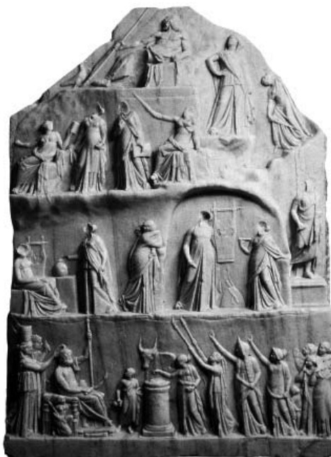
Сл. 3 Рељеф Хомерове апотеозе

Оне се могу наћи и на слоновачи 30 , диптисима, који приказују музу са филозофом, који су у вези са тзв. конзуларним диптисима. Неки сматрају да су управо овакве представе дале инспирацију каснијим представама