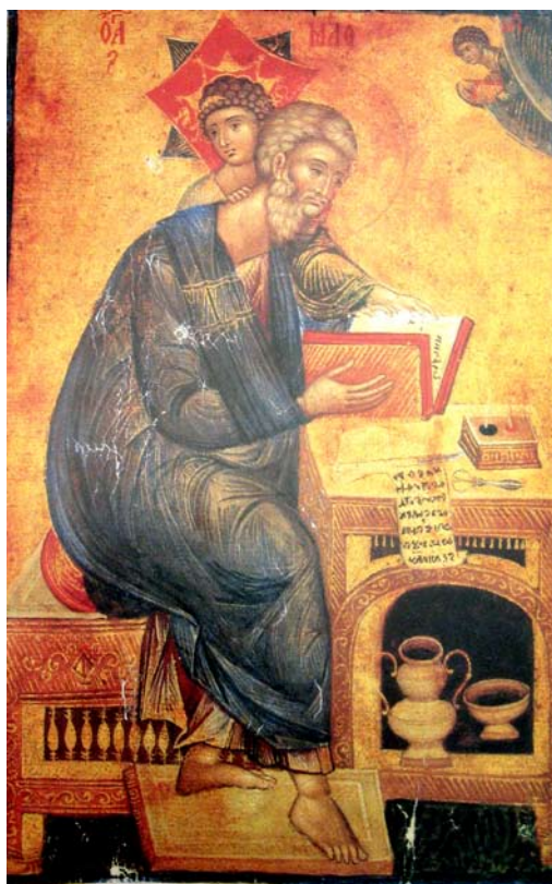
Сл. 1 Представа јеванђелисте Матеје са персонификацијом божанске Премудрости