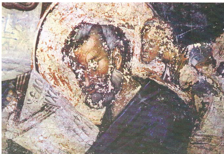
Сл. 5 Манастир Раваница, представа јеванђелисте Марка са персонификацијом божанске Премудрости