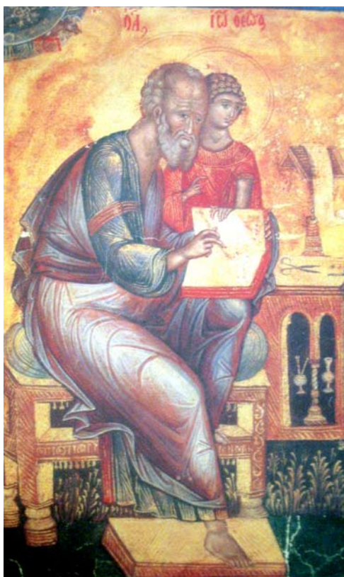
Сл. 2 Представа Јована Богослова са персонификацијом божанске Премудрости (преузето: Радослављево јеванђеље, фототипија старог српског рукописног наслеђа Народне библиотеке)

Грци и Римљани пак преузели, по мишљењима неких научника, из древне Месопотамије и Египта. 4 Персонификације су присутне и у јеврејској култури. 5 Оне су антропоморфне представе неког неживог бића. Све природне појаве, стања тела, емоције, време, политички концепти приказују се у људском, у највећем броју случајева, женском облику. 6 Персонификације налазимо како у литерарним делима, тако и у ликовном представљању и култовима од архајских времена до данас. Разумевање персонификација и данас представља изазов за научника, обзиром да се суочава са проблемима њене дефиниције, одређивања пола, статуса, значења и улоге. 7 Нас овде занима какву улогу имају персонификације у односу песника, писца или филозофа са његовим делом? Да ли је персонификација она која доноси/даје инспирацију или је само преноси или можда само подстиче? Ово питање је изузетно значајно за разумевање и бављење како класичним тако