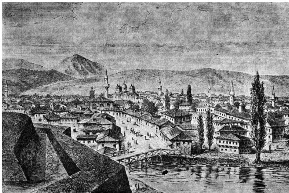
Сл. 7 Изглед Ниша 1884, Illustrierte Zeitung

Н иш – варош – налази се на левој страни реке Нишаве. Град, Београдски крај и "Јагодин мала" с десне стране. Оба дела за сад спаја само један поменути мост пред градом.