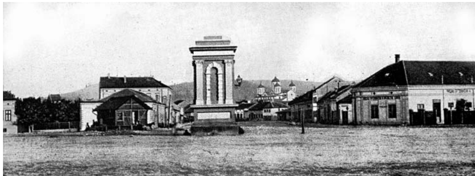
Сл. 9 Трг краља Александра, Чесма краљице Наталије из захвалности краљу Милану Обреновићу ослободиоцу

Како ће се извести даља регулација Ниша – о томе ваљда постоји план. Велики је недостатак, што нема ниједне улице, која би водила право Саборној цркви и учинила да се ова дивна грађевина ма од куд било може видети, док овако нити се од куд сва види, нити јој се откуд може право доћи. Да се од општинске куће просече – постигла би се ова цел. А веле да би се и с довршетком "Муфтијског сокака" исто постигло. Како се год могне – треба да буде!